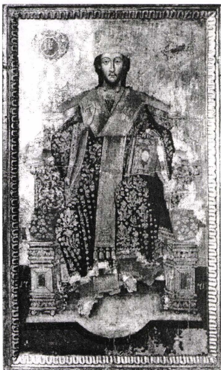
Fig. 1. Isus pe tron.