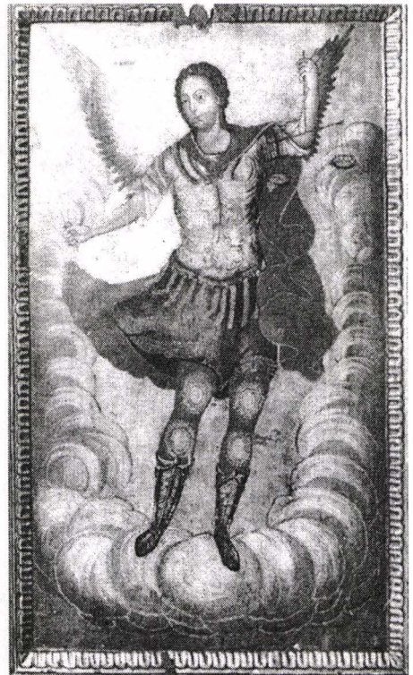
Fig. 6. Arhanghelul Mihail.