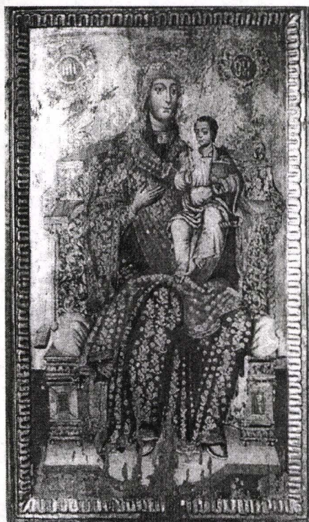
Fig. 2. Maica Domnului cu pruncul