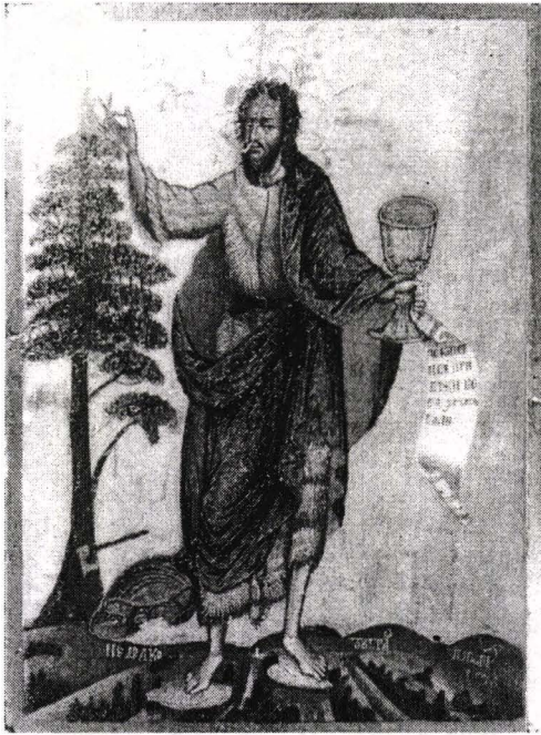
Fig. 3. Sf. Ioan Botezătorul.