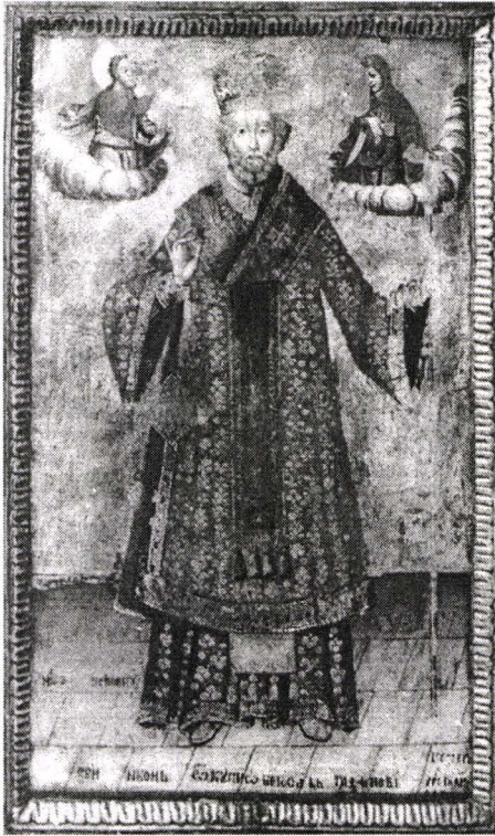
Fig. 5. Sf. Nicolae.