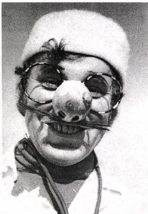
Fig. 8. Medicul din alai. Katowice. 1972. Cehia de Sud.