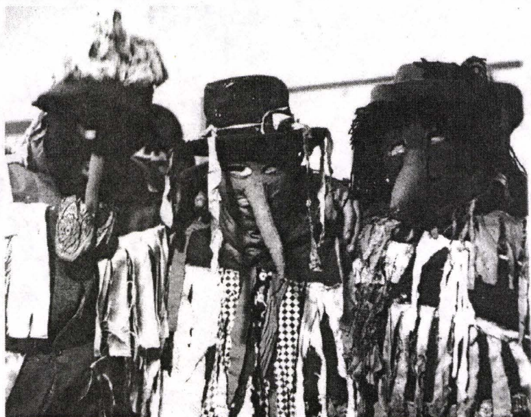
Fig. 6. Măști antropomorfe realizate din zdreńe. Volenice. Cehia de sud. 1972.