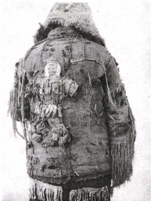
Fig. 5. Masca „karpac” cu păpușa în spate. Alter-ego (celălalt eu). Sud-Vestul Cehiei. Rohanov. 1965.