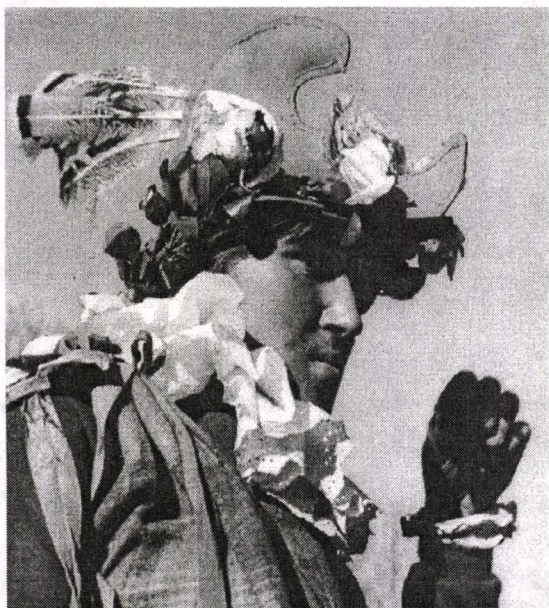
Fig. 4. Călărețul din Srednice – Ținutul ceho-morav. 1877.