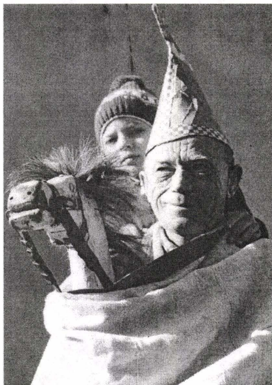
Fig. 3. Călărețul duce în spate pe nepoțel. Dresinek. 1976. Cehia de Sud.