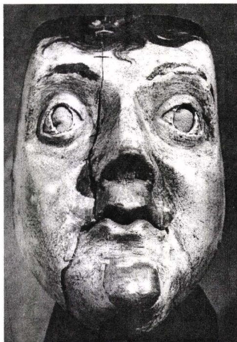
Fig. 7. Țăran. Mască de lemn din Sud-Vestul Cehiei. Colecția Muzeului Cehiei de Vest. Plzn. 1975.