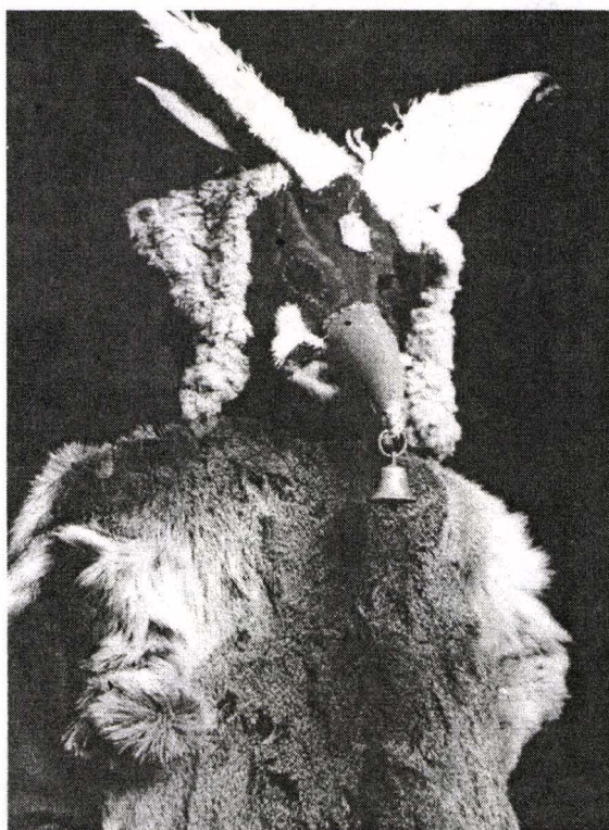
Fig. 2. Mască zoomoră – Vrbice. 1975. Cehia de Sud.