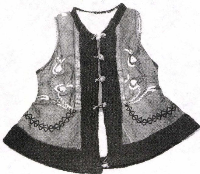
Fig. 4. Pieptar femeiesc din blană. Colecția Muzeului Banatului. Provine din Moldova Veche (jud. Caraș-Severin)