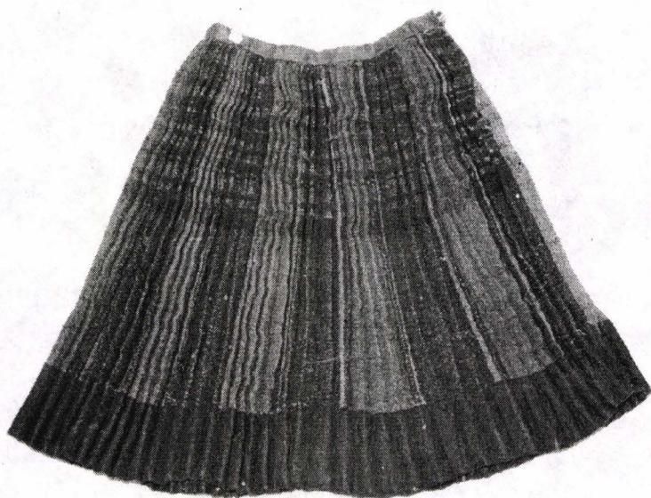
Fig. 3. Fustă plisată din stofă. Colecția Muzeului Banatului. Provine din Măcești (jud. Caraș-Severin)