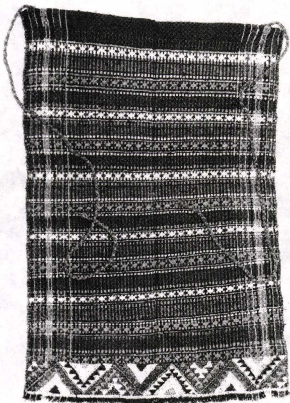
Fig. 5. Catrință. Colecția Muzeului Banatului. Provine din Măcești (jud. Caraș-Severin)