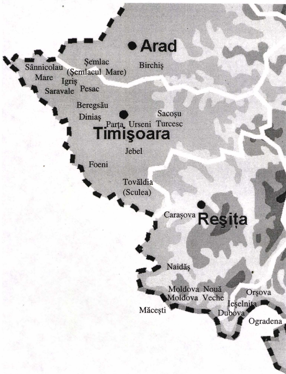
Harta localităților din care provin obiectele.