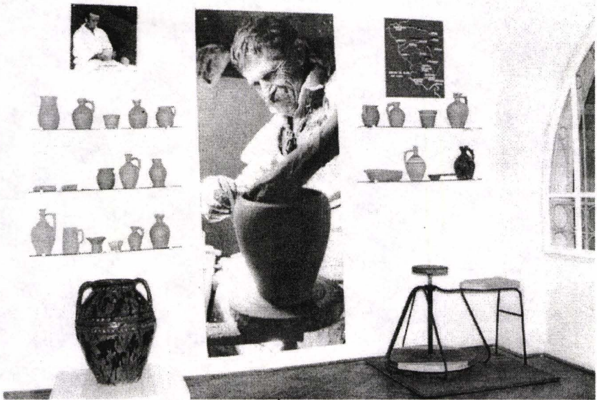
Fig. 3. Aspect din expoziția de ceramică