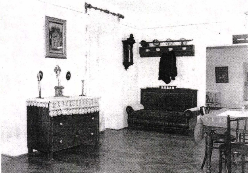
Fig. 2. Colț de interior german