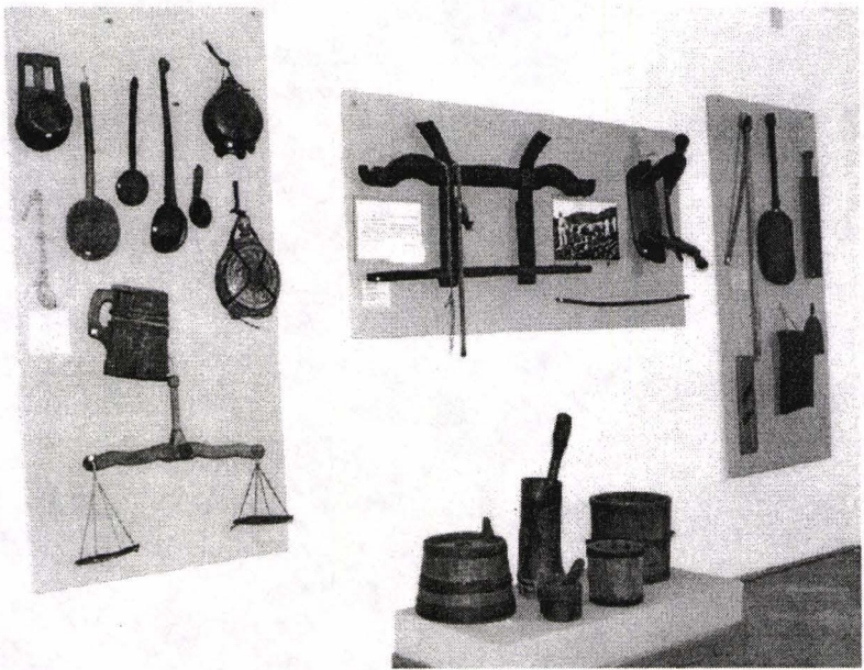
Fig. 4. Aspect din sala „Arta lemnului – ocupații tradiționale”