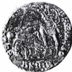
Planșele I-V: Monedele romane târzii din lotul de la Pojejena, jud. Caraș-Severin; (numerele corespund cu cele din catalog).