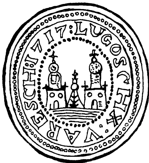
Fig. 1. Sigiliul comunei Lugojul Român (după Iványi István, Lugos története , p. 96); scellé de la commune de Lugojul Român.