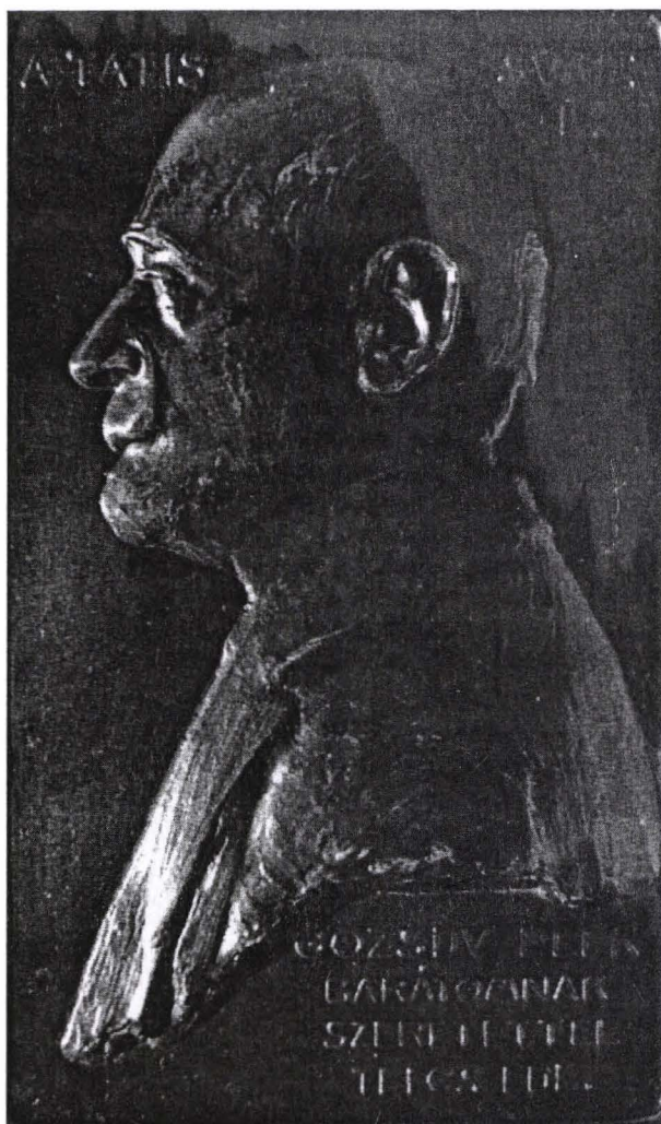
I. Placheta lui Gozsdu Elek, realizată de Telcs Ede The plaque of Gozsdu Elek, made by Telcs Ede