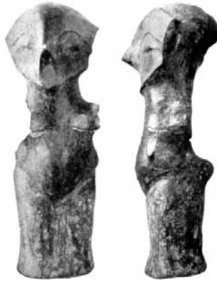
Fig 5: Statuetă (Vidovdanka) descoperită la Vinča, 6,2 m adâncime (Vasić M., 1936)