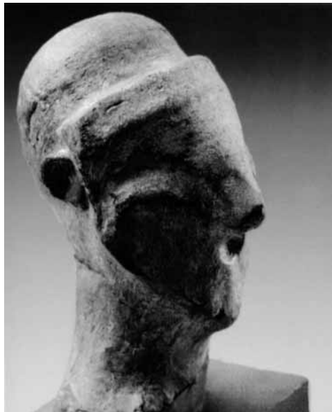
Fig 6: Capul unei figurine descoperită la Vinča la 5,7 (7,5) m. adâncime. Redarea feței ne sugerează existența unei măști. (după Srejovic D., et alii. 1984)