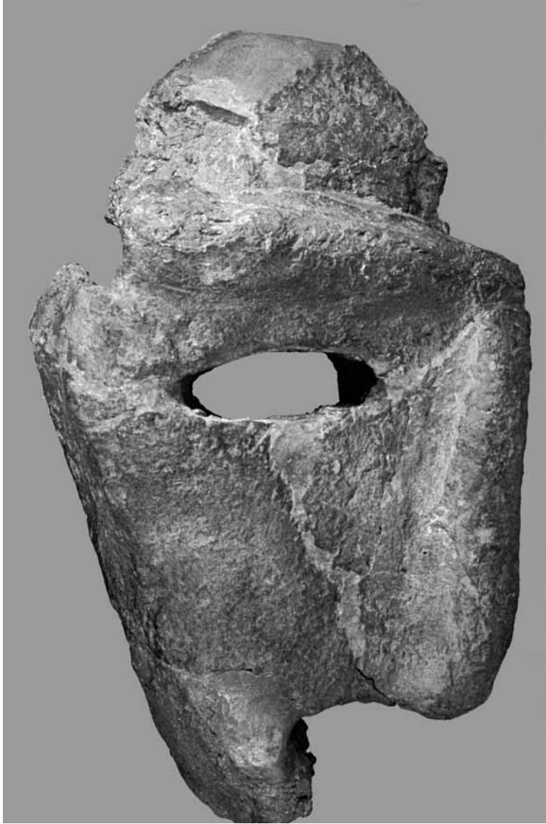
Fig 2: Fragmentul de mască de la Uivar.