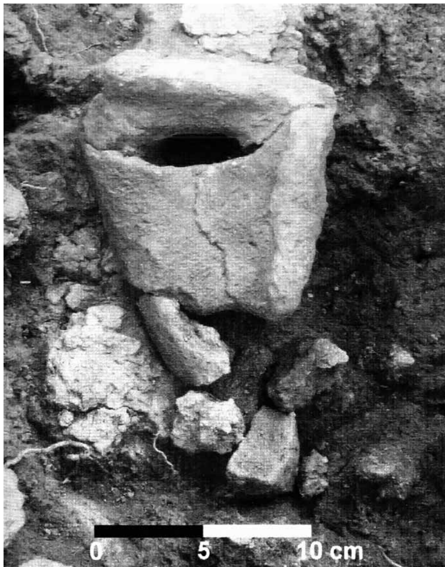
Fig 1: Fragmentul de mască descoperită în fundația unei case de la Uivar (in situ).