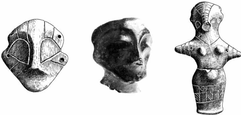
Fig 4: Figurine din etapele târzii ale culturii Vinča. Stânga: capul unei figurine descoperită la Vinča – 2,5 m adâncime. Mijloc: capul unei figurine modelate realist, Vinča – 5,1 m adâncime. Dreapta: figurină de la Vinča – 4,7 (5,2) m. adâncime (Srejović D., et alii. 1984)