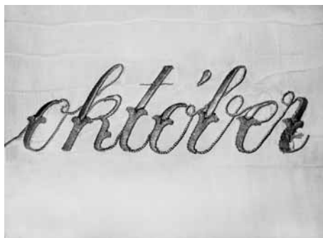
Materialul textil, deteriorări, detalii.