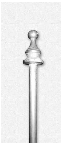
Vârful de vergea.