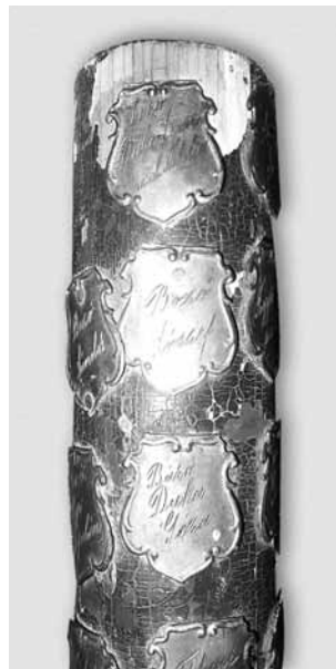
Detaliu hampă cu plăcuțe mari.