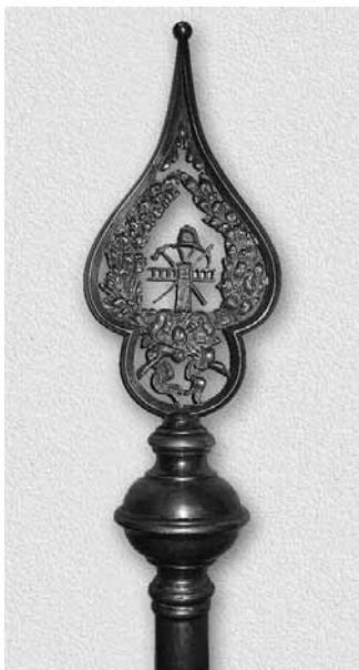
Vârful ornamental al hampei.