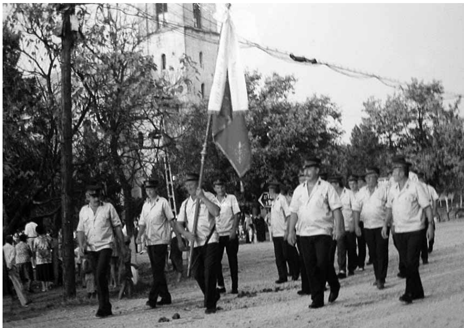
Pompierii voluntari cu steagul în defilare cu ocazia „Zilelor Tormăcene” în 2003.