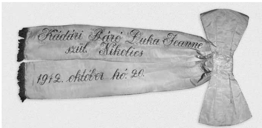
Fundă inaugurală cu panglici.