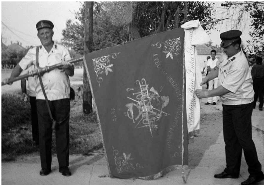
Steagul cu accesorii.