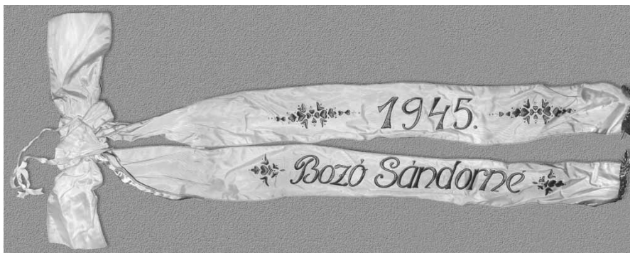
Fundă, ulterior confecționată.