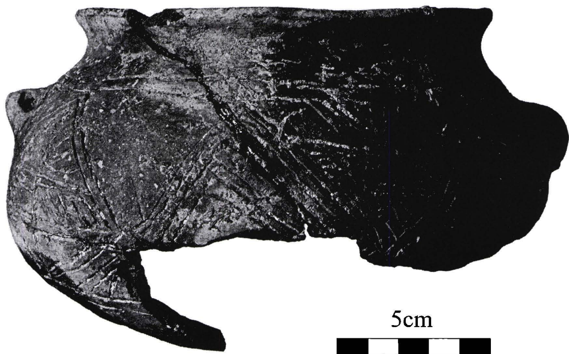
Abb. 3: Für die Makó-Kosihy-Čaka-Kultur singuläres Gefäß mit umlaufendem Zierzonenfries aus Uivar-Gomila.