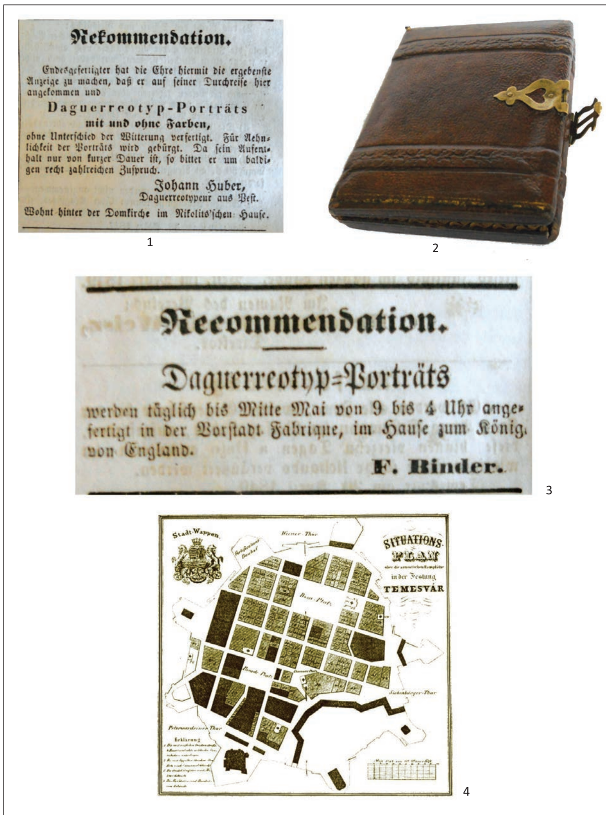
Pl. II. 1. Anunțul lui Johan Huber din Temeswarer Wochenblatt, 10 aprilie 1847, nr. 15; 2. Casetă pentru dagherotip din piele, cca 1845–1850 (colecția autorului); 3. Anunțul lui F. Binder din Temeswarer Wochenblatt, 28 aprilie 1849, nr. 17; 4. Planul Cetații din Timișoara în anul 1849 (după J. N. Preyer) / 1. The announcement of Johan Huber from Temeswarer Wochenblatt, 10 April 1847, no. 15; 2. Leather daguerreotype case, ca. 1845–1850 (author's collection); 3. The announcement of F. Binder from Temeswarer Wochenblatt, 28 April 1849, no. 17; 4. The map of center of Timisoara in the year 1849 (after J. N. Preyer).