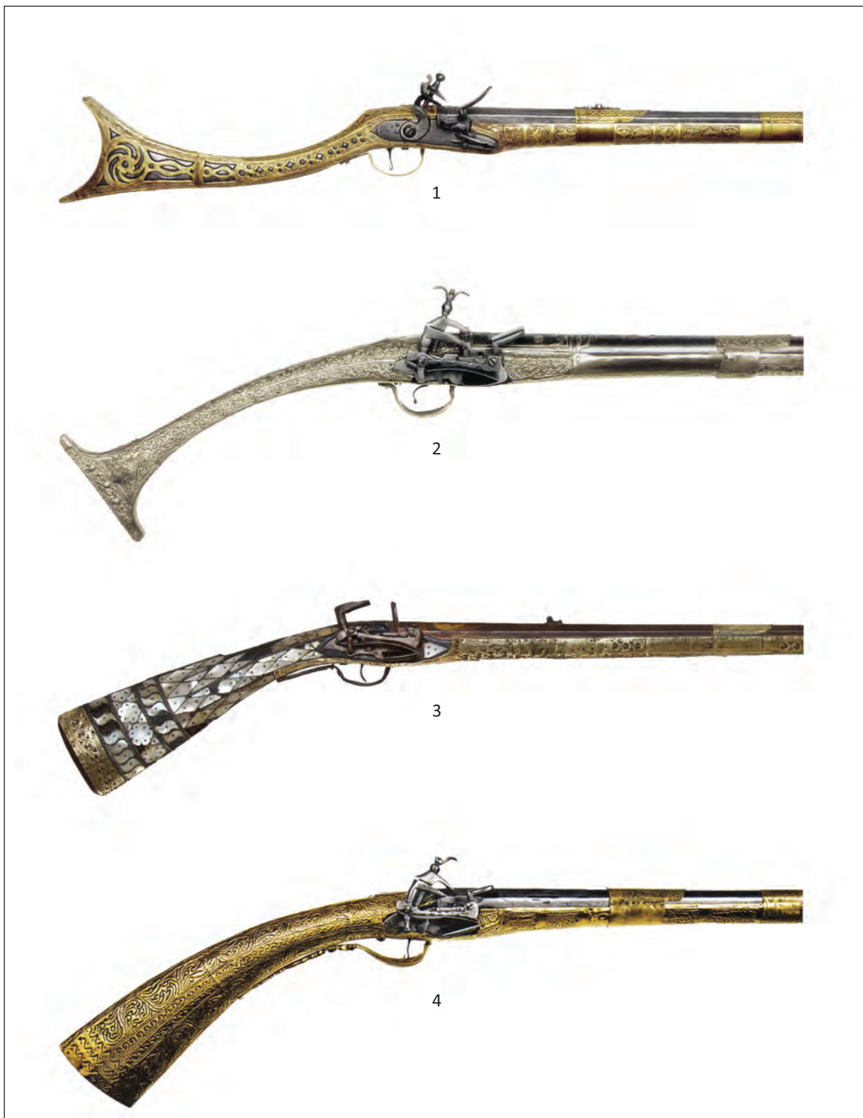
PI. II. 1. Pușcă cu cremene de tipul rašak (apud Robert Elgood, The Arms of Greece and Her Balkan Neighbors in the Ottoman Period ); 2. Pușcă cu cremene de tipul karanfilka (apud Robert Elgood, The Arms of Greece and Her Balkan Neighbors in the Ottoman Period ); 3. Pușcă cu cremene de tipul džeferdar (colecția Muzeului Banatului Timișoara); 4. Pușcă cu cremene de tipul čibuklija (apud Robert Elgood, The Arms of Greece and Her Balkan Neighbors in the Ottoman Period ). / 1. Rašak type flintlock rifle (apud Robert Elgood, The Arms of Greece and Her Balkan Neighbors in the Ottoman Period ); 2. Karanfilka type flintlock rifle (apud Robert Elgood, The Arms of Greece and Her Balkan Neighbors in the Ottoman Period ); 3. Džeferdar type flintlock rifle (Banat Museum collection); 4. Čibuklija type flintlock rifle (apud Robert Elgood, The Arms of Greece and Her Balkan Neighbors in the Ottoman Period ).