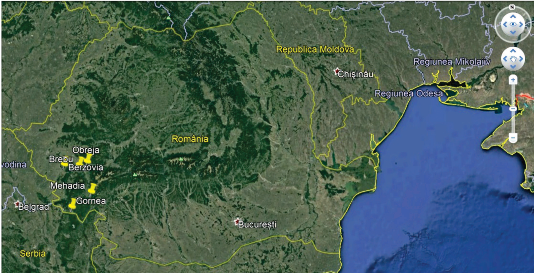
Pl. I Harta descoperirilor/ The map of the discovery