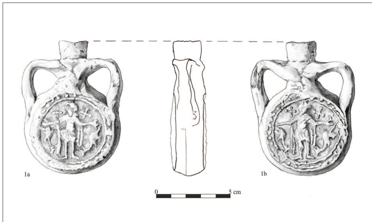
Pl. I. Ploscuță cu reprezentarea Sfântului Mina, descoperită la Dierna/Orșova (?), nr. inv.6572-desen. / Saint Menas flask, discovered in Dierna/Orșova (?), inventory no. 6572 – drawing.