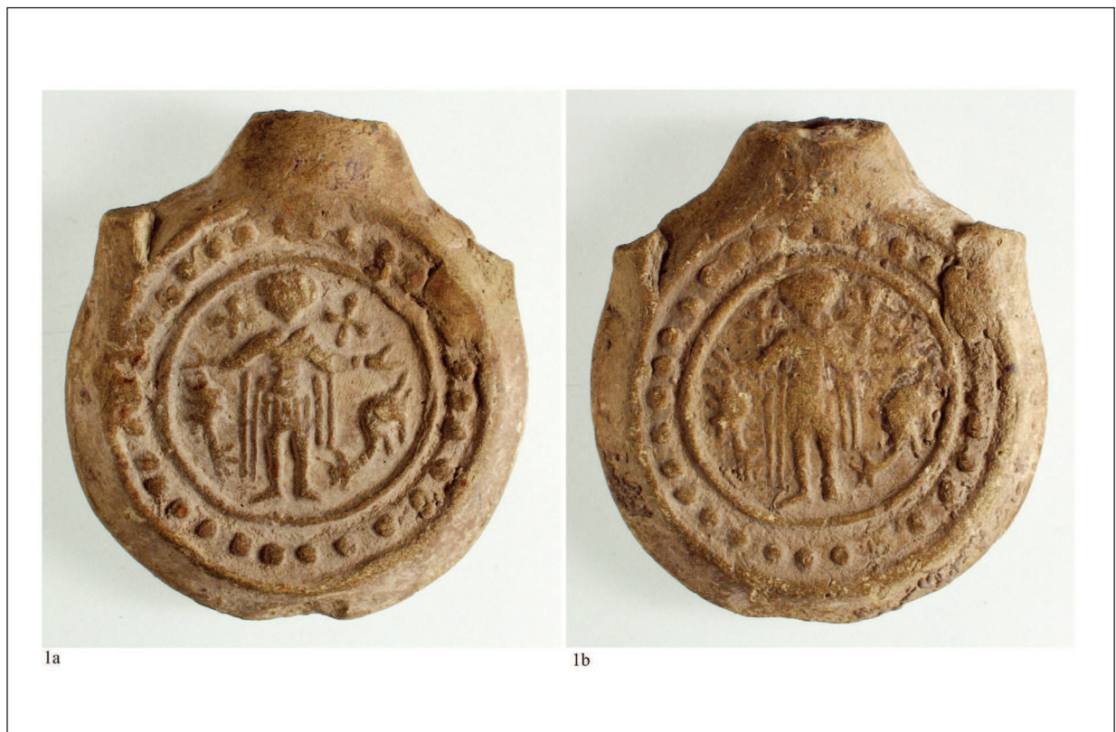
Pl. IV. Ploscuță cu reprezentarea Sfântului Mina, loc de descoperire necunoscut, nr. inv.36.972-foto. / Saint Menas flask, unknow discovery place, inventory no. 36.972 – photo.