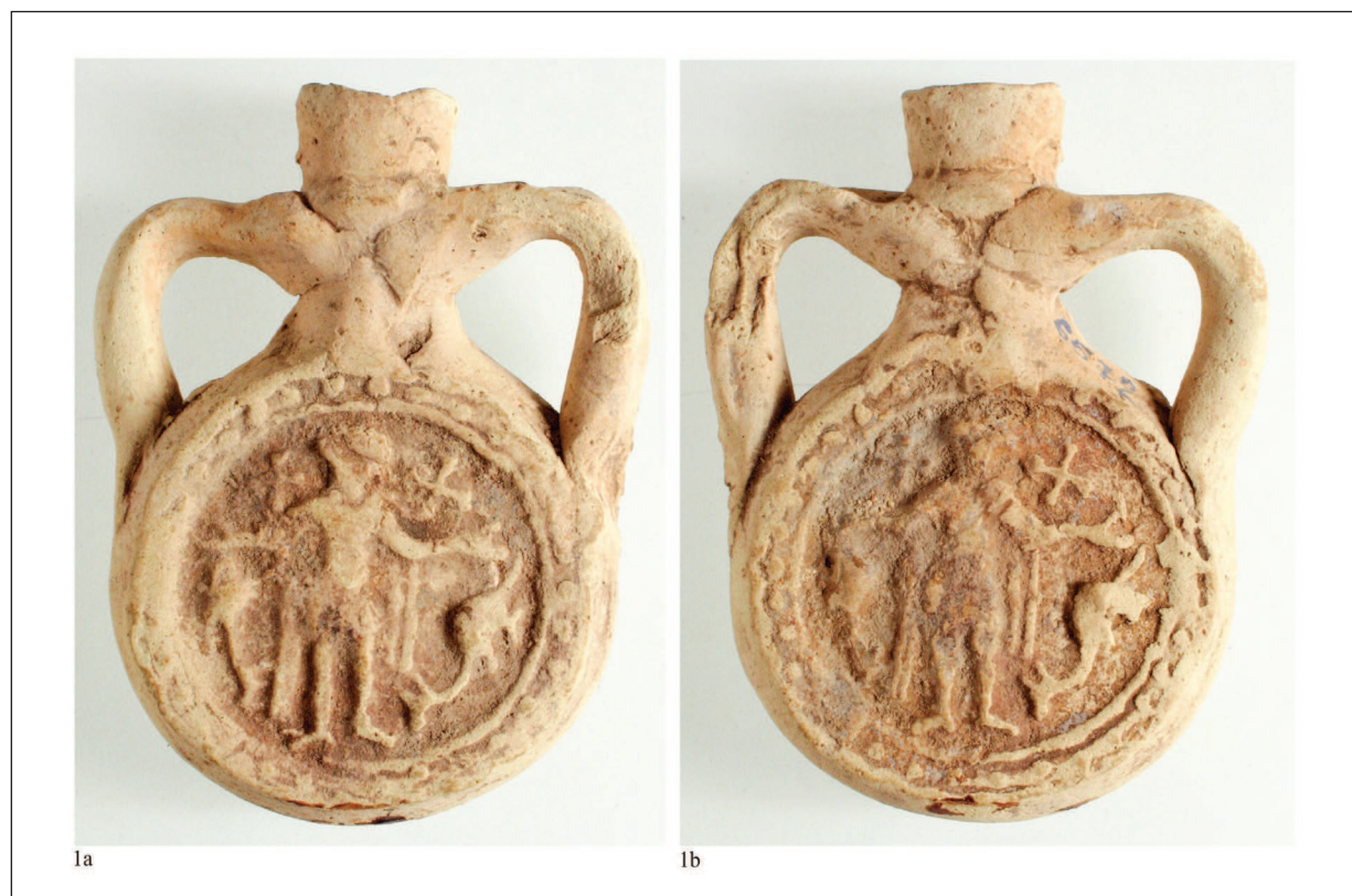
Pl. II. Ploscuță cu reprezentarea Sfântului Mina, descoperită la Dierna/Orșova (?), nr. inv.6572-foto. / Saint Menas flask, discovered in Dierna/Orșova (?), inventory no. 6572 – photo.