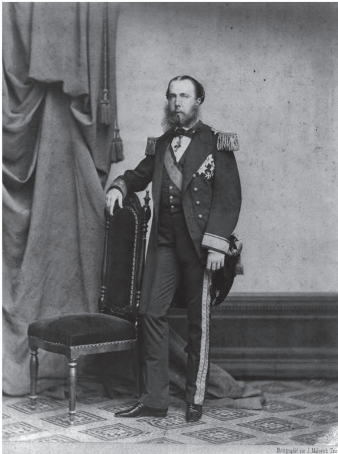
Pl. III. Ferdinand Maximilian Josef von Habsburg, arhiduce de Austria, împărat al Mexicului (1864–1867), / Ferdinand Maximilian Josef von Habsburg, Archduke of Austria, Emperor of Mexico (1864–1867)