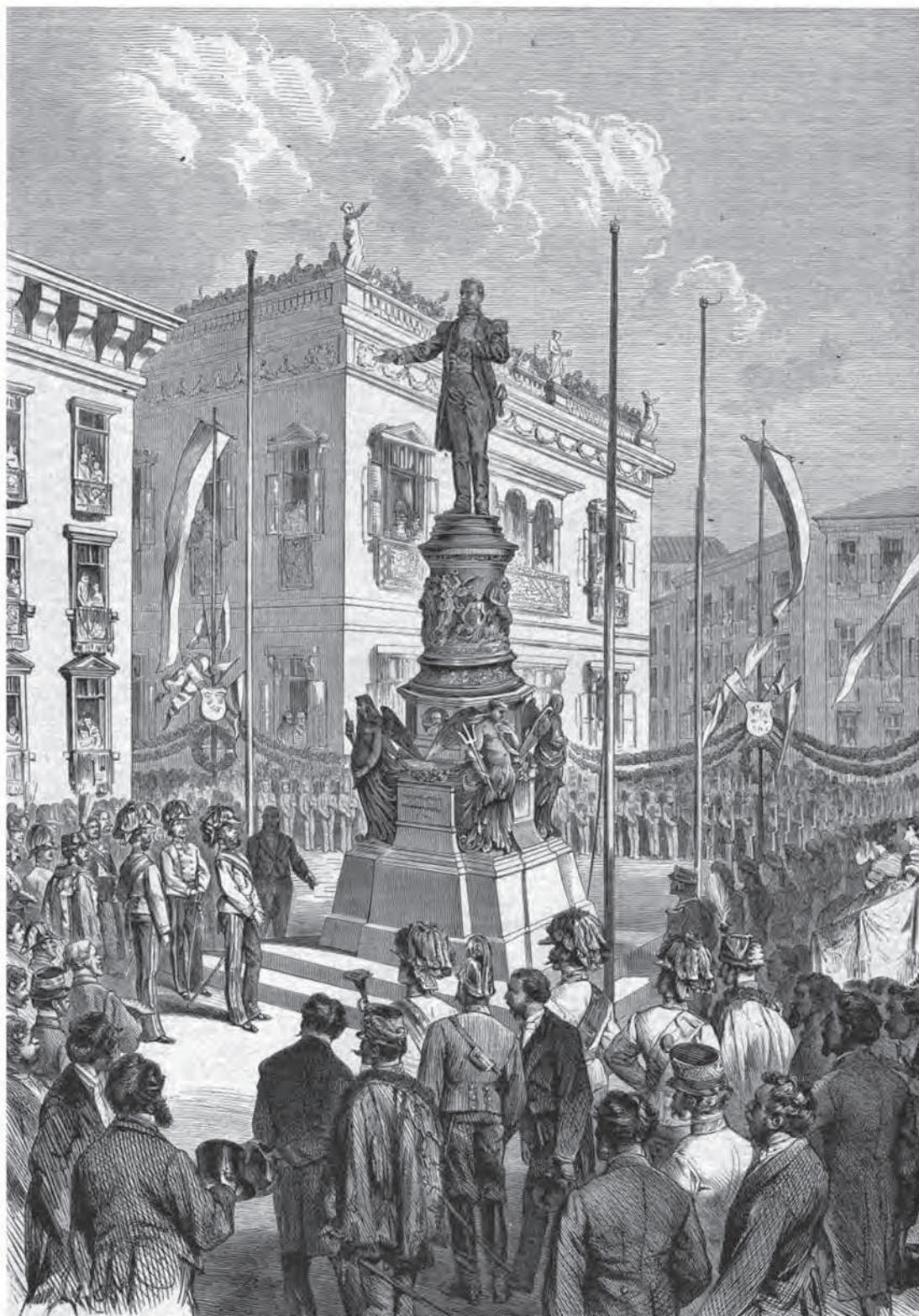
Pl. IV. Inaugurarea monumentului lui Maximilian în prezența împăratului Franz Josef în 3 aprilie 1875, după o schiță de L. Straß. / Inauguration of the monument of Maximilian in the presence of Emperor Franz Josef on April 3, 1875, after a sketch by L. Straß.