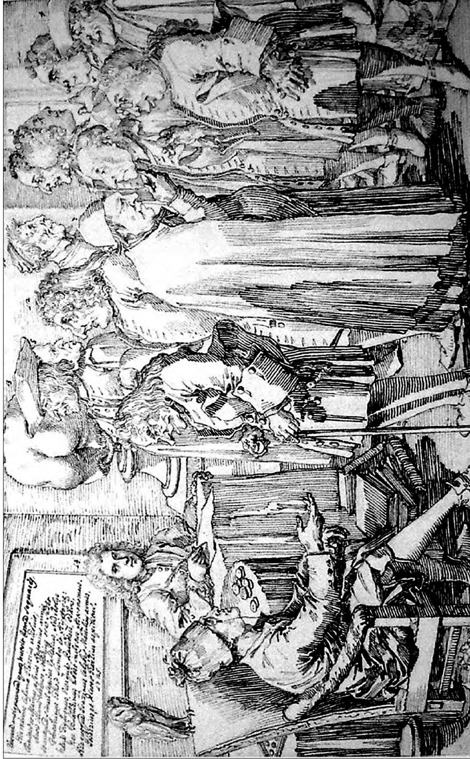
Pl. IV. Gravură de la întâlnirea anticarilor la vila cardinalului Alessandro Albani din Roma (1725), de Pier Leone Ghezzi, Congresso De' Migliori Antiquari di Roma . Silueta centrală (marcată cu nr. 12) a bătrânului lunatic și obosit este a contelui Marsigli (după Giometti 2014, fig. 1). / Engraving from the meeting of antiquaries at the villa of Cardinal Alessandro Albani in Rome (1725), by Pier Leone Ghezzi, Congresso De' Migliori Antiquari di Roma . The central silhouette (marked with no. 12) of the moody and tired old man is that of Count Marsigli (after Giometti 2014, fig.1).