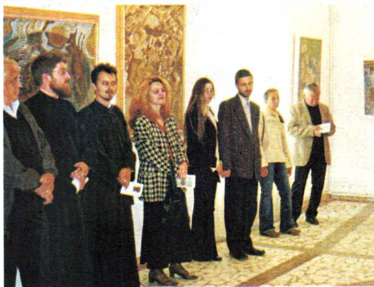
Muzeul Carpaților Răsăriteni Inaugurarea expoziției "Brăduț Covaliu"