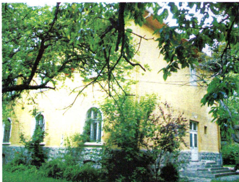
Muzeul Carpaților Răsăriteni Sediul clădirii, înainte de restaurare