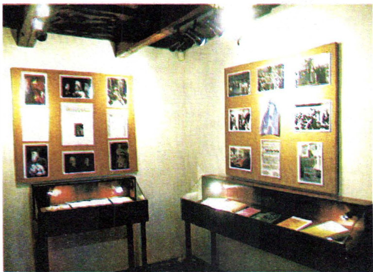
Casa memorială "R. Cioflec" Aspect din expoziție