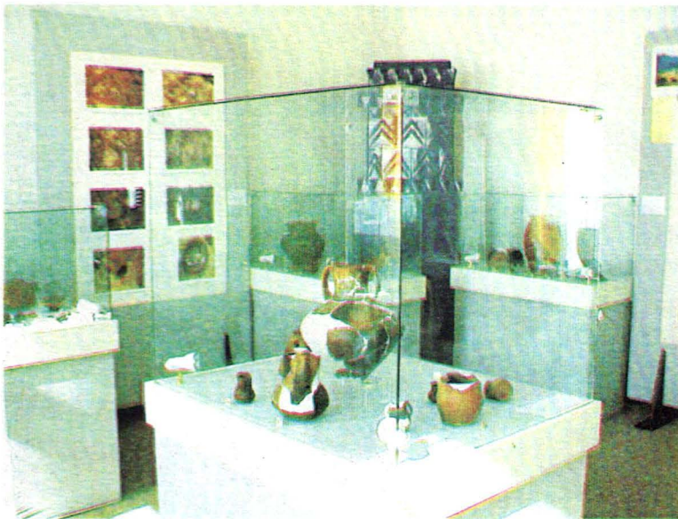
Muzeul Oltului și Mureșului Superior. Expoziție de arheologie