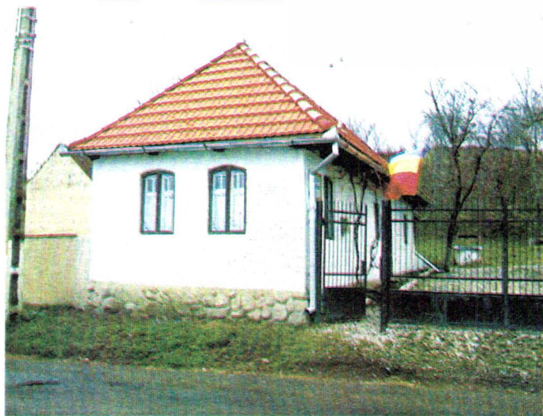
Casa memorială "R. Cioflec" Clădirea, renovată