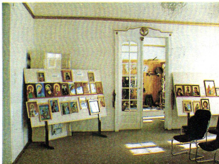
Muzeul Oltului și Mureșului Superior. Expoziție de icoane