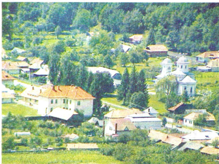
Punctul etnografic "Poiana Sărată" Sediul. Clădirea cu etaj.