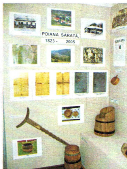
Punctul etnografic "Poiana Sărata" Aspect din expoziție.