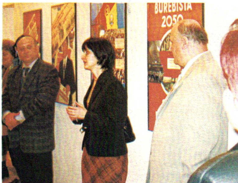
Muzeul Carpaților Răsăriteni Inaugurarea expoziției "Fascism și comunism"