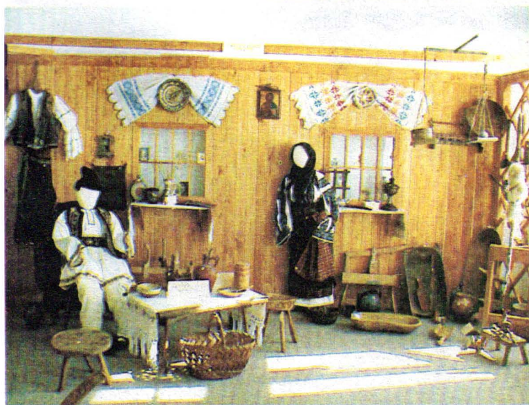
Muzeul Oltului și Mureșului Superior. Expoziția de etnografie