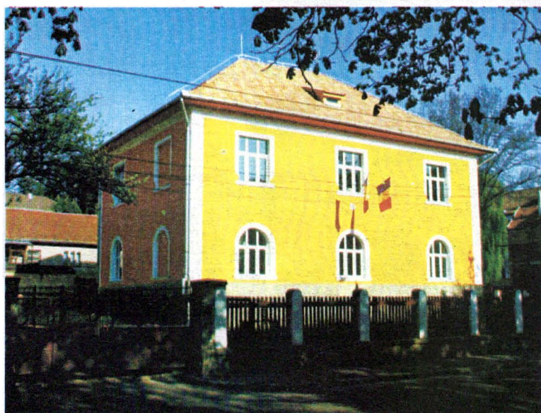
Muzeul Carpaților Răsăriteni Sediul clădirii, după restaurare