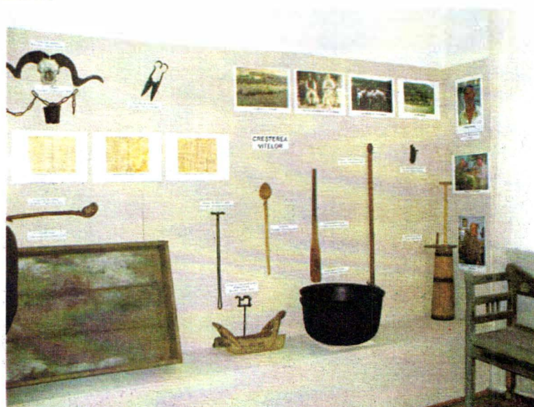
Punctul etnografic "Poiana Sărata" Aspect din expoziție.