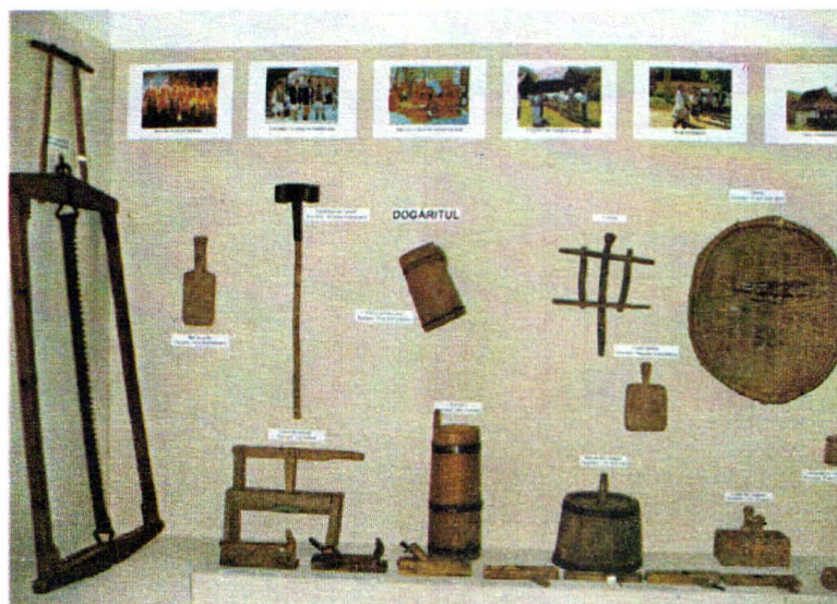
Punctul etnografic "Poiana Sărata" Aspect din expoziție.