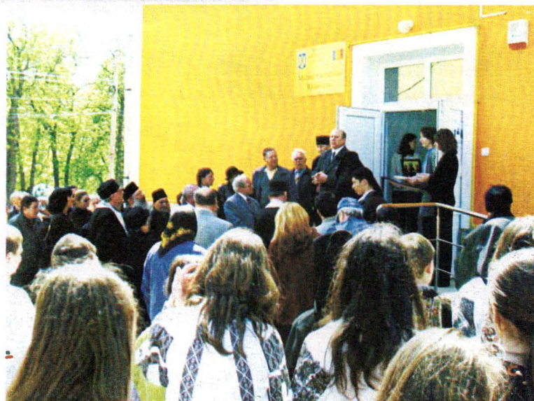
Muzeul Carpaților Răsăriteni Inaugurarea sediului muzeului. Participă P.S. Ioan Selejan