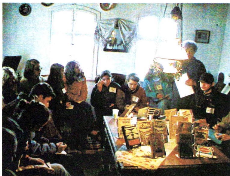
Casa memorială "R. Cioflec" Activități desfășurate cu elevi