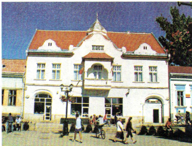
Muzeul Oltului și Mureșului Superior. Clădirea sediului.