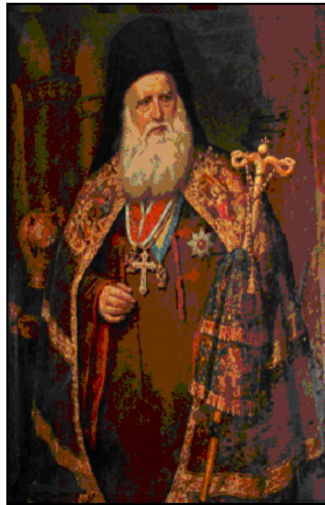
Andrei Șaguna (1808-1873) Portret de Mișu Popp Colecția muzeului „Prima Școală Românească” din Șcheii Brașovului