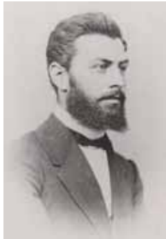
Gheorghe Dima (1847-1925)