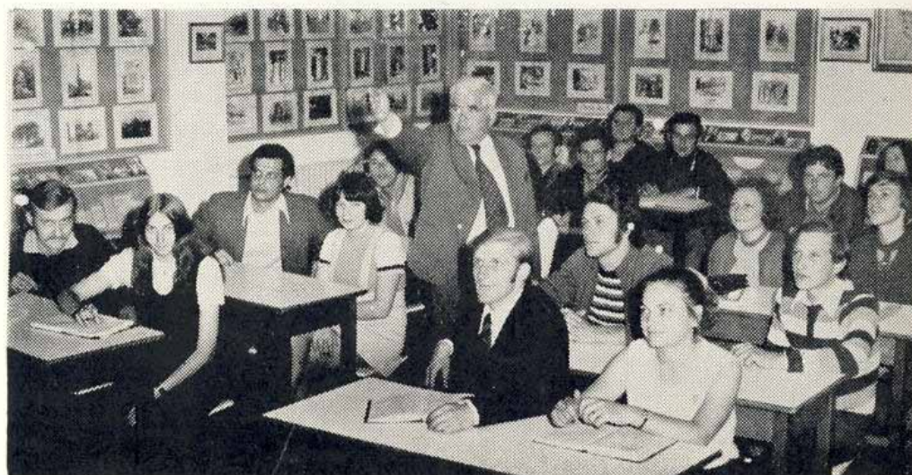
Lecție de recapitulare finală anuală la literatură română cu anul III (curs seral) în sala de cursuri a micromuzeului – cabinet de literatură română, (3 iunie 1973).