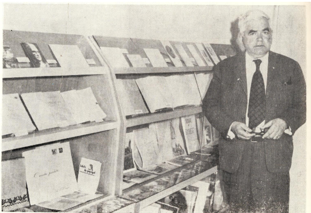
Alt aspect din camera de păstrare și manipulare a materialelor.