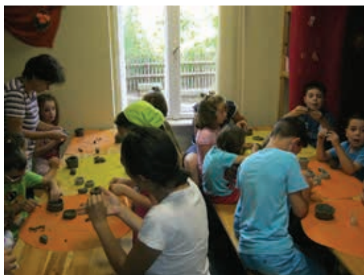
Meșterește cu noi vara