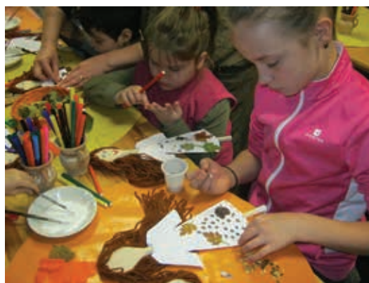
Ateliere de toamnă