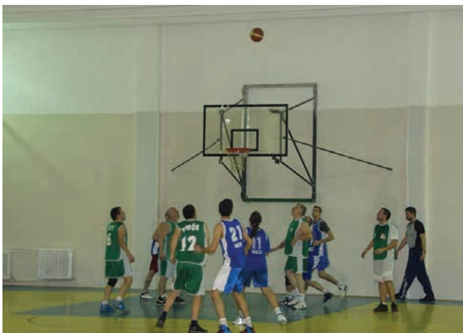
Activități sportive ale echipei M.N.C.R.