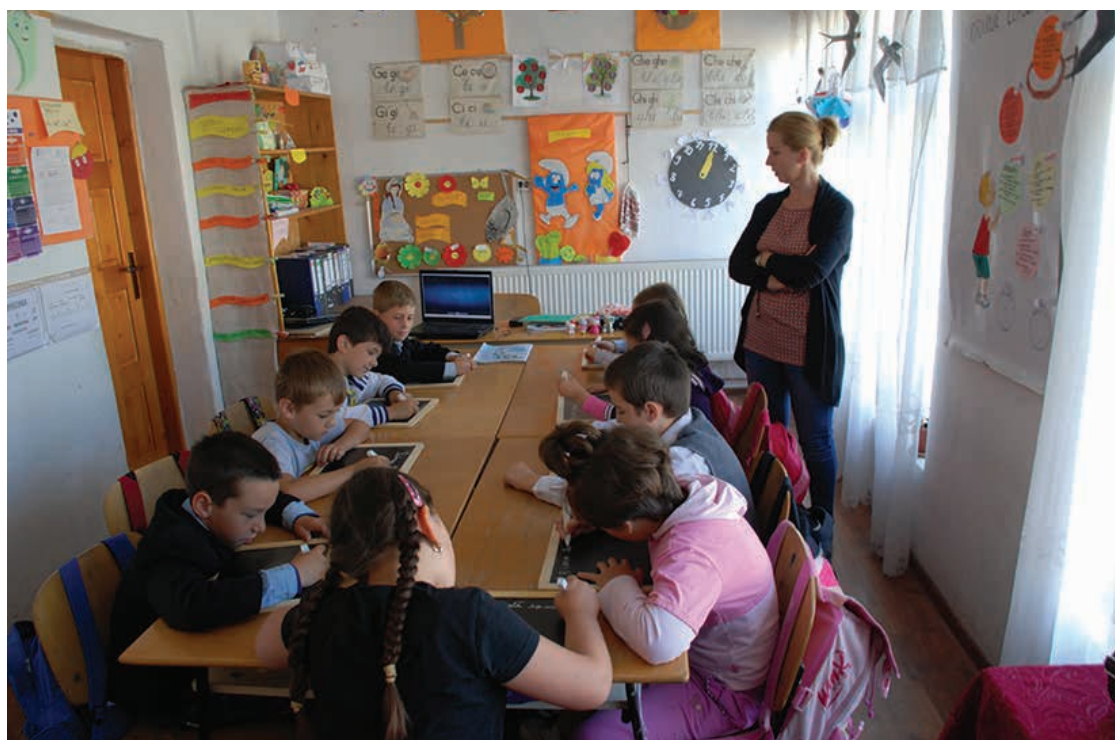
Ateliere de scriere pe tăblițe