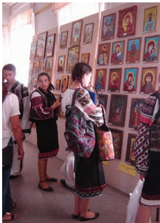
Etapă județeană a Olimpiadei de „Meșteșuguri artistice tradiționale”