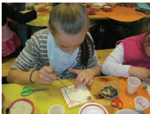
Ateliere creative de toamnă