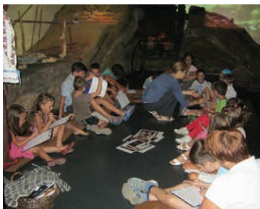
Meșterește cu noi vara