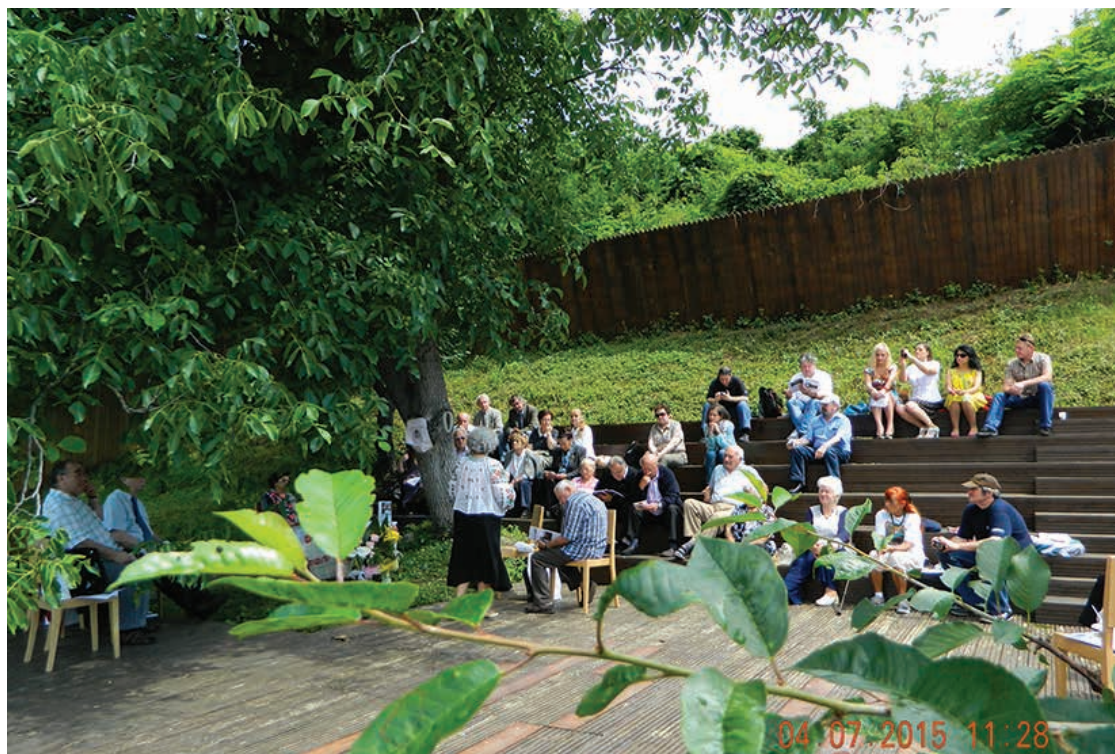
Eveniment "La umbra nucului bătrân", Araci