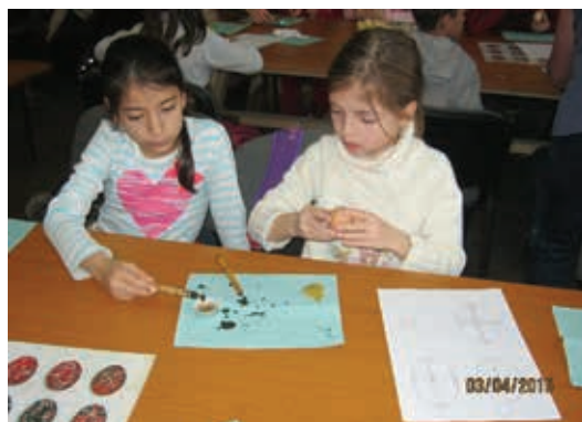
Atelier de încondeiat ouă