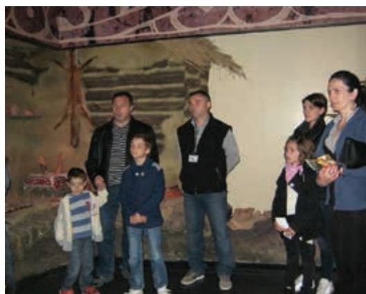
Noaptea Muzeelor la M.N.C.R.