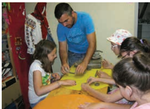
Atelier de modelare manuală a lutului