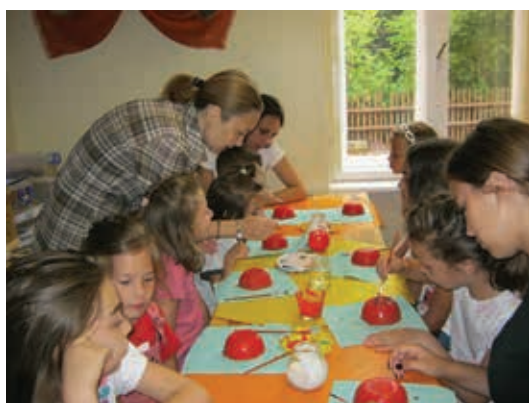
Meșterește cu noi vara