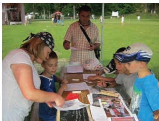
Festivalul "Ceva de vară", ateliere creative