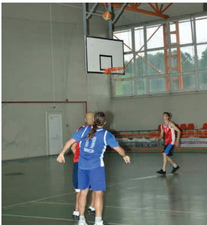
Cupa Buzaielor la Baschet, 2015