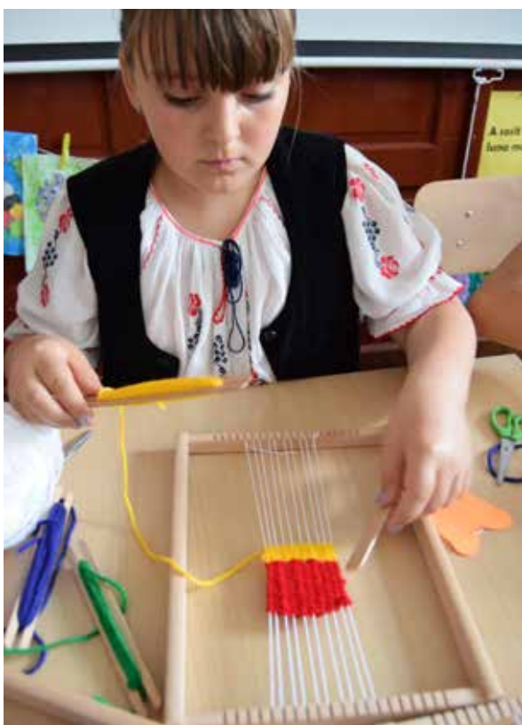
Atelier de țesut