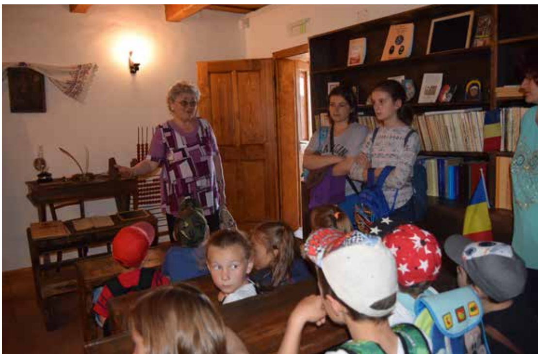
Școala Altfel la Prima Școală Românească