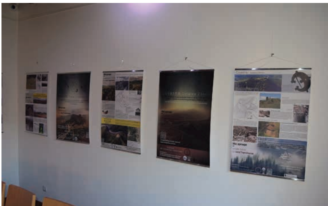
Expozitia ZBOR 2016, Casa Romulus Cioflec