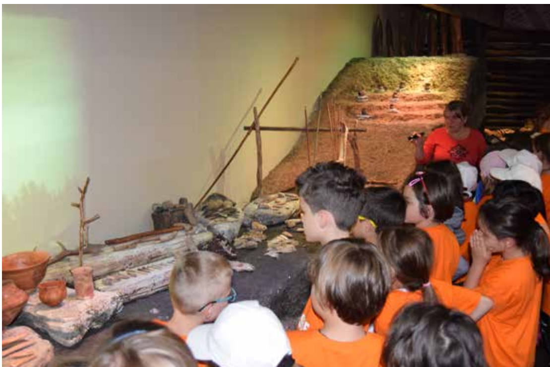
Vizitatori la sediul central M.N.C.R.