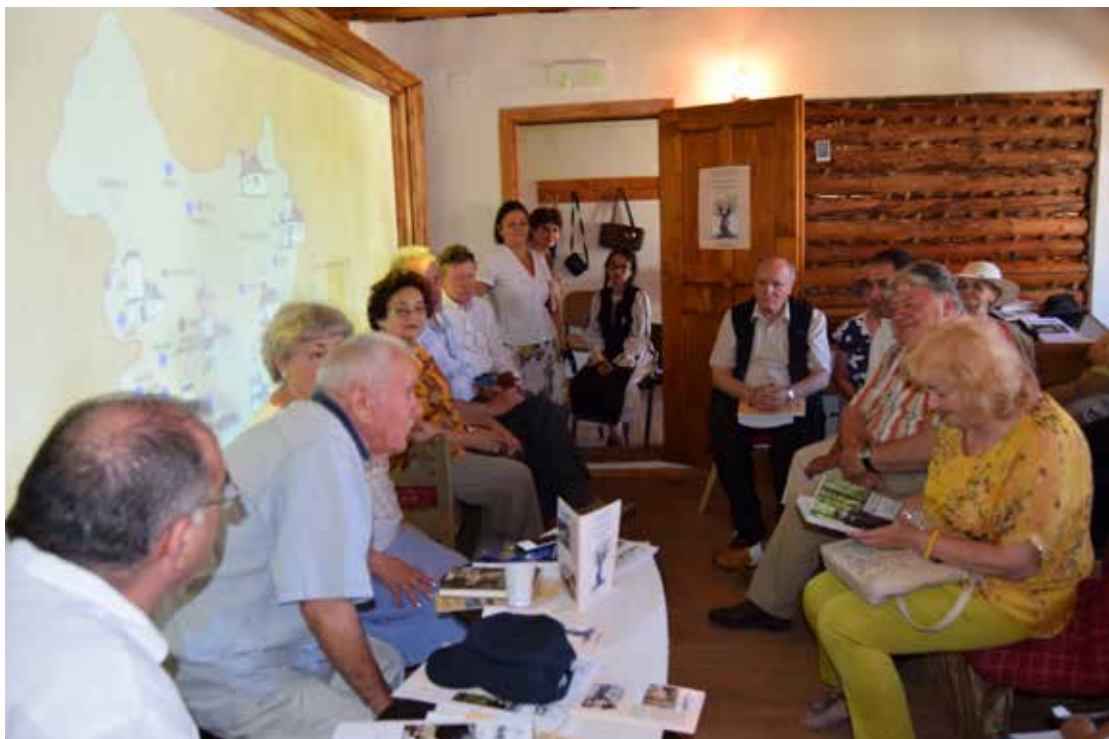
Evenimentul cultural-literar "La umbra nucului bătrân"