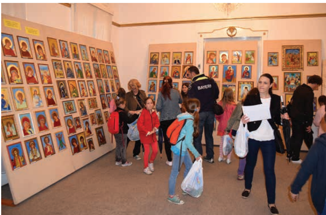
Olimpiada de meșteșuguri artistice tradiționale, ediția XXI, MOMS, 2016