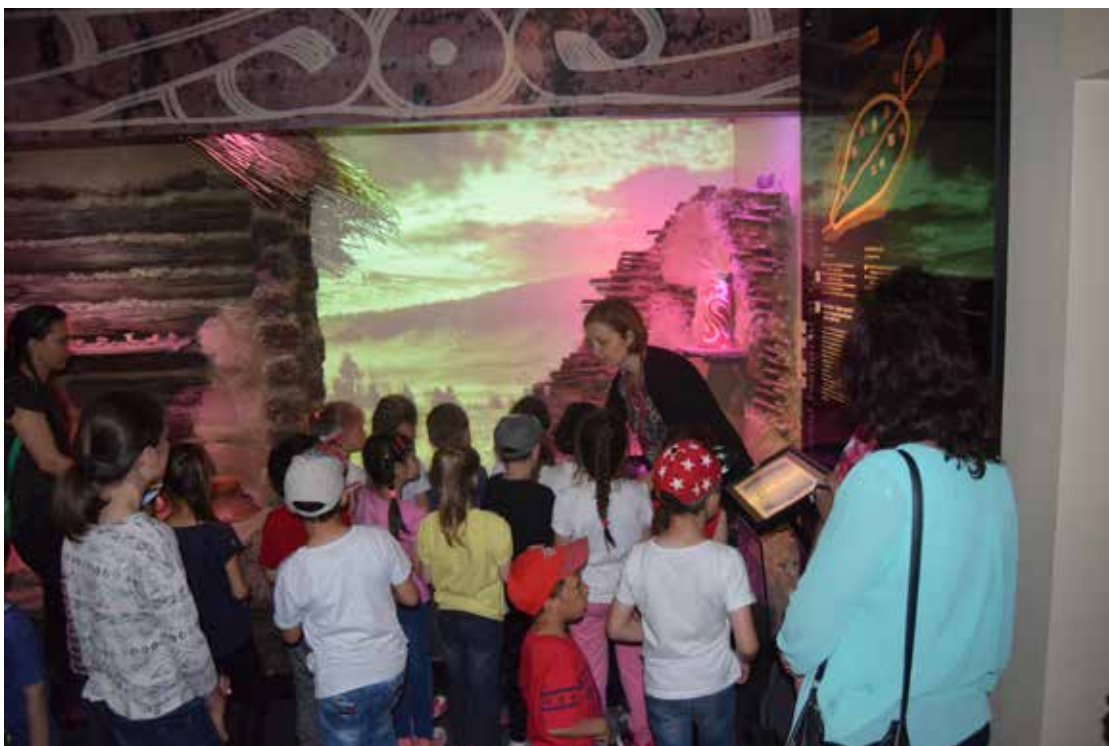
Școala Altfel la sediul central M.N.C.R.