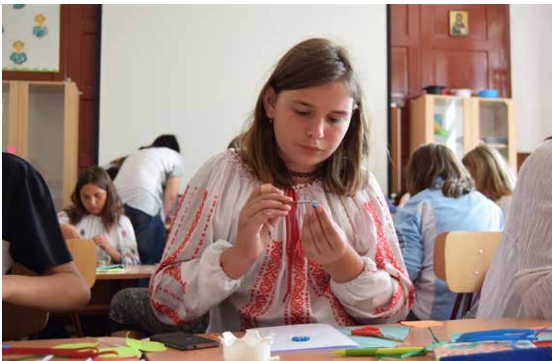
Atelier de quilling