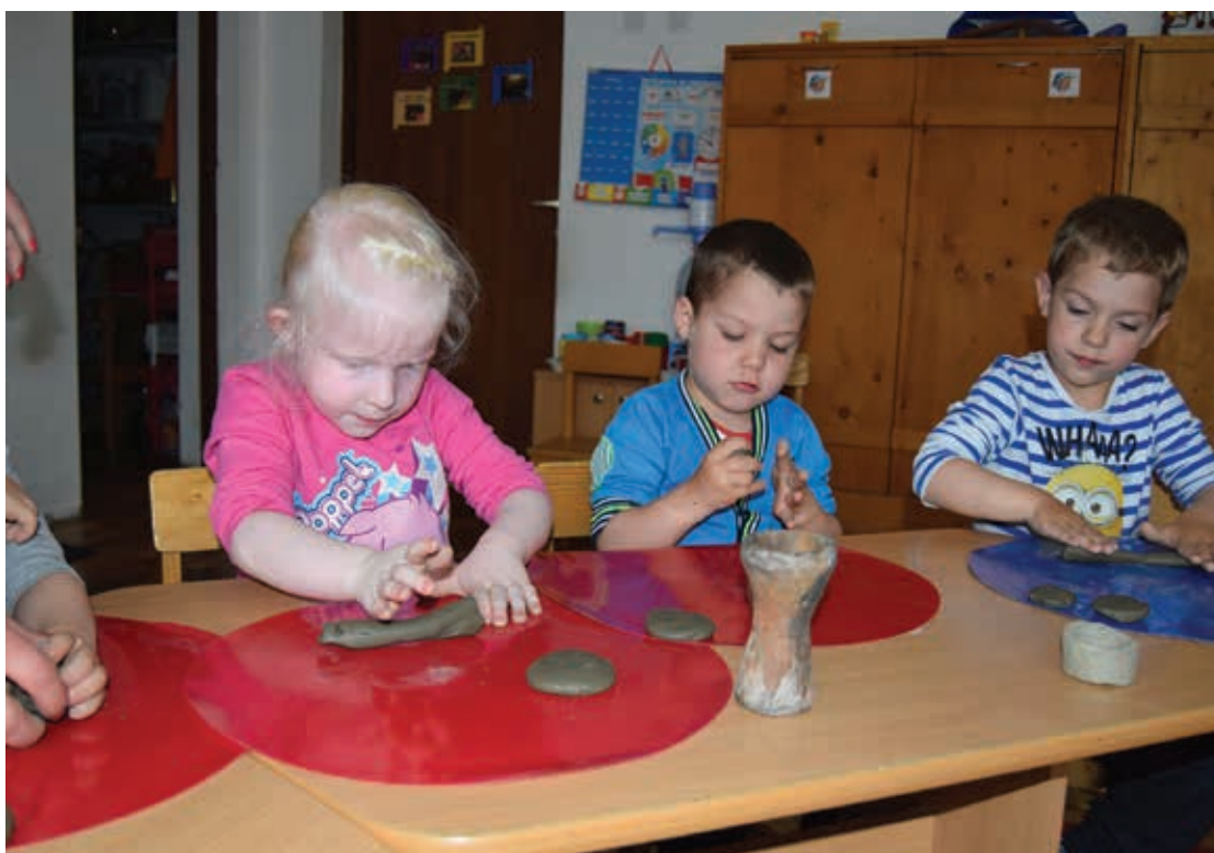
Ateliere de modelare manuală a lutului, 2016