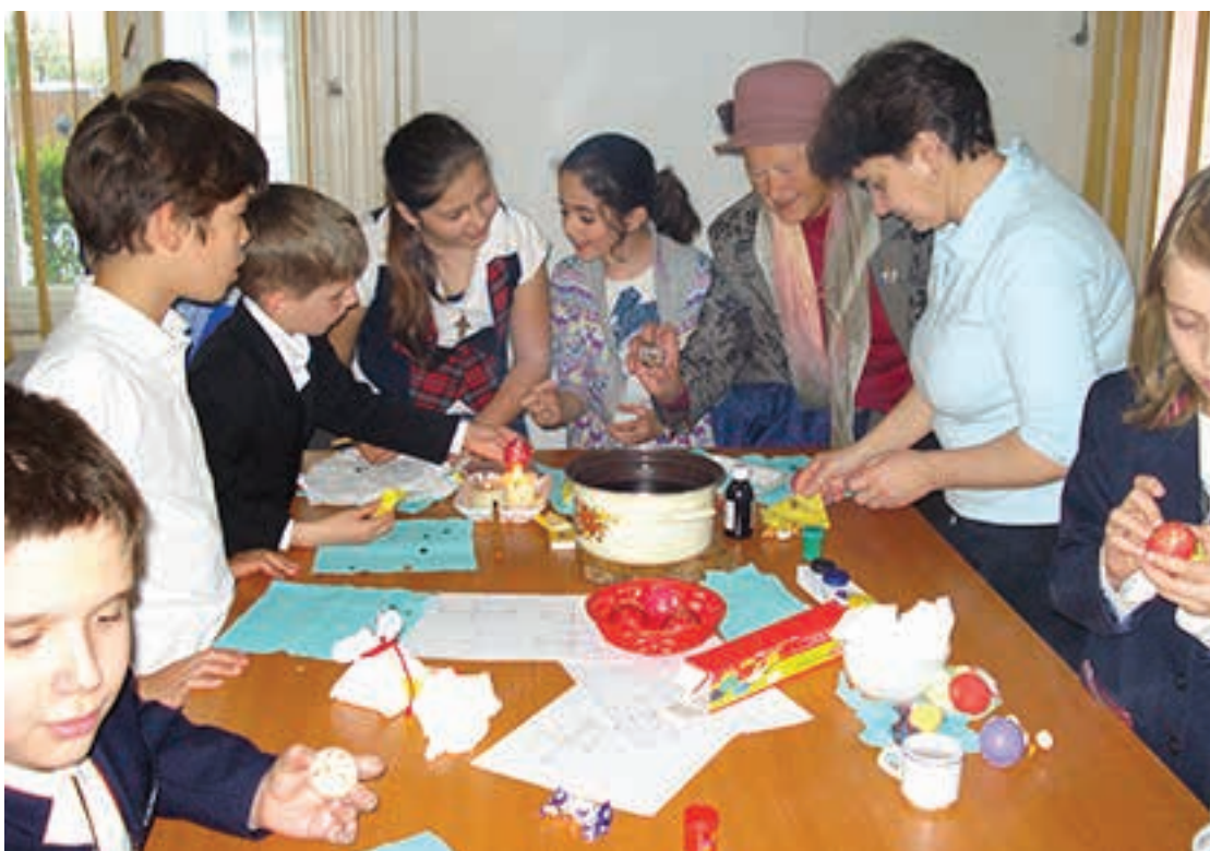
Atelier de încondeiat ouă, 2016