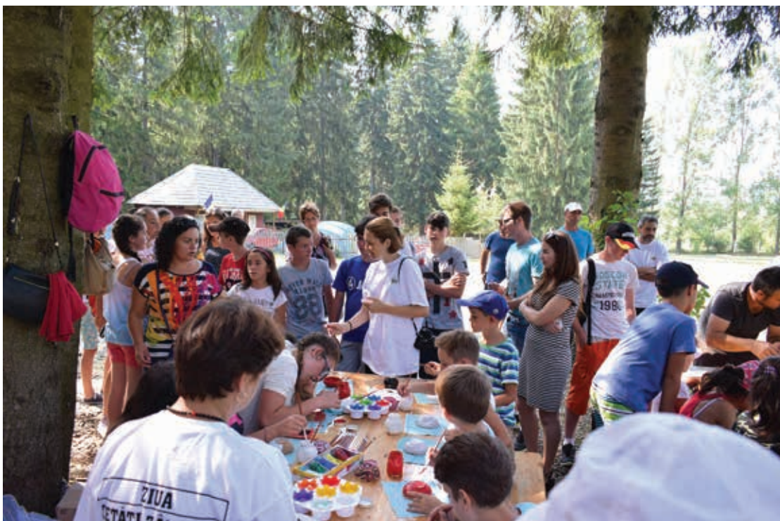
Ziua Cetății Zânelor ediția 1, 2016