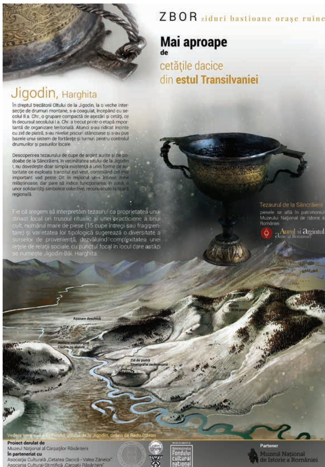
Poster Expoziția ZBOR 2016, Sâncrăieni-Jigodin