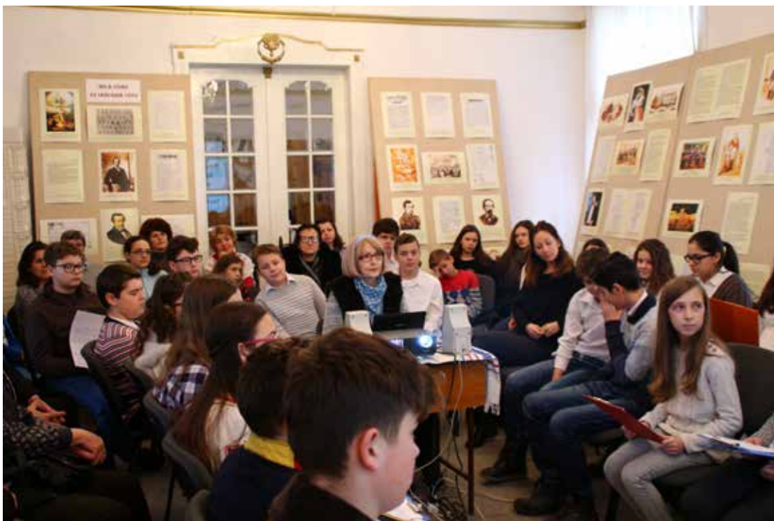
Mica Unire la Muzeul Oltului și Mureșului Superior