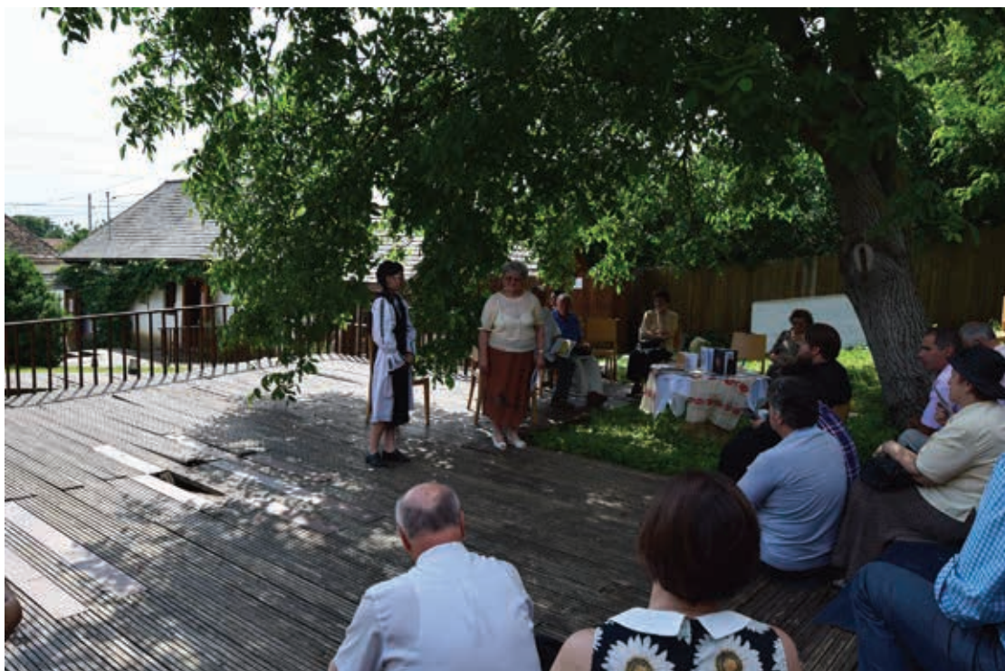
Evenimentul cultural-literar "La umbra nucului batrân"