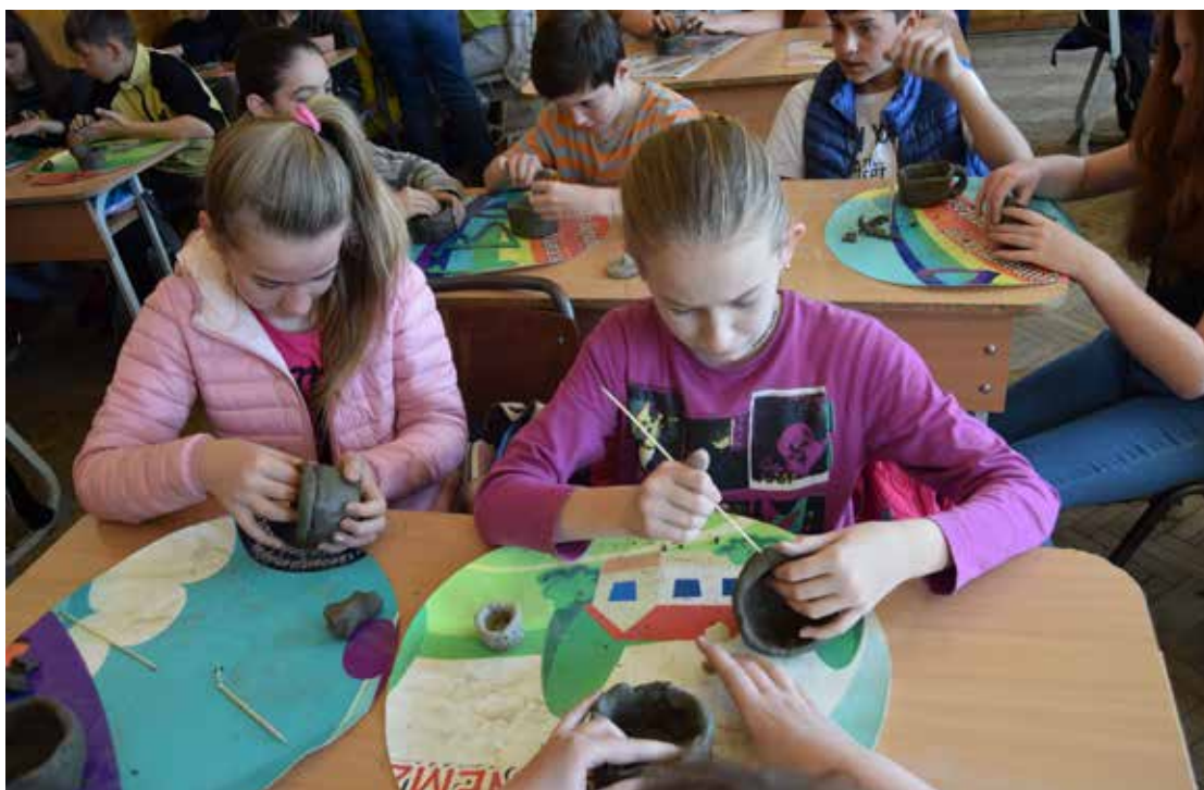
Ateliere de modelare manuală a lutului, 2016