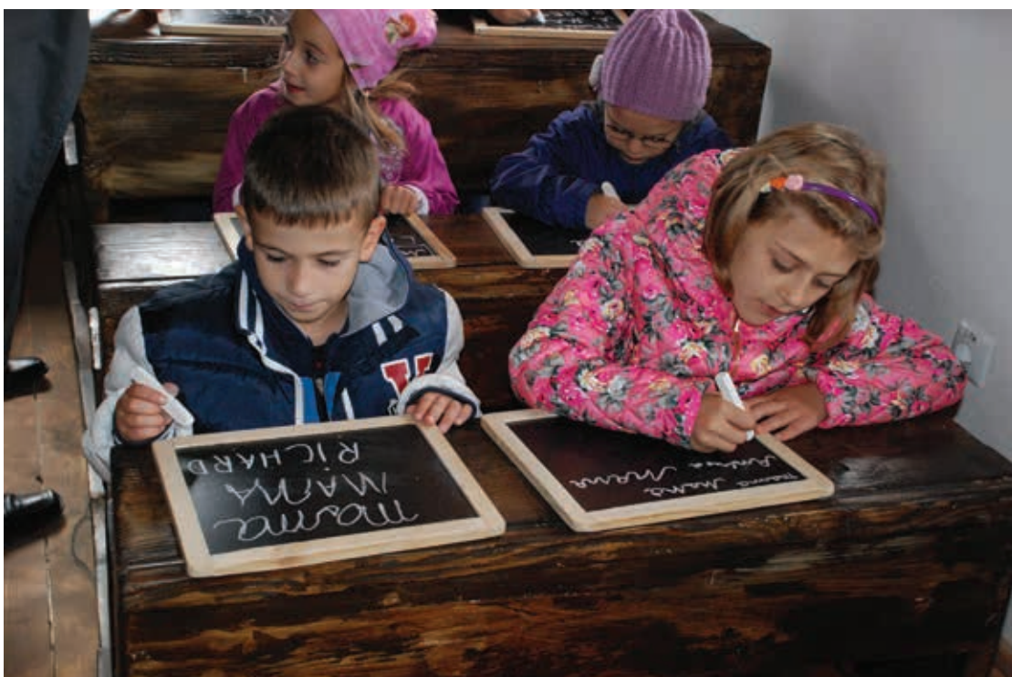
Atelier de scriere pe tăblițe la Prima Școală Românească, 2015