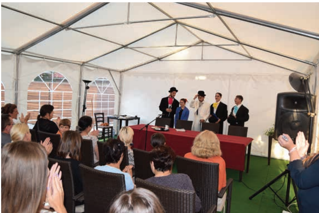
Evenimentul cultural-literar "Ziua Limbii Române", 2016