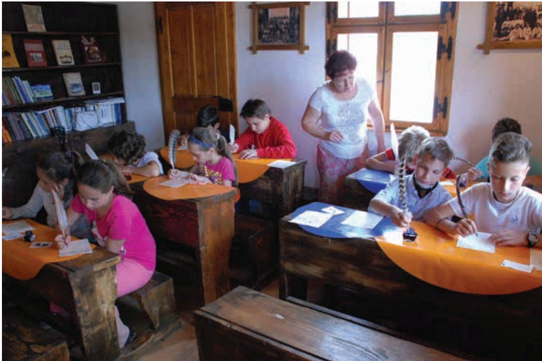
Atelier de scriere cu pana la Prima Școală Românească, 2015