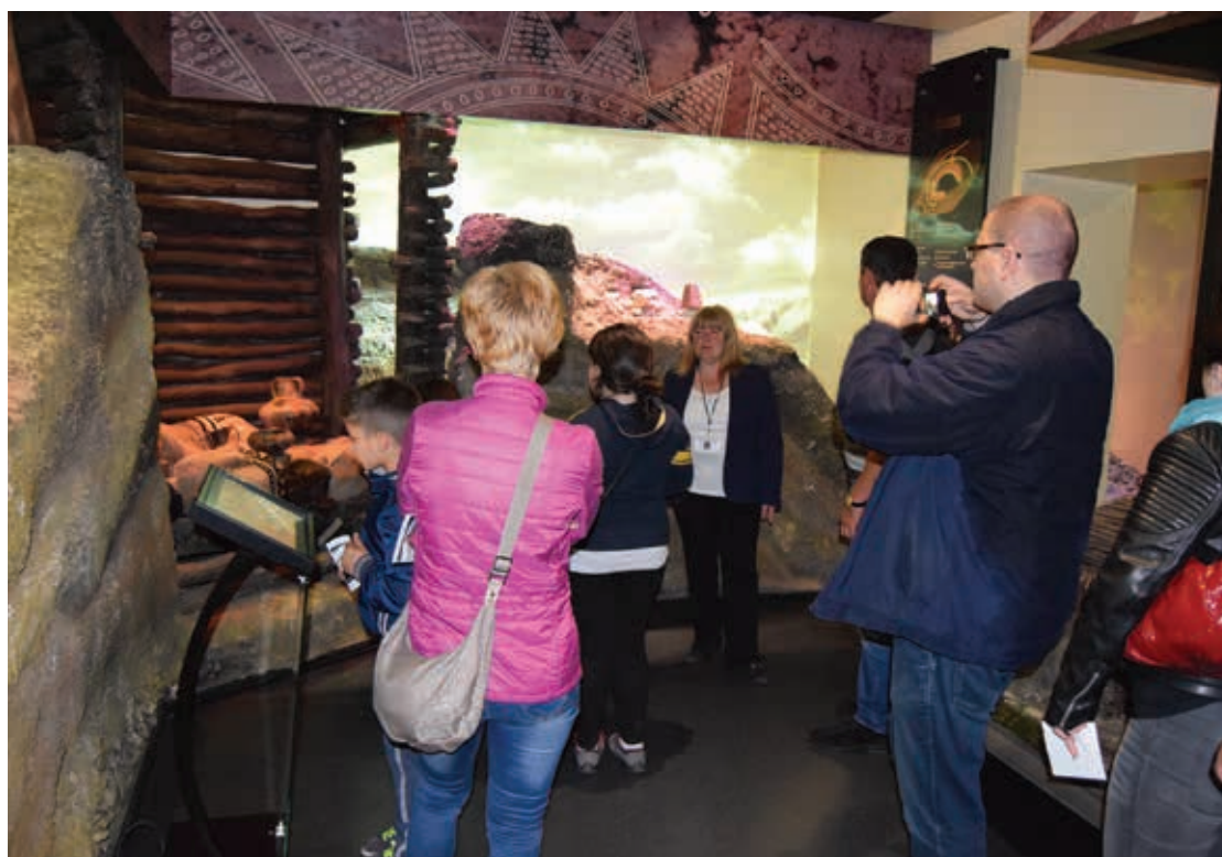
Evenimentul Noaptea Muzeelor