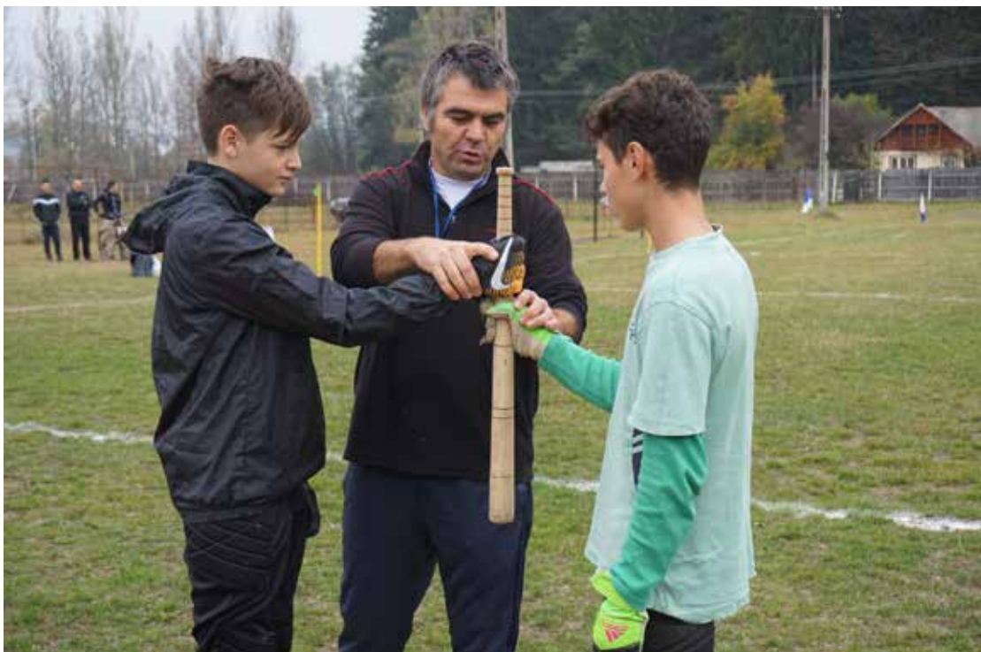
Cupa Buzaielor la Oină, ediția a VI-a