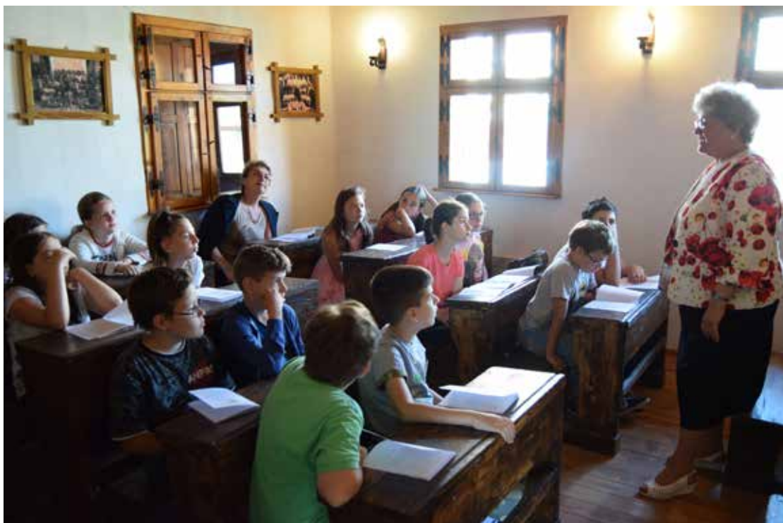
Ultimul clopoțel la Prima Școală Românească