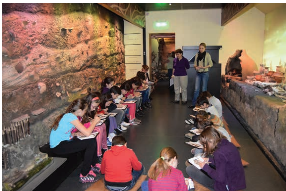
Școala Altfel, 2016