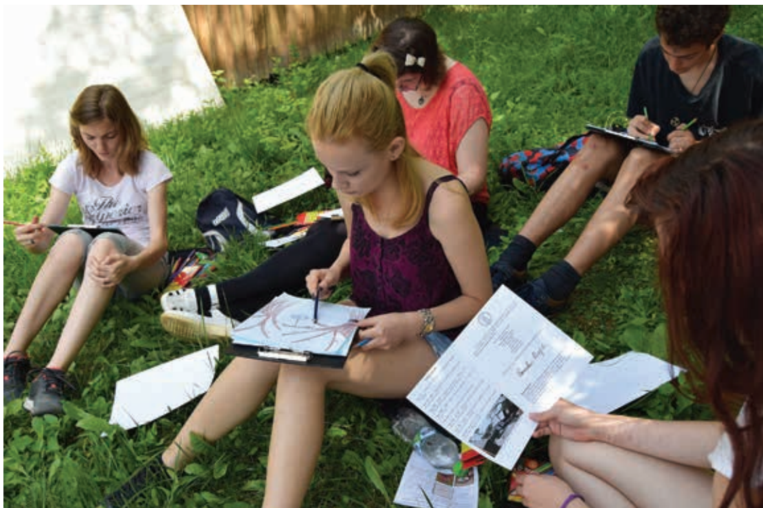
Proiectul "Ilustrăm o povestire de Romulus Cioflec", 2016