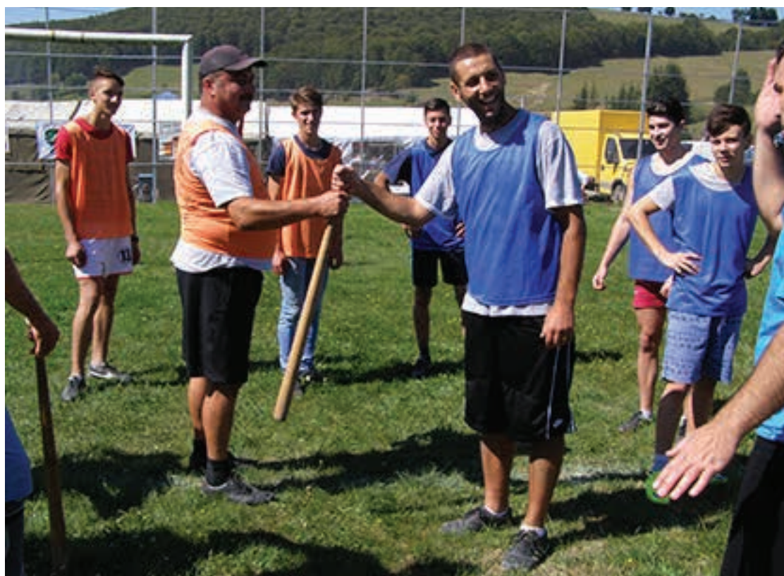
Început de joc – Oina