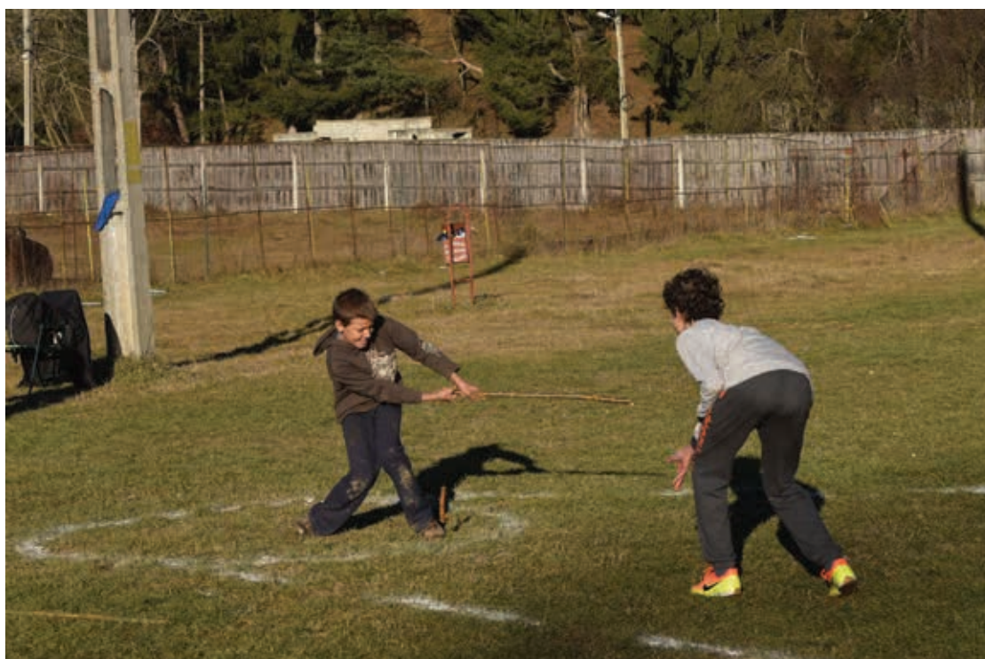
Proiectul Turca voluntariat pentru patrimoniu, 2016