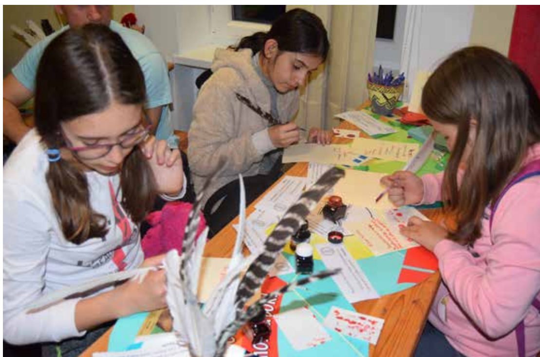
Noaptea Muzeelor la Muzeul Oltului și Mureșului Superior