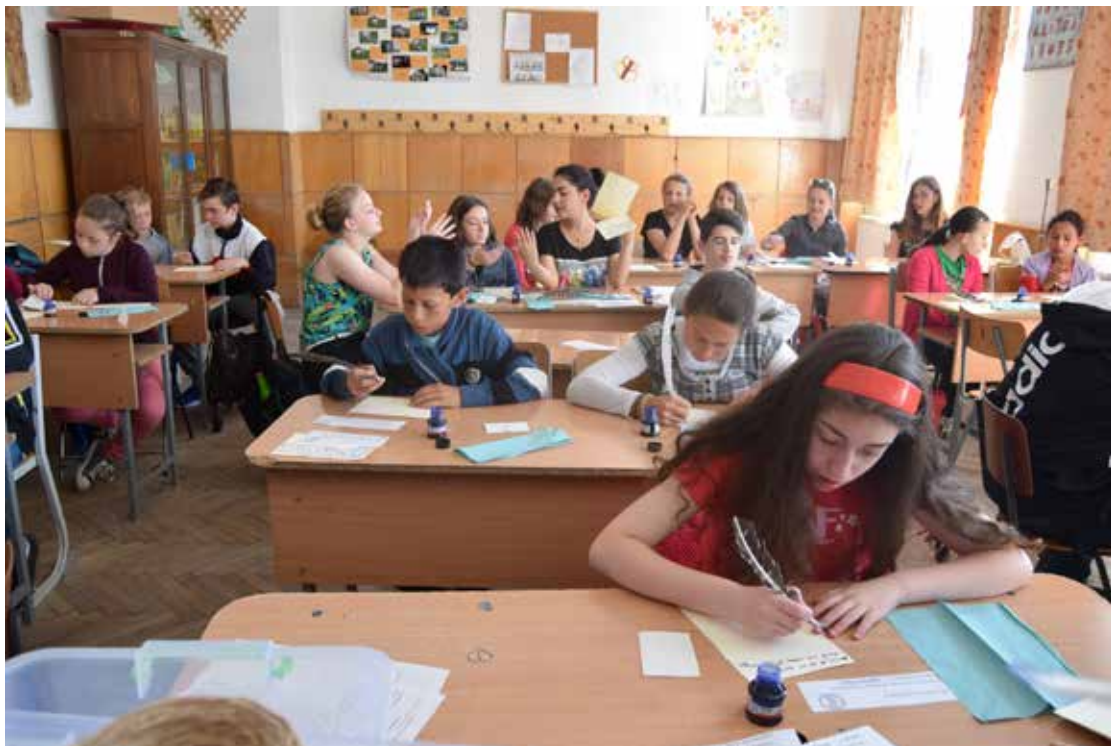
Atelier de scriere cu pana