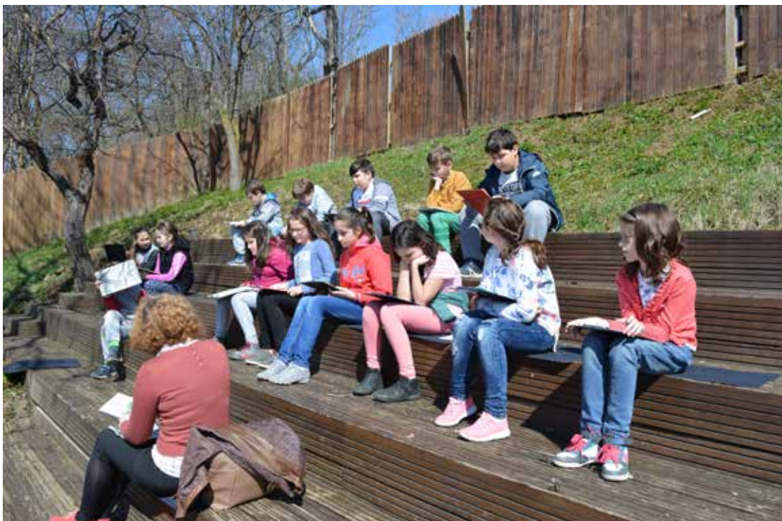
Proiect de pedagogie muzeală „Scriitorul ROMULUS CIOFLEC la aniversare”