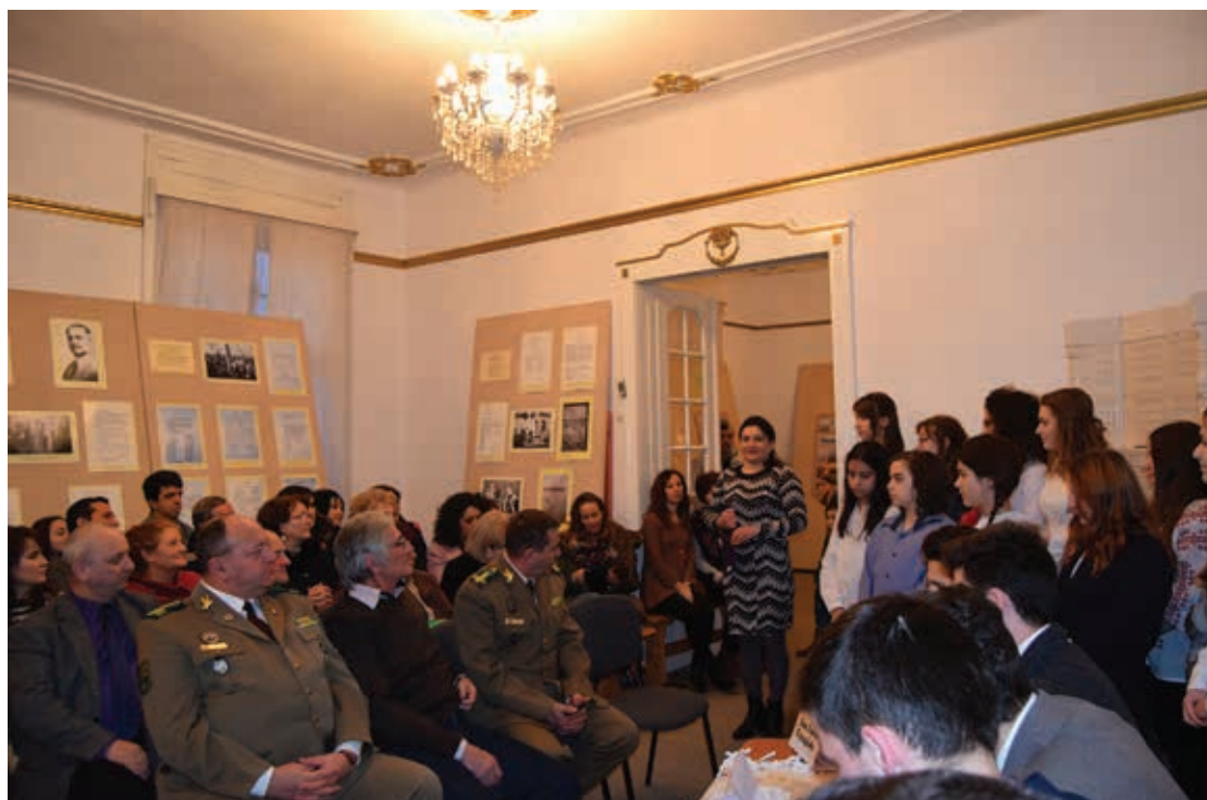
Proiectul "Ziua Culturii Române", MOMS, 2016