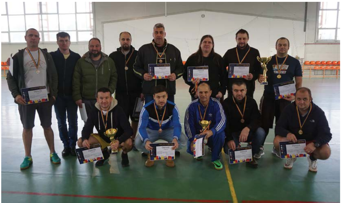
Fig. 10 Cupa Unirii la fotbal-tenis (eveniment dedicat zilei de 24 ianuarie 1859).