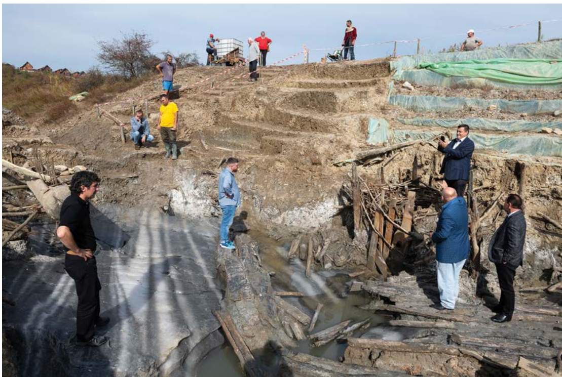
Fig. 27 Vizită la situl Baile Figa, jud. Bistrița-Năsăud.