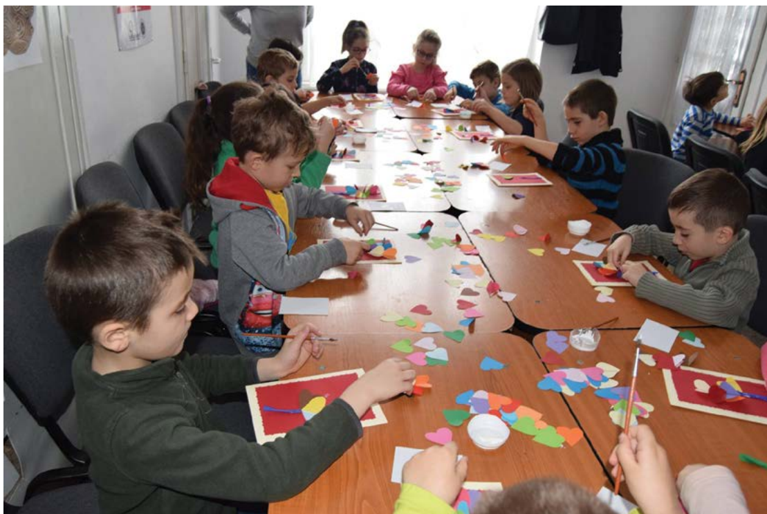
Fig. 3 Atelier de confecționare a mărtișoarelor.