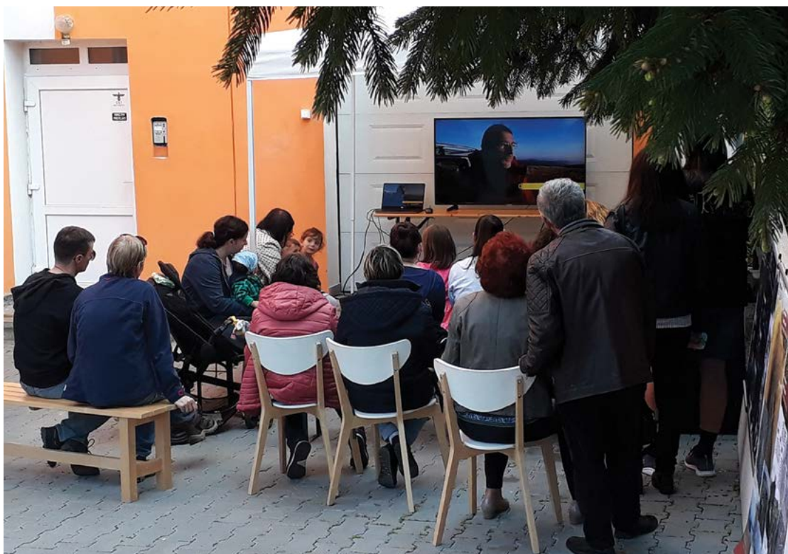
Fig. 16 Noaptea Muzeelor la sediul MNCR din Sf. Gheorghe.