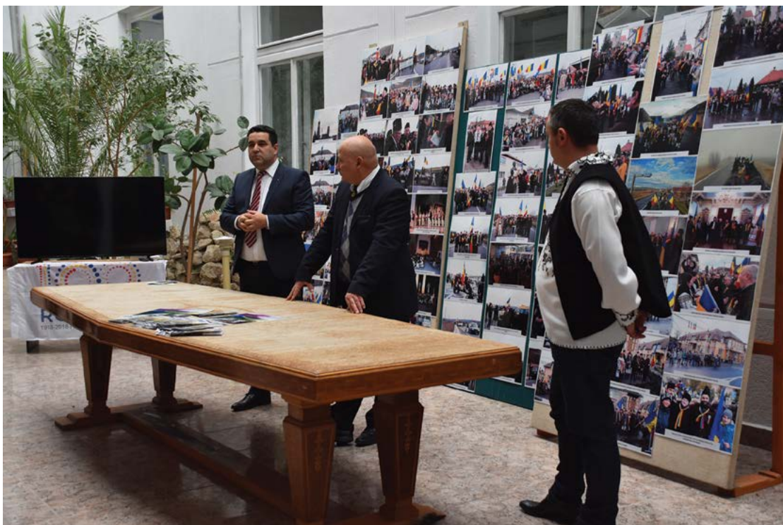
Fig. 1 Activități dedicate zilei de 1 Decembrie 1918 la Instituția Prefectului – Județul Covasna.