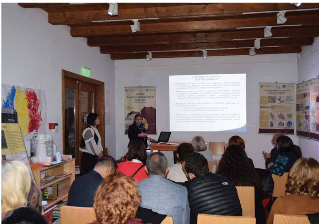
Fig. 8 Cerc pedagogic la Casa memorială Romulus Cioflec.