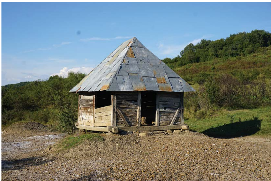
Fig. 23 Situri salifere din Transilvania, fântâna de apă sărată din Caila, Bistrița Năsăud.