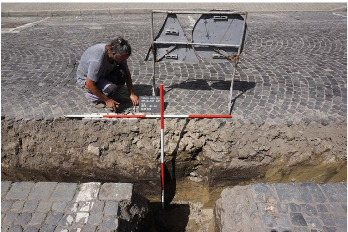
Fig. 20 Supraveghere arheologică în municipiul Târgu Secuiesc, jud. Covasna.