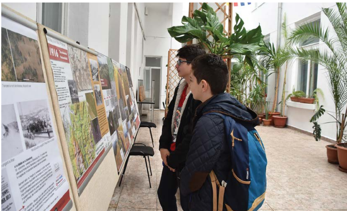
Fig. 2 Activități dedicate zilei de 1 Decembrie 1918 la Instituția Prefectului – Județul Covasna. Itinerarea expoziției foto-documentare "Marile bătălii ale Primului Război Mondial din trecătorile Carpaților de Curbură - Teledetectie și arheologie aeriană".