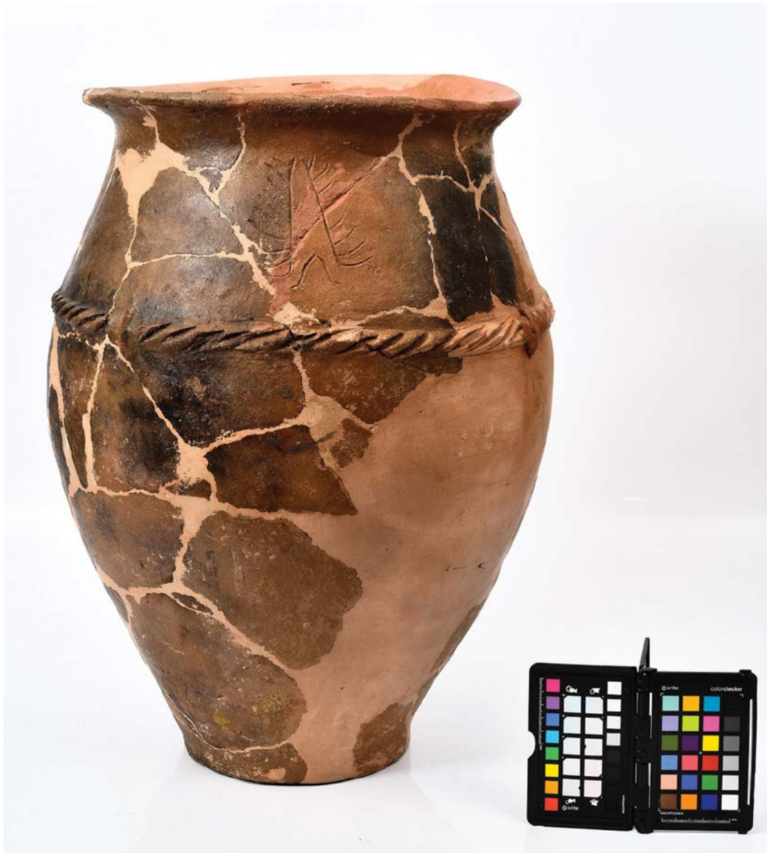
Fig. 19 Clasarea patrimoniului; fotografierea bunurilor culturale MNCR 6991.