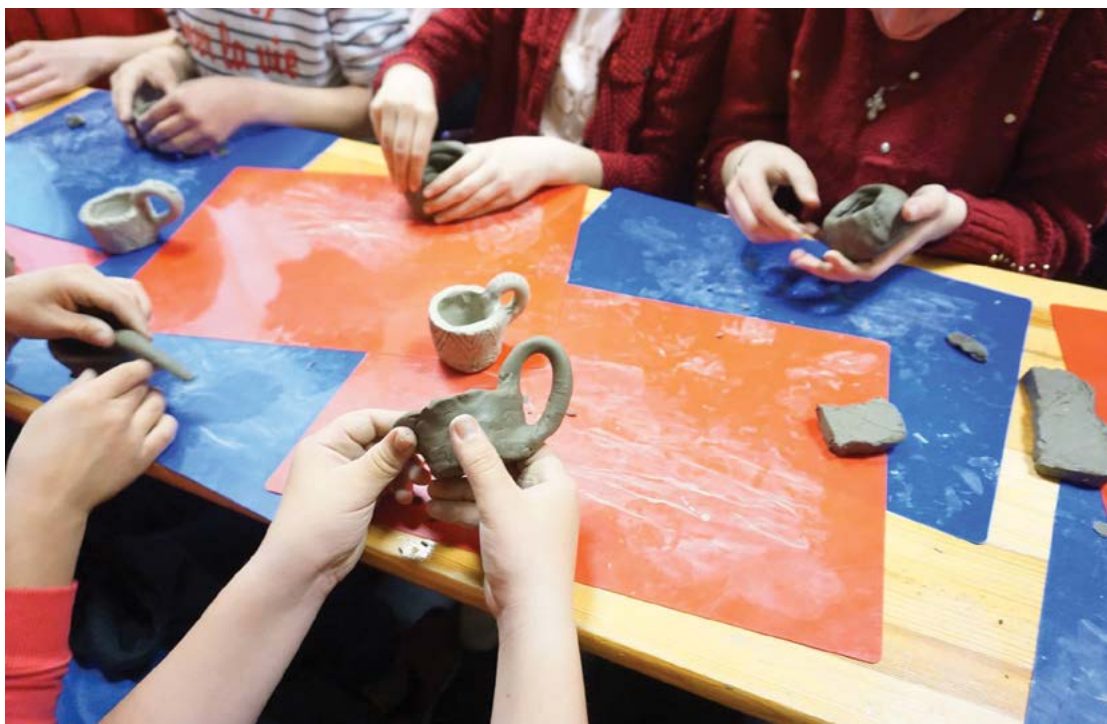
Fig. 7 Atelier de modelaj de lut.