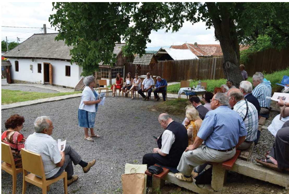
Fig. 11 Eveniment literar "La umbra nucului bătrân", Araci, jud. Covasna.