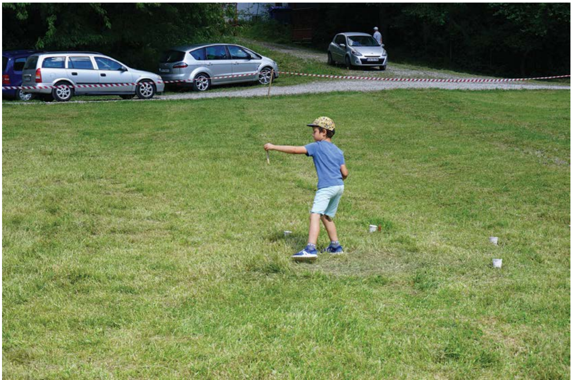
Fig. 17 Cupa Cetății la țurcă, ed. a II-a, Covasna, jud. Covasna.