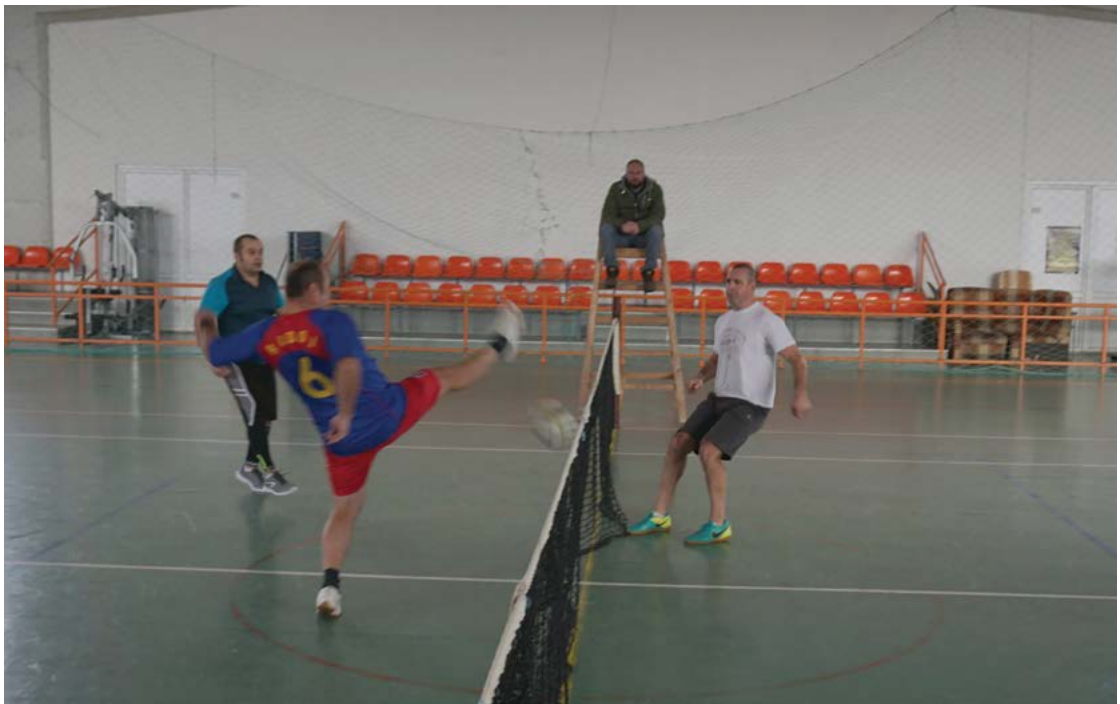
Fig. 9 Finala Cupei Unirii la fotbal-tenis pe echipe (eveniment dedicat zilei de 24 ianuarie 1859).