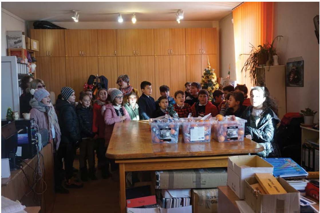
Fig. 29 Colindători la sediul MNCR din Sf. Gheorghe.