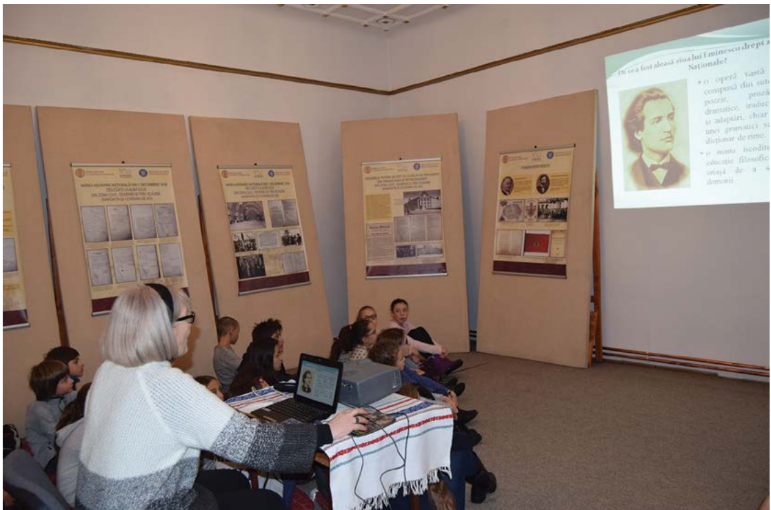
Fig. 14 Ziua Culturii Naționale la MOMS.