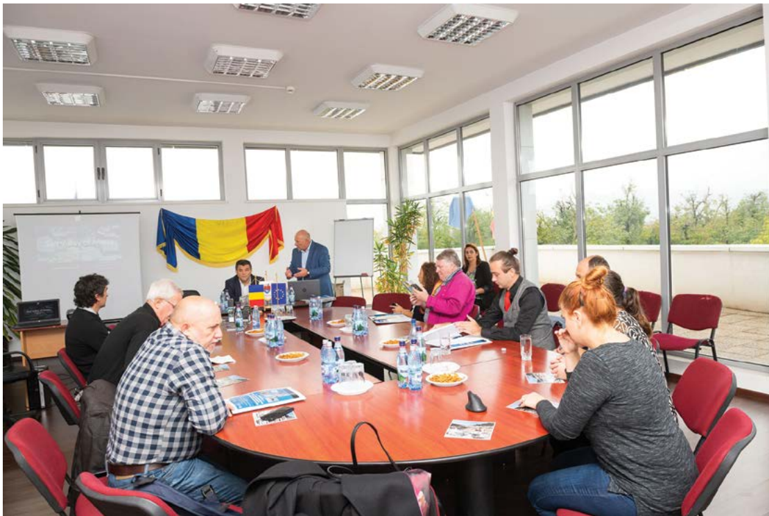
Fig. 26 Sesiunea Științifică Anuală a MNCR, Beclean, jud. Bistrița-Năsăud.