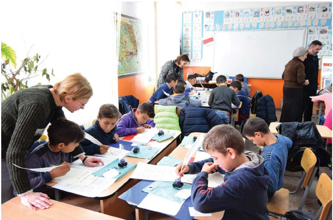
Fig. 5 Ateliere creative la Araci.