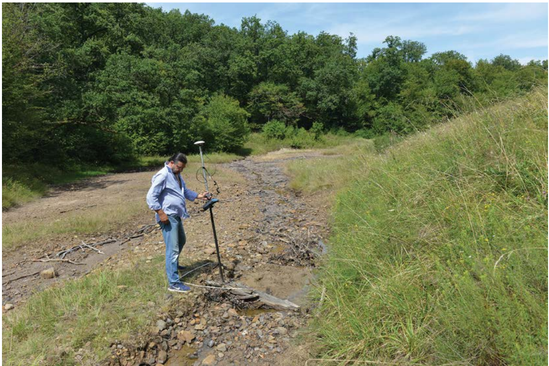
Fig. 28 Documentarea arheologică de teren a siturilor salifere din Transilvania.