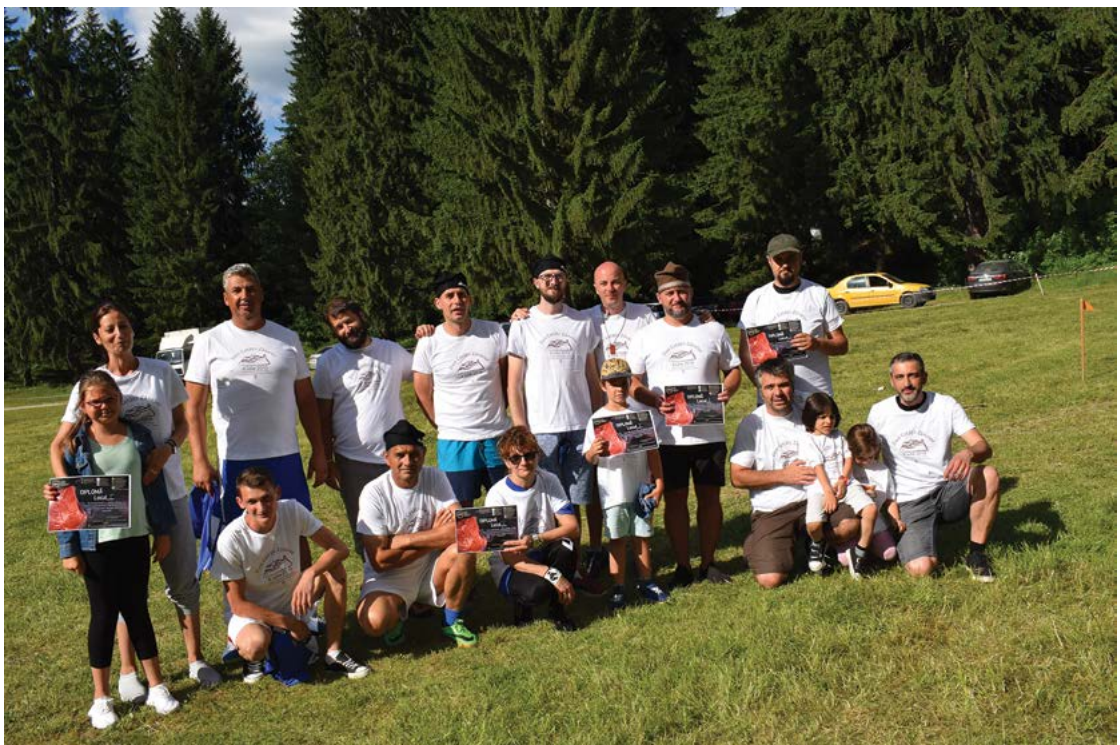
Fig. 18 Cupa Cetății la țurcă, Ed. a II-a, Covasna, jud. Covasna.