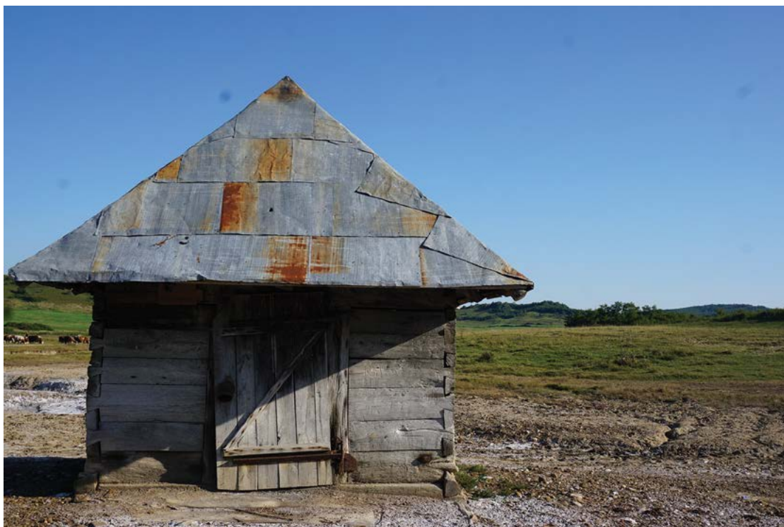
Fig. 22 Situri salifere din Transilvania, fântâna de apă sărată din Blăjanii de Jos, jud. Bistrița Năsăud.