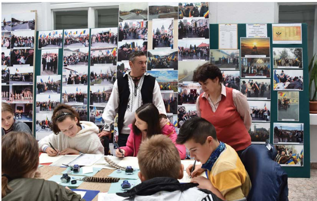
Fig. 4 Atelier de scriere cu pana.