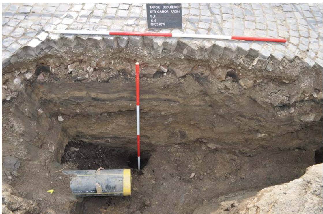
Fig. 21 Supraveghere arheologică în municipiul Târgu Secuiesc, jud. Covasna (detaliu).