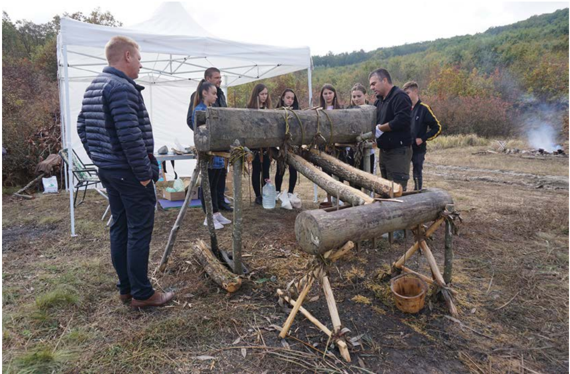
Fig. 24 Ziua Porților Deschise pe șantierul arheologic de la Băile Figa, jud. Bistrița Năsăud.