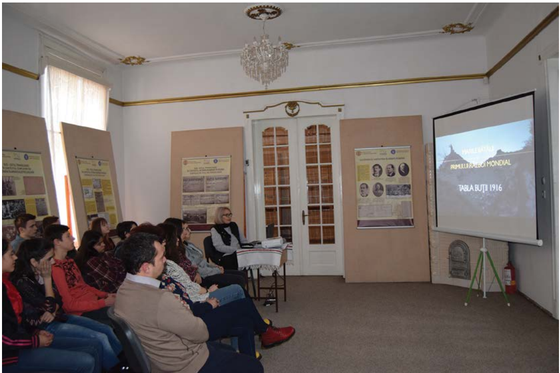
Fig. 13 Unirea Principatelor – 24 ianuarie 2019 la sediul la MOMS.