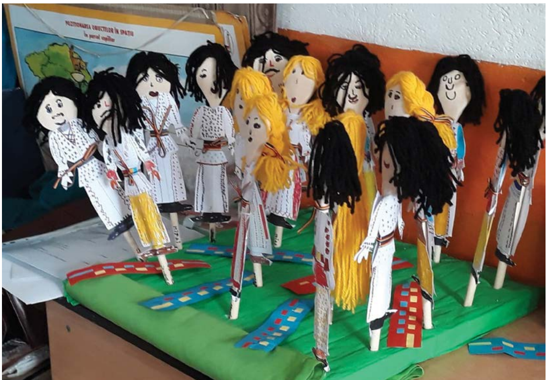
Fig. 6 Atelier de confecționat păpuși din linguri de lemn.