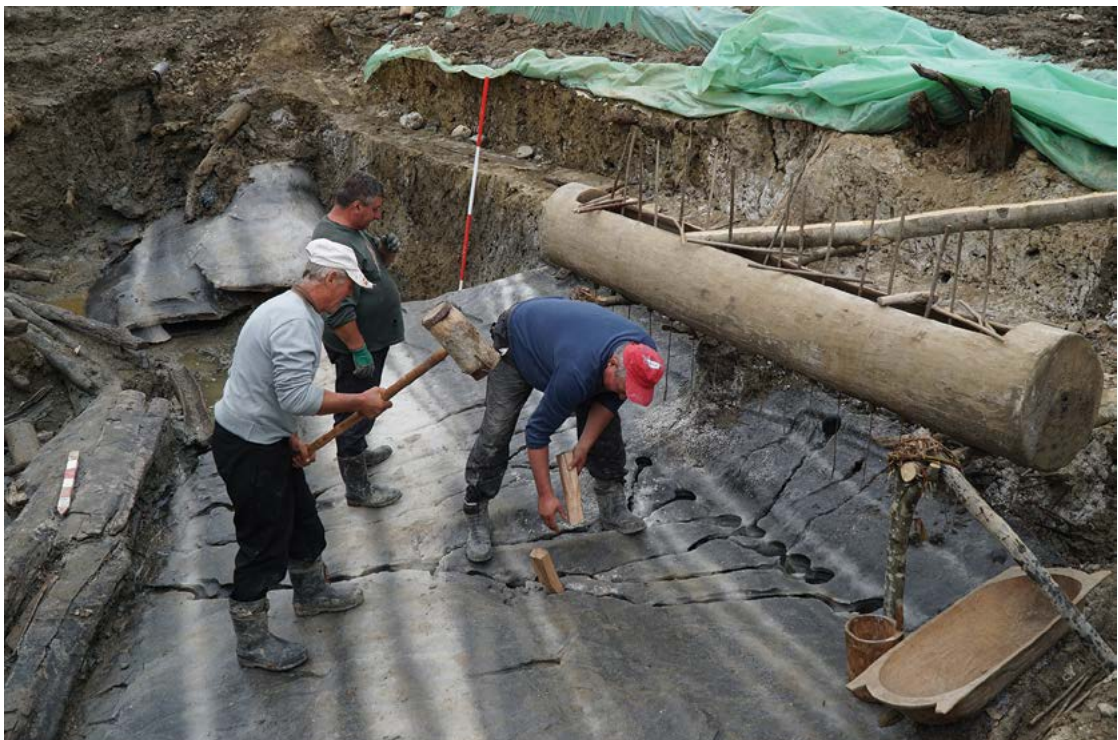
Fig. 25 Experimente arheologice la Băile Figa, jud. Bistrița-Năsăud.