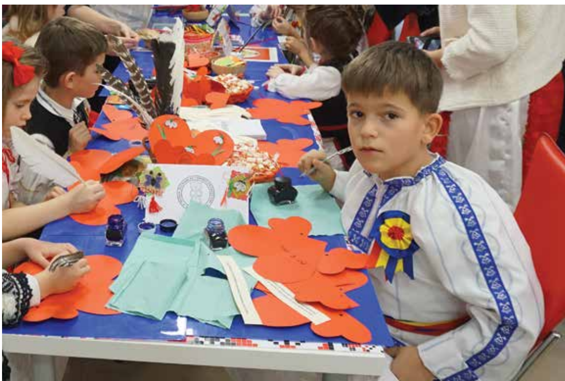
PI. 24 Tradiție și modernitate - Șezătoare călătore, ateliere creative. PI. 24 Tradition and modernity, creative workshops.