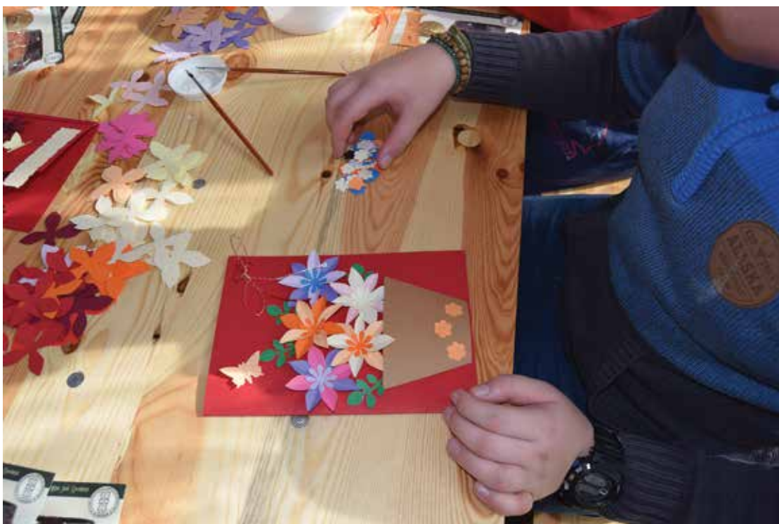
PI. 3 Atelier de confecționat felicitări la MOMS. PI. 3 Postcards workshop at MOMS.