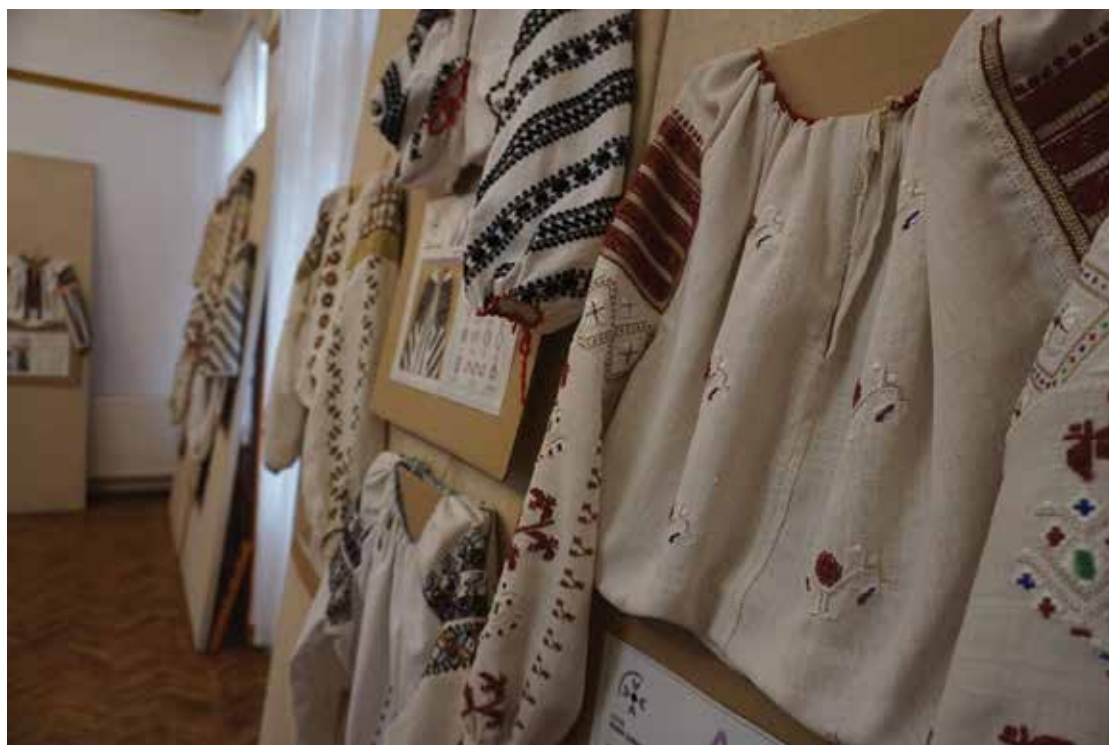
Pl. 26 Vernisajul expoziției AIDOMA la MOMS, 15 ianuarie 2020. Pl. 26 Opening of the AIDOMA exhibition at MOMS, January 15, 2020.