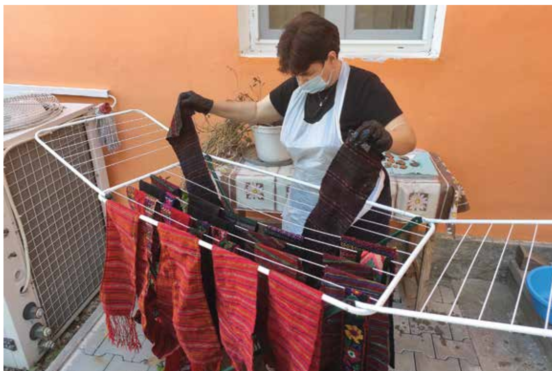
PI. 1 Activitatea de conservare preventivă a materialelor textile din patrimoniu MNCR. PI. 1 The activity of preventive conservation of textile materials from the MNCR patrimony.