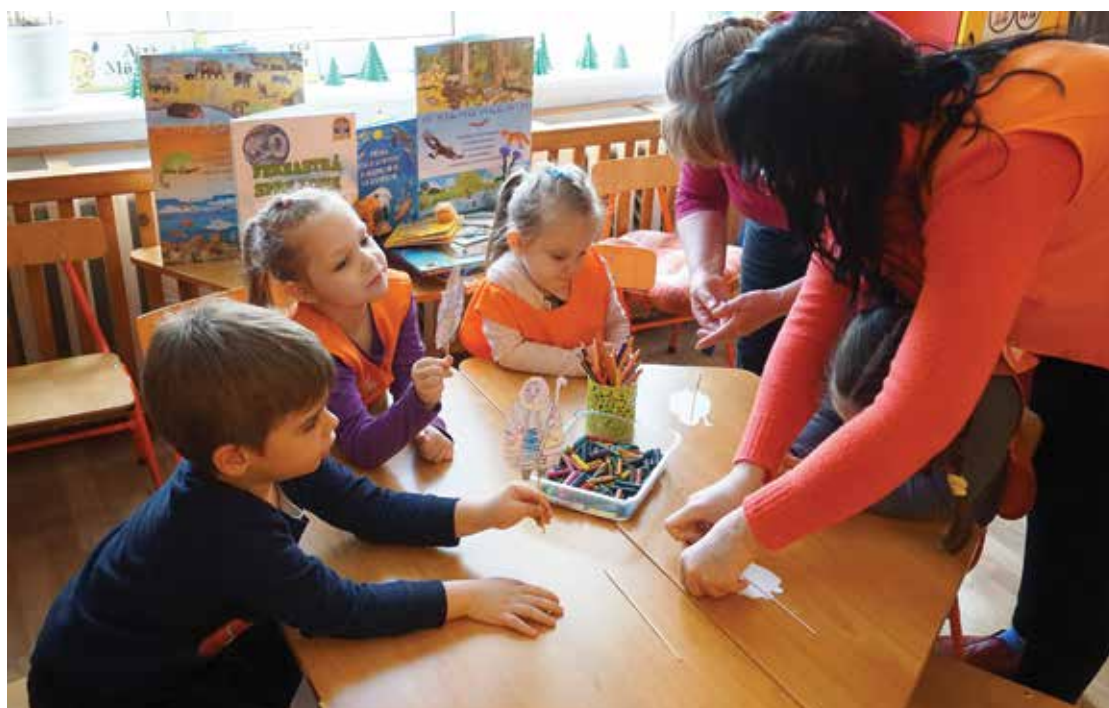
PI. 2 Activități dedicate Sărbătoarea primăverii în unități de învățământ, februarie 2020. PI. 2 Activities dedicated to Spring Holiday celebrated in schools, February 2020.