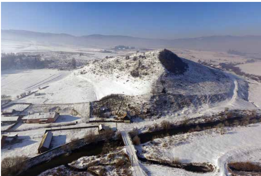
Pl. 11 Cetatea dacică de la Jigodin III. Pl. 11 The Dacian fortress of Jigodin III.