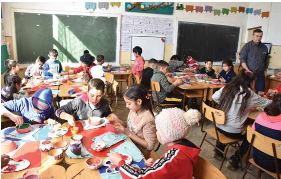
PI. 6 Ateliere de pictură pe vase ceramice în unități de învățământ. PI. 6 Painting on ceramic vessels workshops in schools.