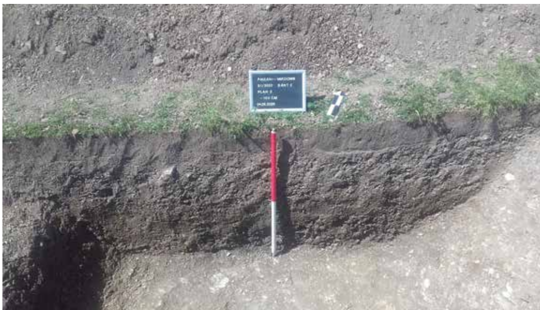
PI. 9 Cercetare arheologică la Păuleni-Ciuc, Dâmbul Cetății . PI. 9 Archaeological research at Păuleni-Ciuc, Dâmbul Cetății .