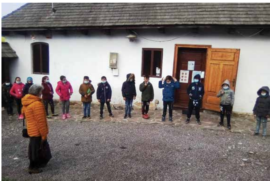
PI. 21 Tradiție și modernitate, vizite ghidate la Casa memorială Romulus Cioflec. PI. 21 Tradition and modernity, guided tours of the Romulus Cioflec Memorial House.