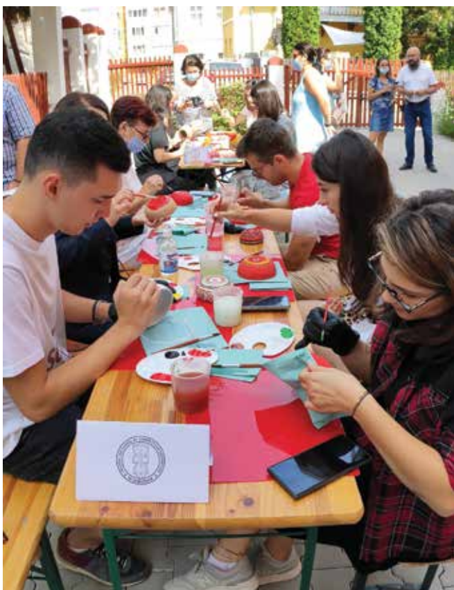
PI. 4 Atelier de scriere cu pana la Prima Școală Românească din Sfântu Gheorghe, grup de vloggeri. PI. 4 Feather writing workshop with up to the First Romanian School from Sfântu Gheorghe, group of vloggers.