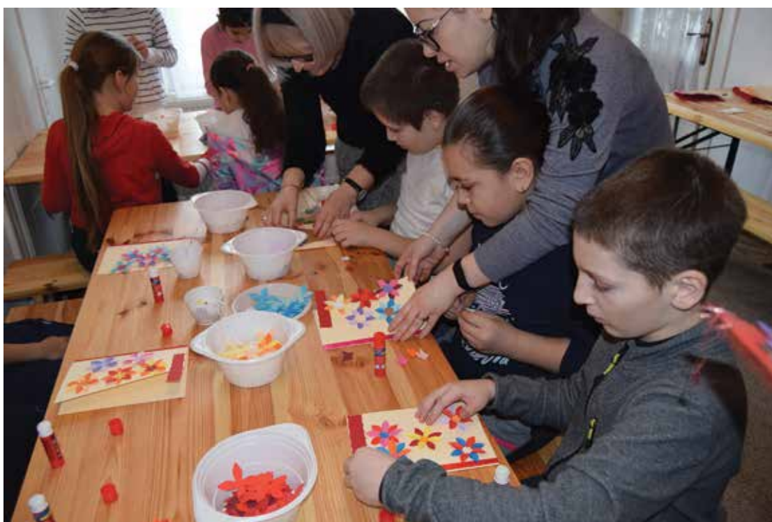
PI. 5 Atelier de confecționat felicitări la MOMS. PI. 5 Postcards workshop at MOMS.