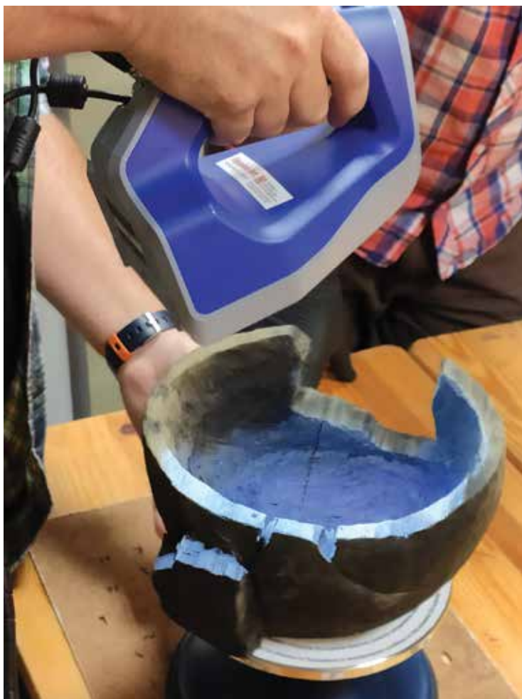
PI. 18 Scanare 3D a obiectelor ceramice din patrimoniul MNCR. PI. 18 3D scanning of ceramic objects from the MNCR heritage.