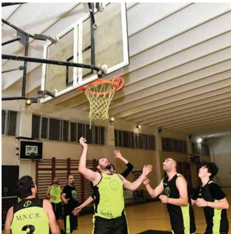
PI. 17 Joc și sport - Campionatul Județean de baschet amator Covasna, echipa de baschet MNCR. PI. 17 Games and Sports - Covasna County Amateur Basketball Championship, MNCR Basketball Team.