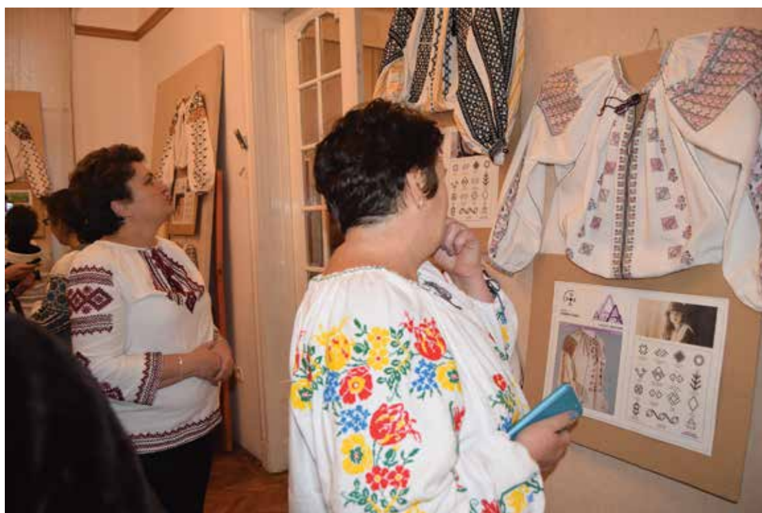
Pl. 13 Expoziția AIDOMA la MNCR, ianuarie-februarie 2020. Pl. 13 AIDOMA exhibition at MNCR, January-February 2020.