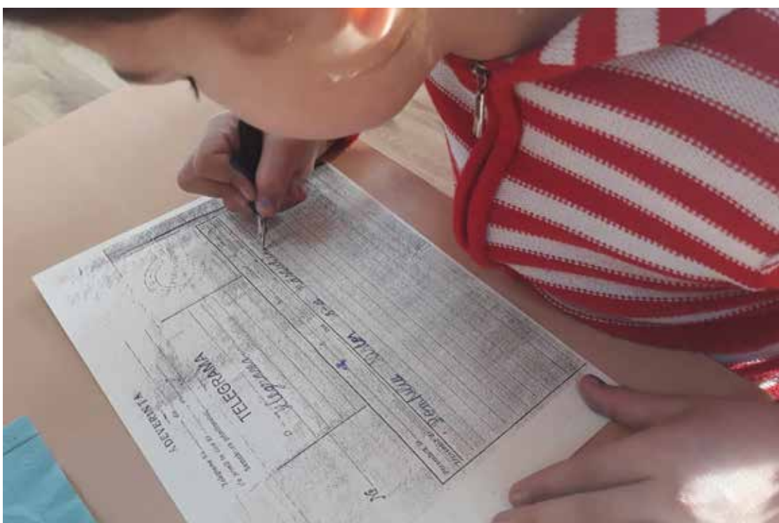
PI. 7 Ateliere de scriere la Școala Gimnazială „Romulus Cioflec” din Araci, februarie 2020. PI. 7 Writing workshops at the Romulus Cioflec Secondary School in Araci, February 2020.