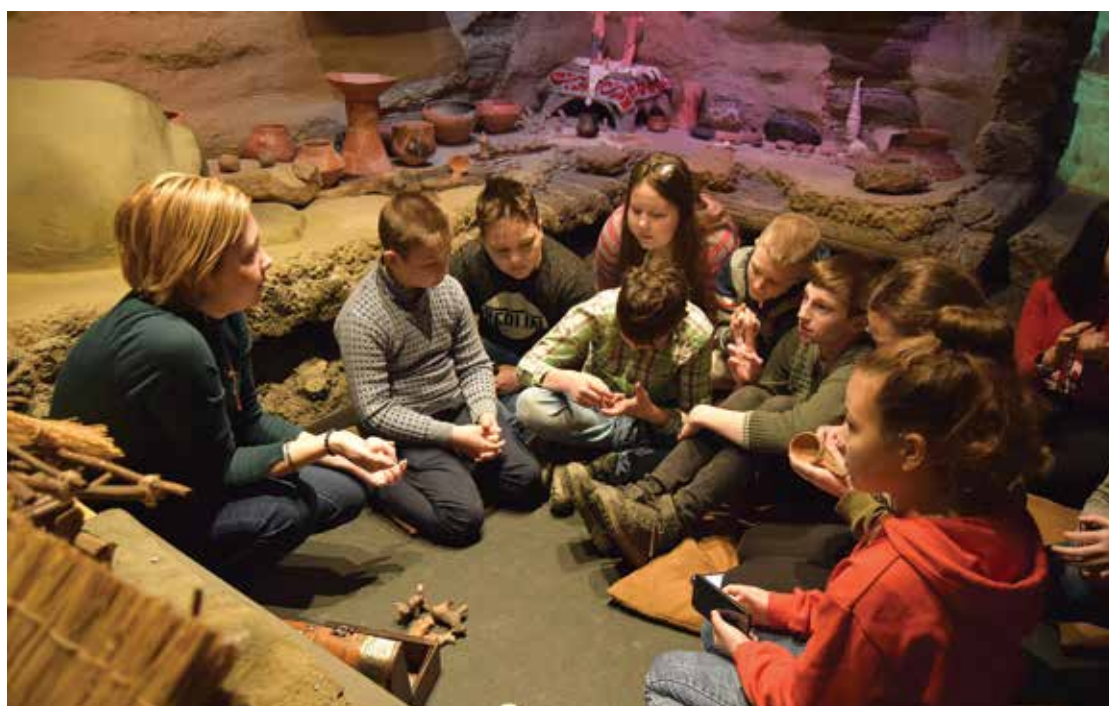
Pl. 25 Tradiție și modernitate- vizite ghidate, jocuri. Pl. 25 Tradition and modernity - guided tours, games.