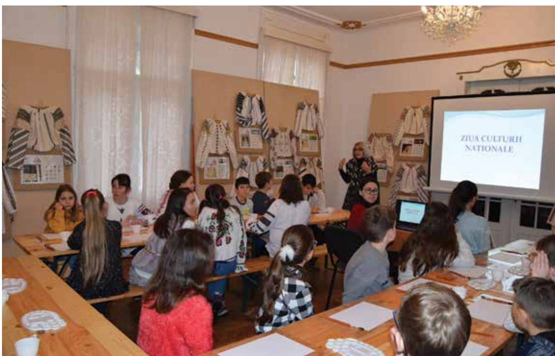
PI. 27 Ziua Culturii Naționale la MOMS, 15 ianuarie 2020. PI. 27 National Culture Day at MOMS, January 15, 2020.