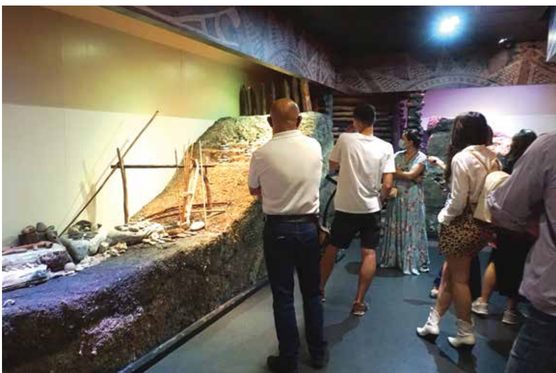
PI. 19 Tradiție și modernitate- vizite ghidate. PI. 19 Tradition and modernity - guided tours.