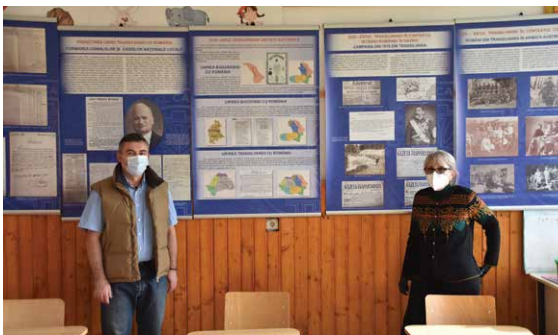
PI. 15 Itinerarea expoziției foto-documentare Sud-estul Transilvaniei în contextul Marii Uniri la Școala Gimnazială din Apold. PI. 15 Itinerary of the photo-documentary exhibition Southeastern Transylvania in the context of the Great Union at the Apold Secondary School.