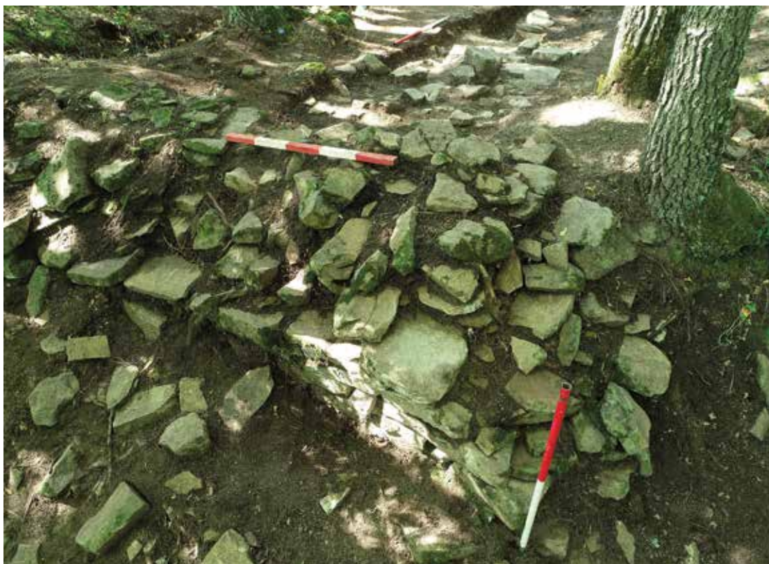
PI. 10 Cercetările în cetatea preistorică de la Valea Seacă, Cece. PI. 10 Research in the prehistoric fortress of Valea Seacă, Cece.