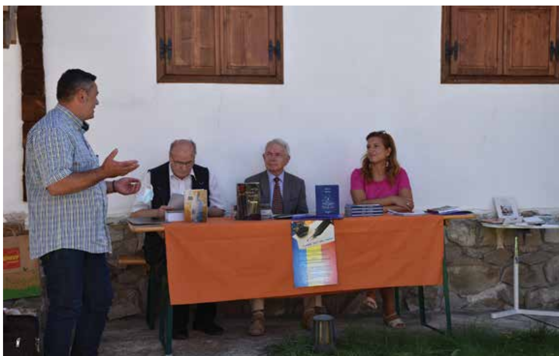
PI. 29 Ziua Limbii Române la Prima Școală Românească Sf. Gheorghe, august 2020. PI. 29 Romanian Language Day at the First Romanian School in Sf. Gheorghe, August 2020.