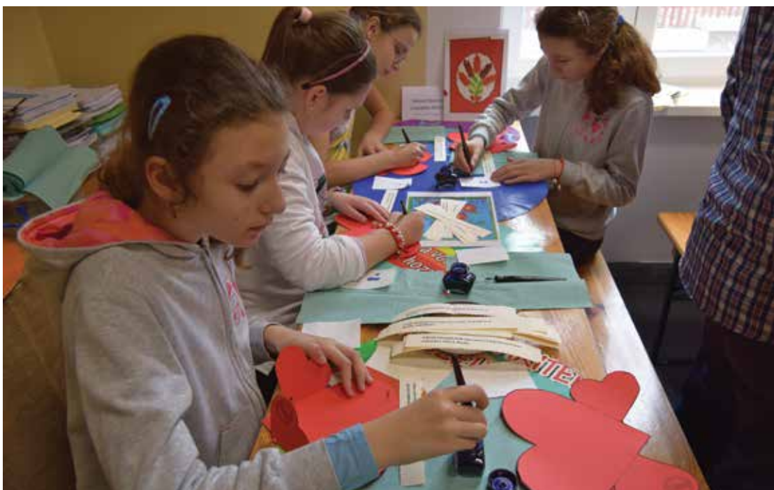
Pl. 12 Dragobetele vestește primăvara, atelier creativ. Pl. 12 Dragobetele announces spring, creative workshop.