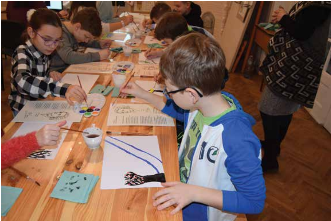
PI. 28 Ziua Culturii Naționale la MOMS, 15 ianuarie 2020. PI. 28 National Culture Day at MOMS, January 15, 2020.