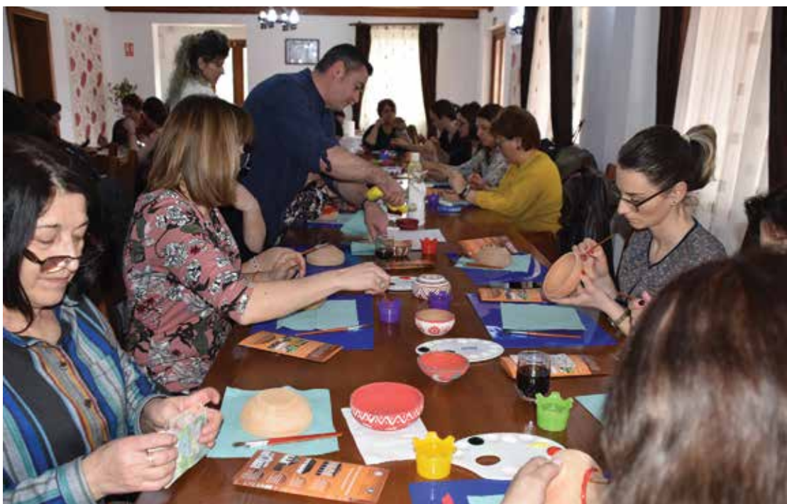
PI. 8 Cerc pedagogic, martie 2020. PI. 8 Pedagogical circle, March 2020.