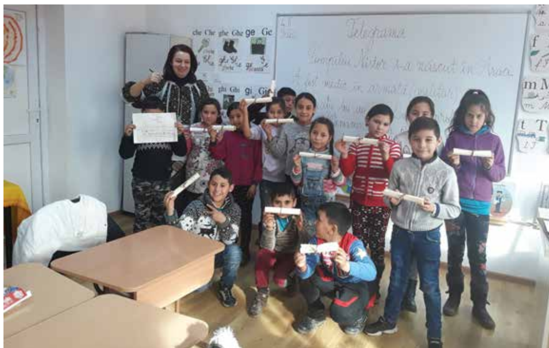
Pl. 14 Ateliere de scriere la Școala Gimnazială „Romulus Cioflec” din Araci, februarie 2020. Pl. 14 Writing workshops at the Romulus Cioflec Secondary School in Araci, February 2020.