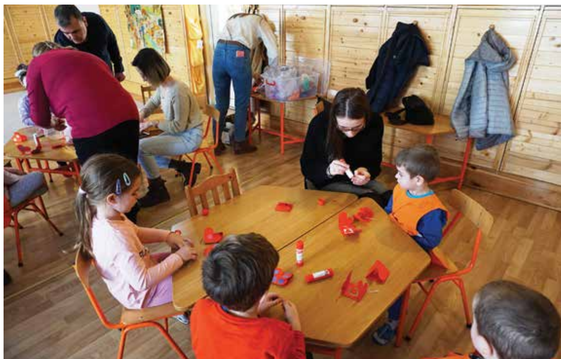
PI. 22 Tradiție și modernitate, atelier de confecționat măștișoare. PI. 22 Tradition and modernity, creative workshop.