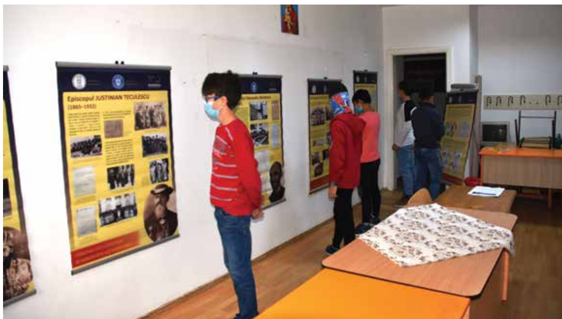
PI. 16 Itinerarea expoziției Personalități covășnene și harghitene ale Marii Uniri la Școala Gimnazială din Zăbrătău. PI. 16 Itinerary of the exhibition Covasna and Harghita personalities of the Great Union at the Zăbrătău Secondary School.