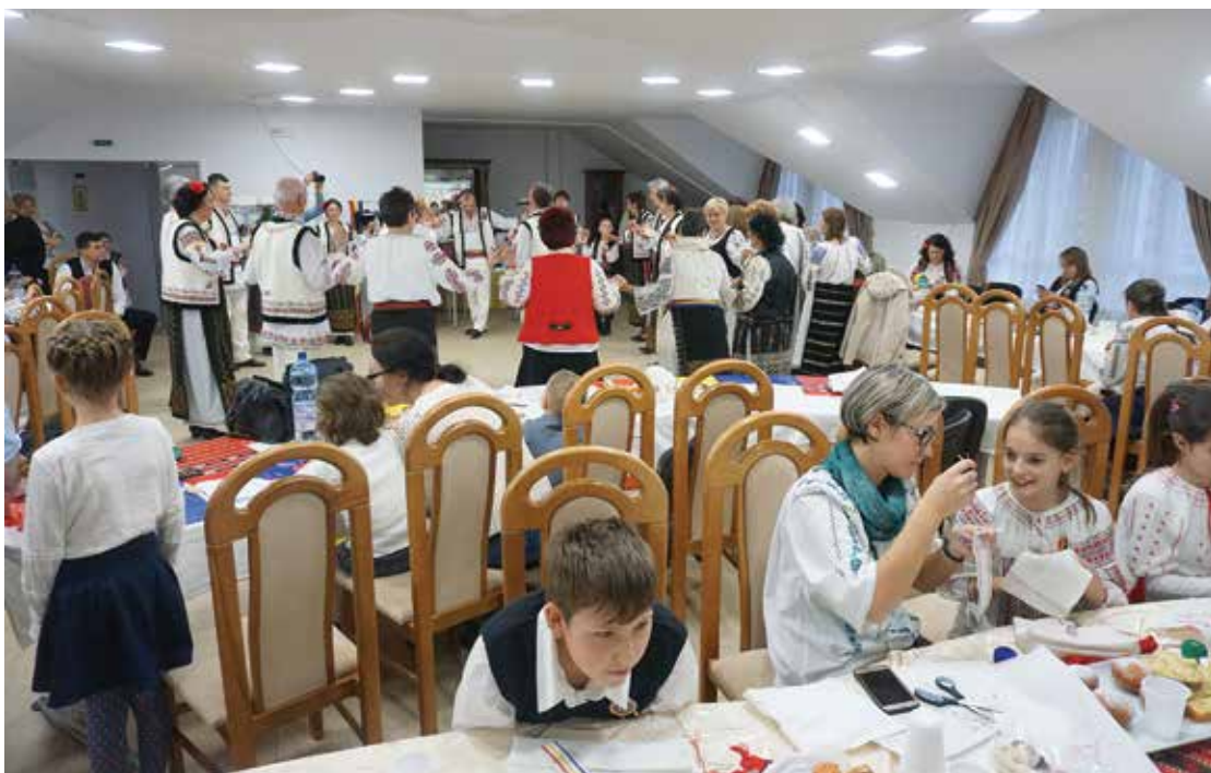
PI. 23 Tradiție și modernitate - Șezătoare călătore, ateliere creative. PI. 23 Tradition and modernity, creative workshops.