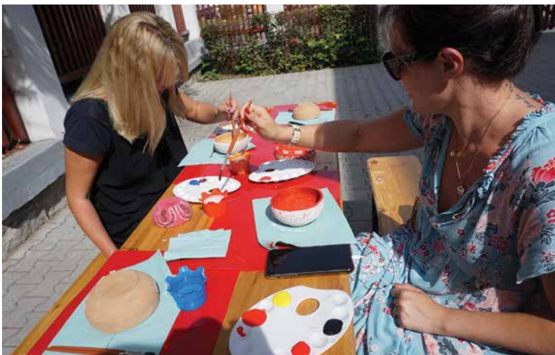
PI. 20 Tradiție și modernitate, atelier de pictură pe vase ceramice. PI. 20 Tradition and modernity, painting on ceramic vessels workshop.