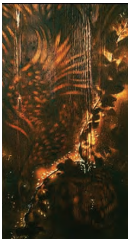
Fig. 5 Lucrare a pictorului Csomortáni Gál László.

Fig. 4 Work by the painter Csomortáni Gál László.