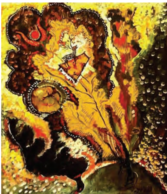
Fig. 4 Lucrare a pictorului Csomortáni Gál László.

Fig. 4 Work by the painter Csomortáni Gál László.