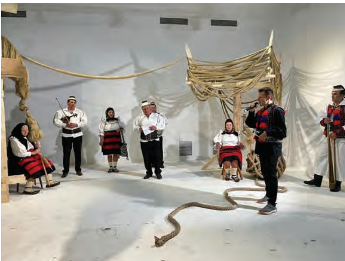
Fig. 6 Proiectul „[În]toarcem cânepa spre viitor” (Muzeul Național al Țăranului Român, iunie 2021) (foto preluată de pe pagina web: https://www.modernism.ro/2021/06/05/mircea-cantor-florica-zaharia-olah-gyarfas-intoarcem-canepa-spre-viitor-muzeul-national-al-taranului-roman/ , accesată la 12 noiembrie 2022).

Fig. 6 Project [În]toarcem cânepa spre viitor - We spin/turn the hemp to the future (National Museum of the Romanian Peasant, June 2021) (photo credit: https://www.modernism.ro/2021/06/05/mircea-cantor-florica-zaharia-olah-gyarfas-intoarcem-canepa-spre-viitor-muzeul-national-al-taranului-roman/ , accessed on 12 noiembrie 2022).