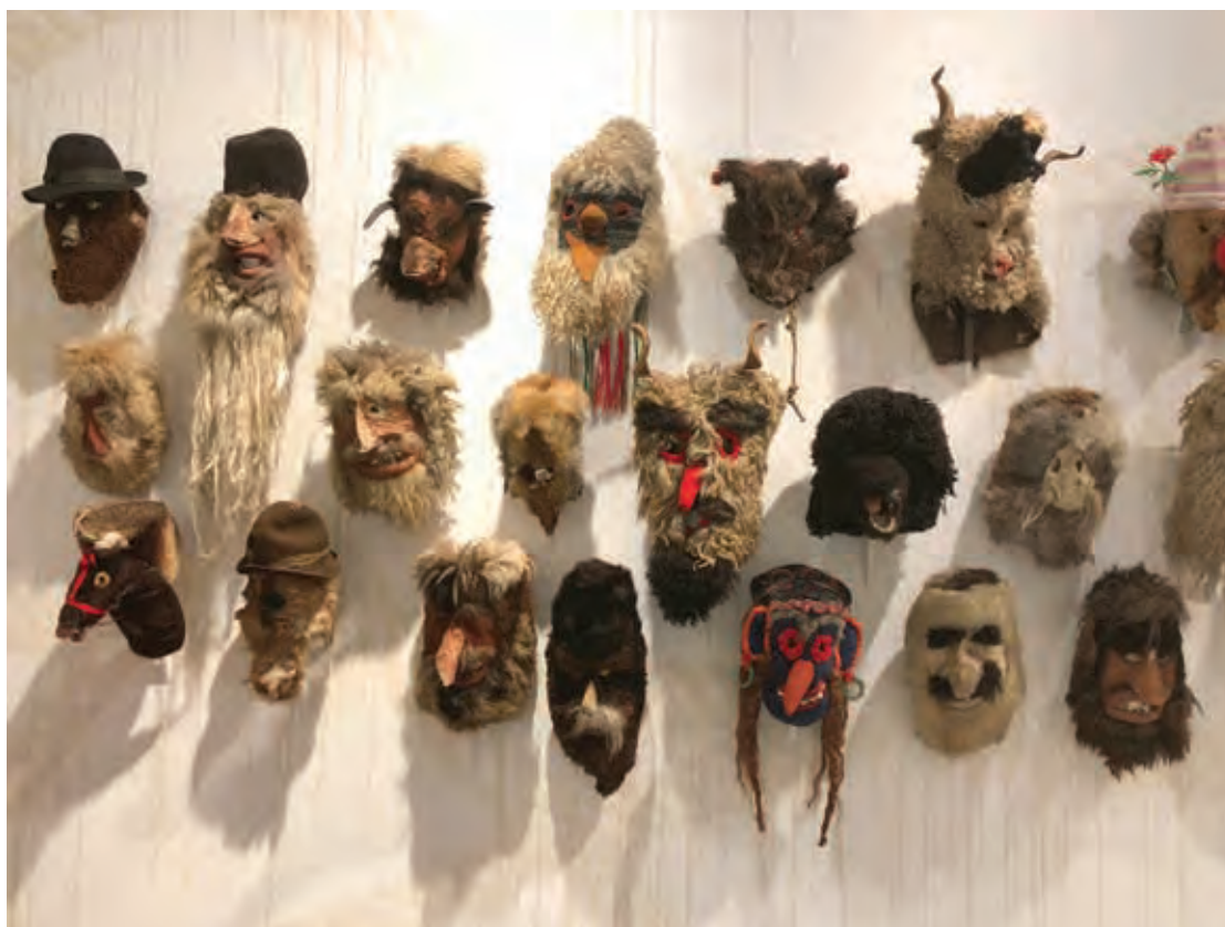
Fig. 7 Măști populare din colecția Muzeului Național al Țăranului Român, autor Mircea Cantor (foto preluată de pe pagina web: https://www.observatorcultural.ro/articol/mircea-cantor-la-vinatoare-de-semne/ , accesată la 12 noiembrie 2022).

Fig. 7 Traditional masks from the collection of the National Museum of the Romanian Peasant, author Mircea Cantor (photo credit: https://www.observatorcultural.ro/articol/mircea-cantor-la-vinatoare-de-semne/ , accessed on 12 noiembrie 2022).