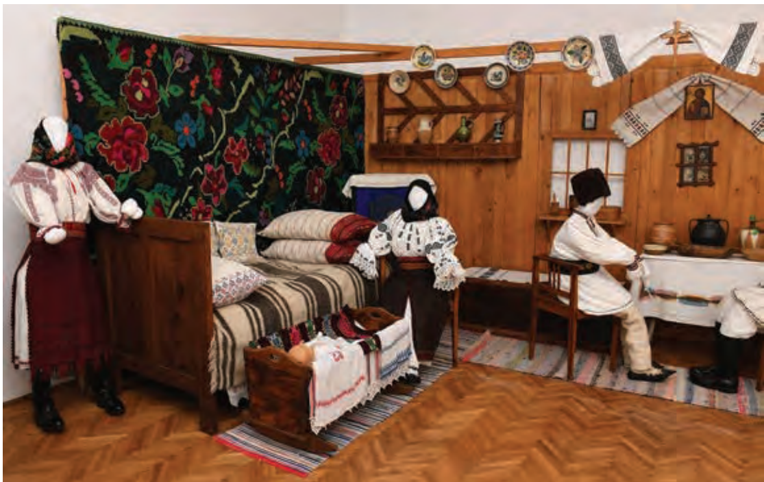
Fig. 8 Expoziția Interior Țărănesc , Muzeul Oltului și Mureșului Superior, Miercurea-Ciuc (foto Cosmina Oltean, 2021).