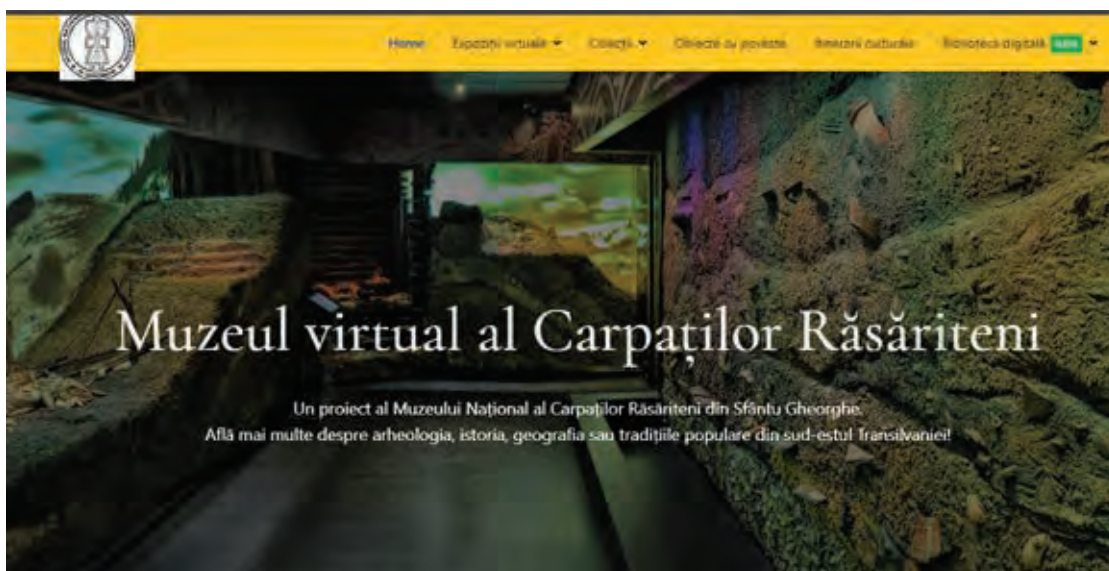
Fig. 10 Pagina web a Muzeului Național al Carpaților Răsăriteni, secțiunea Muzeul Virtual ( https://muzeu.mncr.ro/index.php/mncr-virtual , accesată la 12 noiembrie 2022).