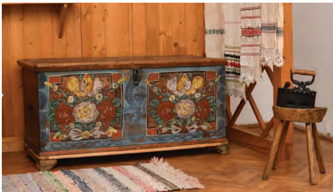
Fig. 2 Ladă de zestre din expoziția Interior țărănesc (Muzeul Oltului și Mureșului Superior, Miercurea-Ciuc).

Fig. 1. Ethnographic patrimony of the National Museum of the Eastern Carpathians – Categories (according to data extracted from MNCR Report 2021).