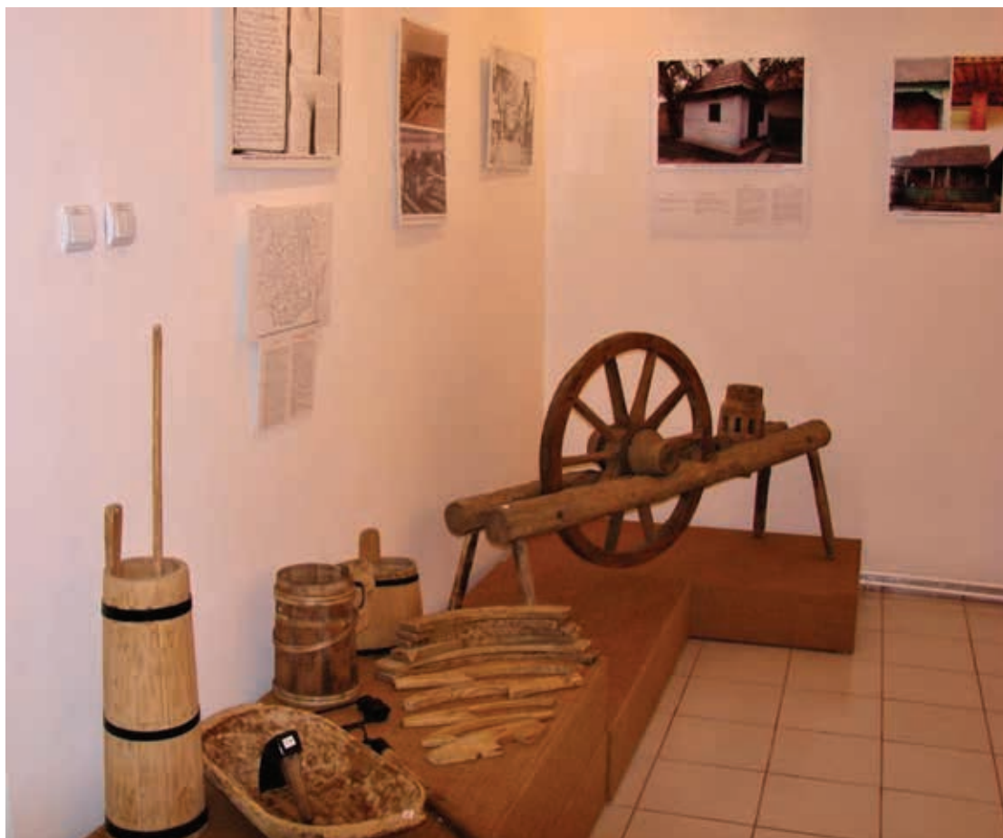
Fig. 9 Expoziția Civilizația lemnului în Estul Transilvaniei. Interferențe. Plutăritul, prelucrarea și comerțul lemnului (Muzeul Național al Carpaților Răsăriteni, Sfântu Gheorghe) (foto Andrea Popa, 2007).