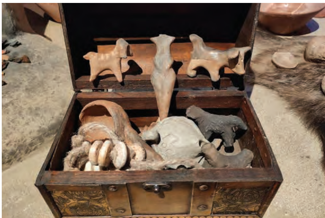
Fig. 13 Jocul „Cutia cu surprize” realizat și utilizat în activitățile MNCR.

Fig. 13 The “Surprise Box” game made and used in MNCR/NMEC activities.