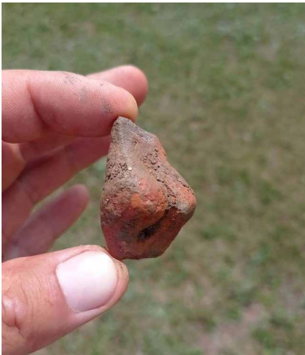
Fig. 5 Fragment de figurină antropomorfă descoperită la Păuleni-Ciuc - Dâmbul Cetății (foto Puskás József, 2022).

Fig. 5 Fragment of an anthropomorphic figurine discovered at Păuleni-Ciuc - Dâmbul Cetății (photo Puskás József, 2022).