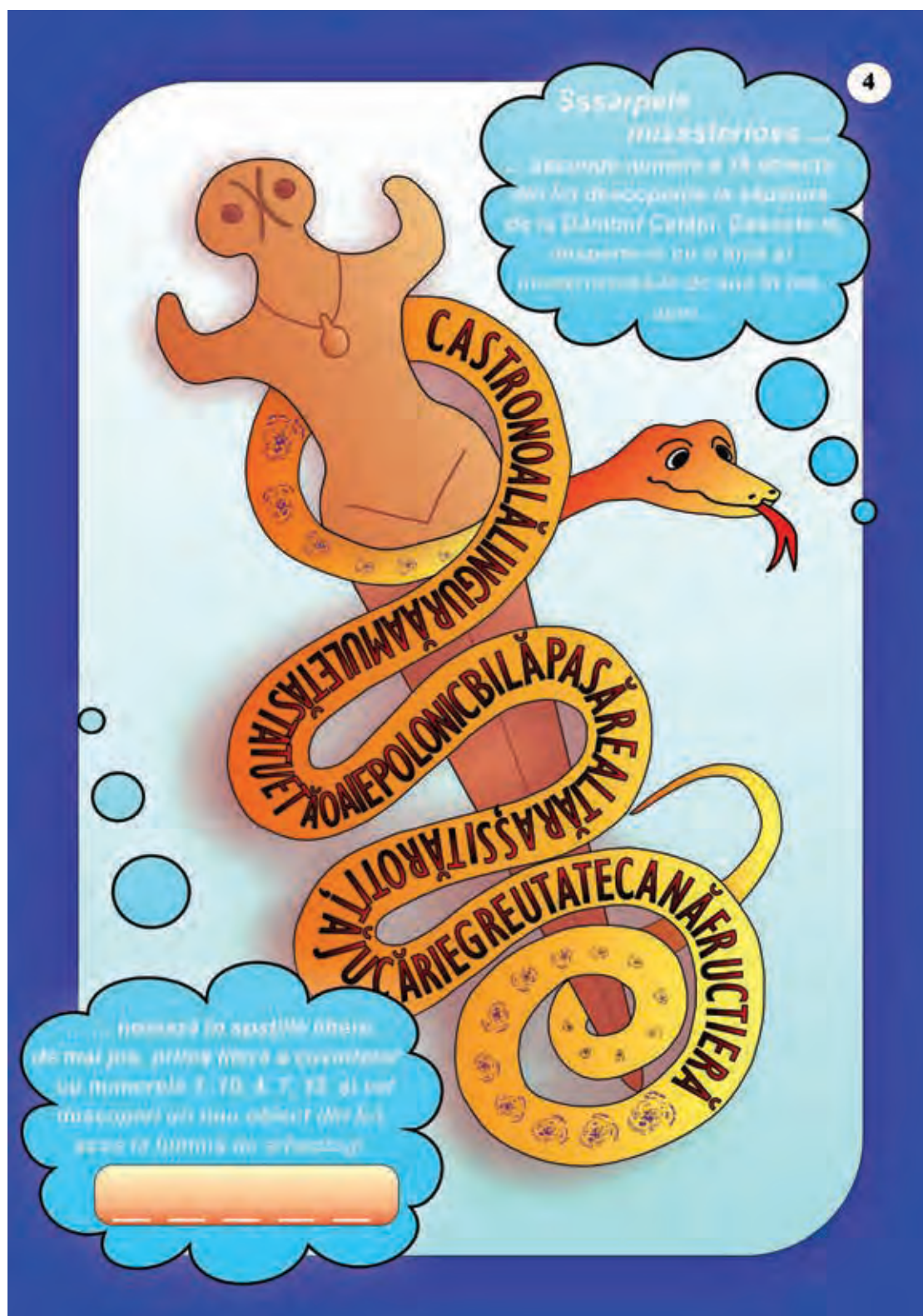
Fig. 17 Caietul de lucru „Micul/Tânărul Arheolog”, realizat în cadrul proiectului MNCR „Tabăra de arheologie experimentală Păuleni-Ciuc”, 2009.