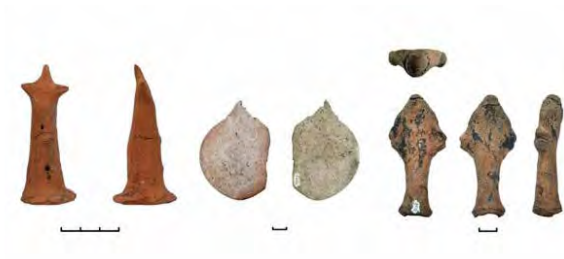
Fig. 3 Figurine antropomorfe de diferite tipuri și confecționate din diferite materiale (lut, corn și os) descoperite la Păuleni-Ciuc - Dâmbul Cetății.

Fig. 3 Anthropomorphic figurines of different types and made of different materials (clay, red deer antler and bone) discovered at Păuleni-Ciuc - Dâmbul Cetății.