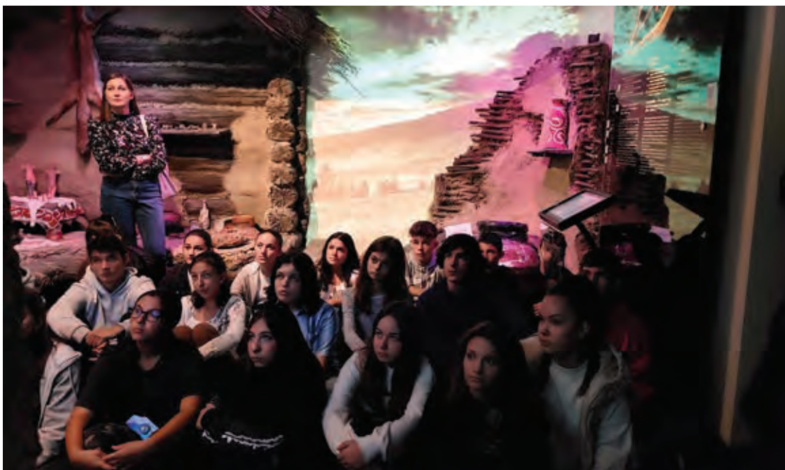
Fig. 11 Ghidaj în cadrul expoziției de arheologie Păuleni-Ciuc - Dâmbul Cetății (Sala de prezentare a culturii Cucuteni-Ariuşd) (foto Arhiva MNCR).

Fig. 11 Guided tour in the archaeology exhibition Păuleni-Ciuc - Dâmbul Cetății (Hall of presentation of the Cucuteni-Ariuşd culture) (photo MNCR/NMEC Archive).