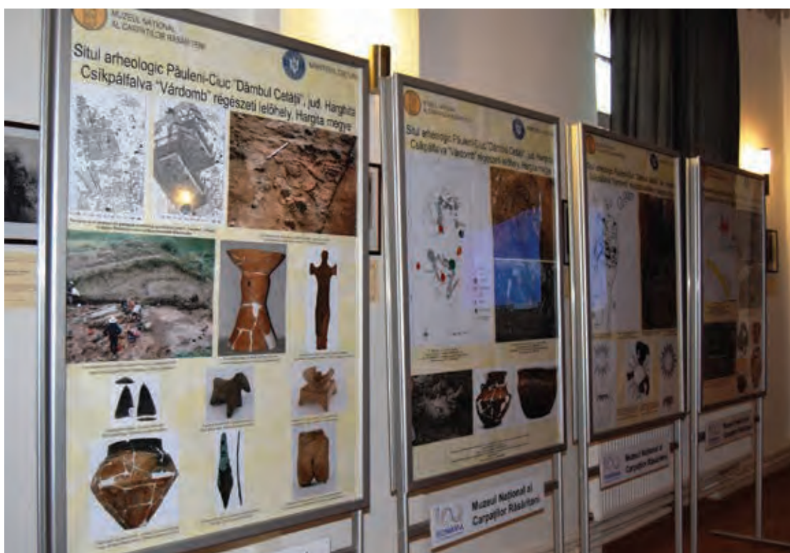
Fig. 22 Expoziția foto-documentară „Situl arheologic Păuleni-Ciuc - Dâmbul Cetății, jud. Harghita”, itinerată la Căminul Cultural din Păuleni-Ciuc, jud. Harghita (septembrie 2021). Fig. 22 Photo-documentary exhibition “Archaeological site Păuleni-Ciuc - Dâmbul Cetății, Harghita County”, itinerant at the Cultural Centre of Păuleni-Ciuc, Harghita County (September 2021).