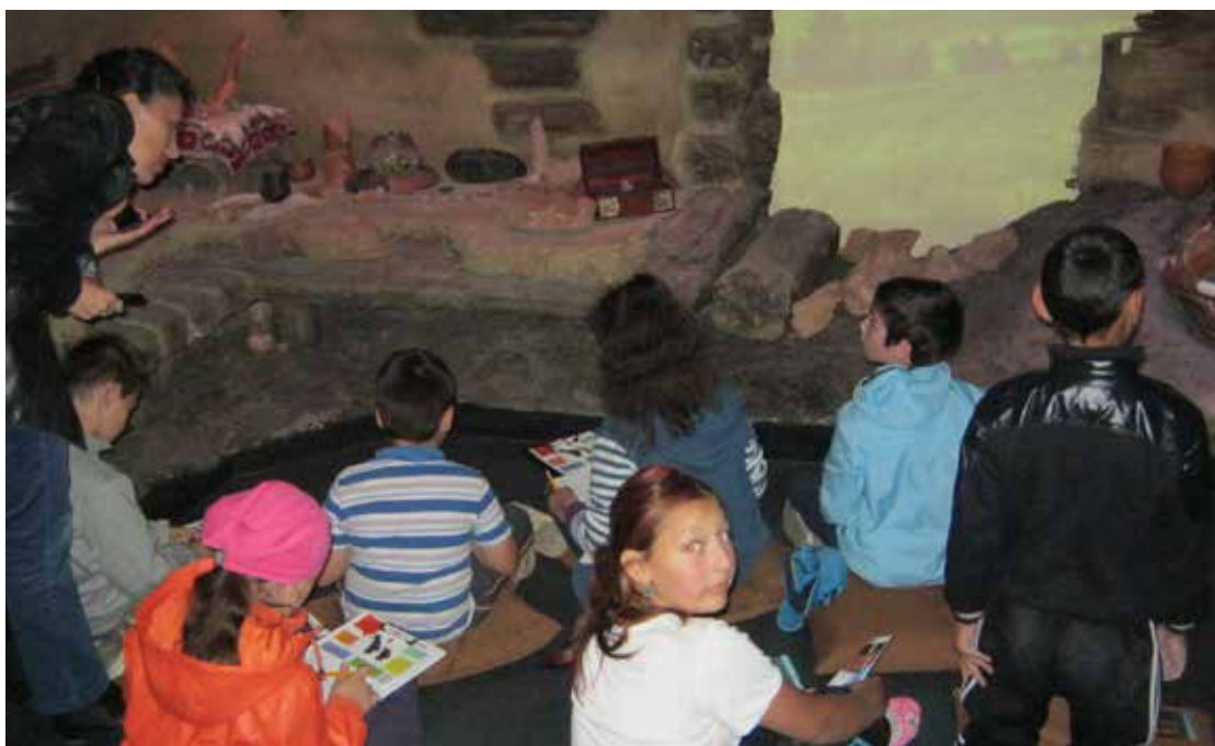
Fig. 10 Vizitatori în cadrul expoziției Cucuteni-Ariușd a MNCR. Fig. 10 Visitors in the Cucuteni-Ariușd exhibition of the MNCR/NMEC.