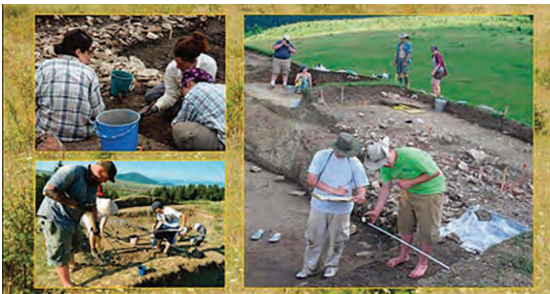
Fig. 15 Activități derulate în cadrul Taberei de arheologie experimentală de la Păuleni-Ciuc - Dâmbul Cetății (Afișul taberei, 2009) (foto Arhiva MNCR).