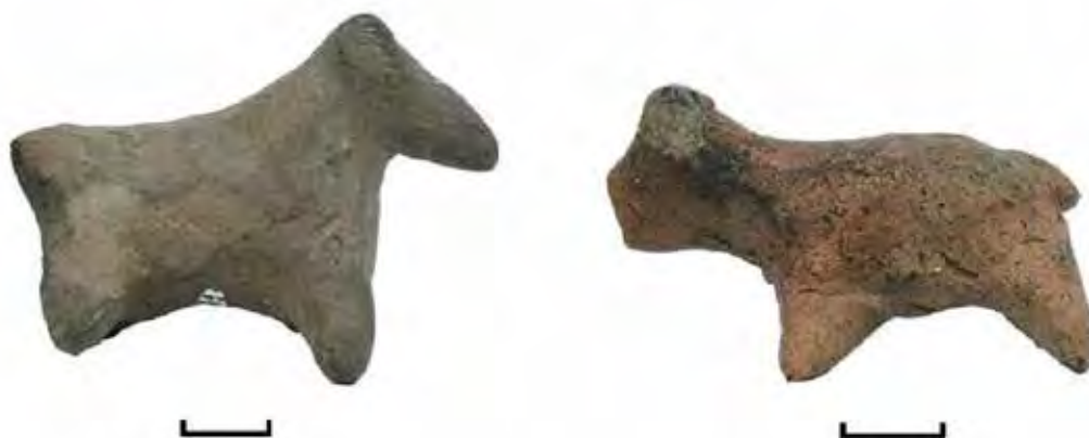
Fig. 8 Figurine zoomorfe Cucuteni-Ariuşd din colecția MNCR. Fig. 8 Cucuteni-Ariuşd zoomorphic figurines from the MNCR/NMEC collection.