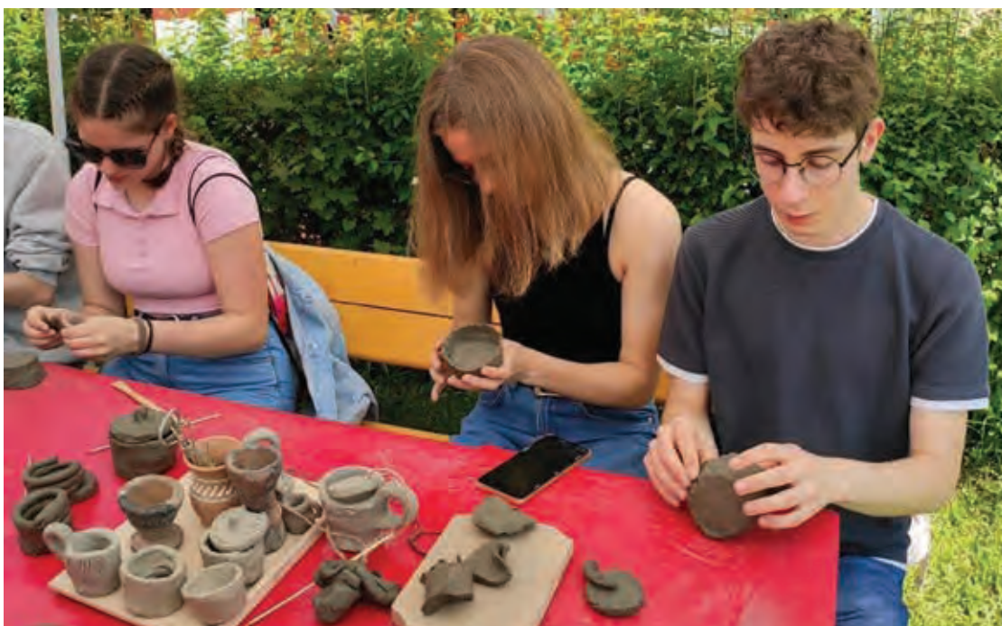
Fig. 12 Participanți la atelierul de modelaj în lut organizat în curtea MNCR.

Fig. 11 Guided tour in the archaeology exhibition Păuleni-Ciuc - Dâmbul Cetății (Hall of presentation of the Cucuteni-Ariuşd culture).