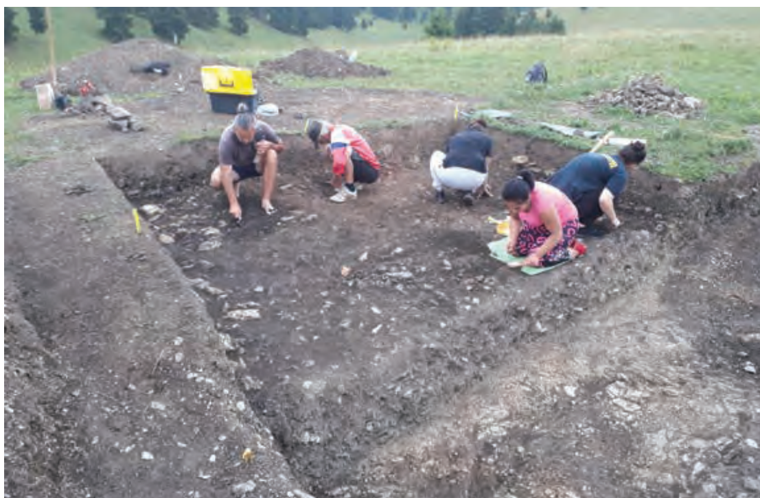
Fig. 21 Săpături arheologice pe șantierul de la Păuleni-Ciuc - Dâmbul Cetății (Campania 2021).

Fig. 20 Game in the permanent exhibition Păuleni-Ciuc - Dâmbul Cetății of the MNCR/NMEC.