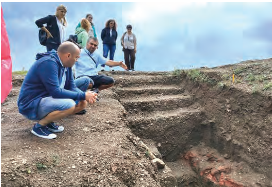
Fig. 16 Ziua Porților Deschise organizată la situl arheologic de la Păuleni-Ciuc - Dâmbul Cetății (august 2021).