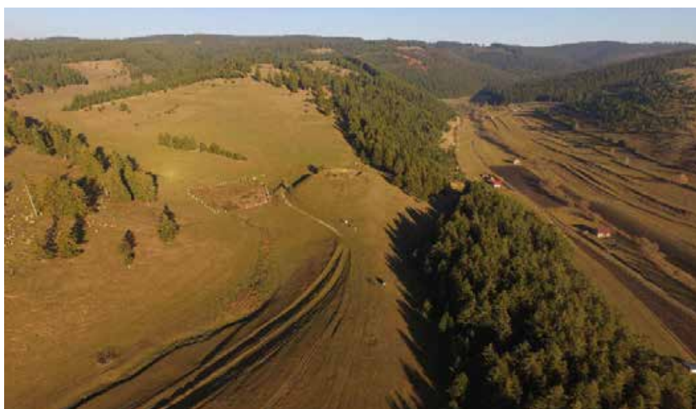
Fig. 1 Vedere aeriană dinspre vest a sitului de la Păuleni-Ciuc - Dâmbul Cetății, jud. Harghita.

Fig. 1 Aerial view from the west of the site at Păuleni-Ciuc - Dâmbul Cetății, Harghita County.