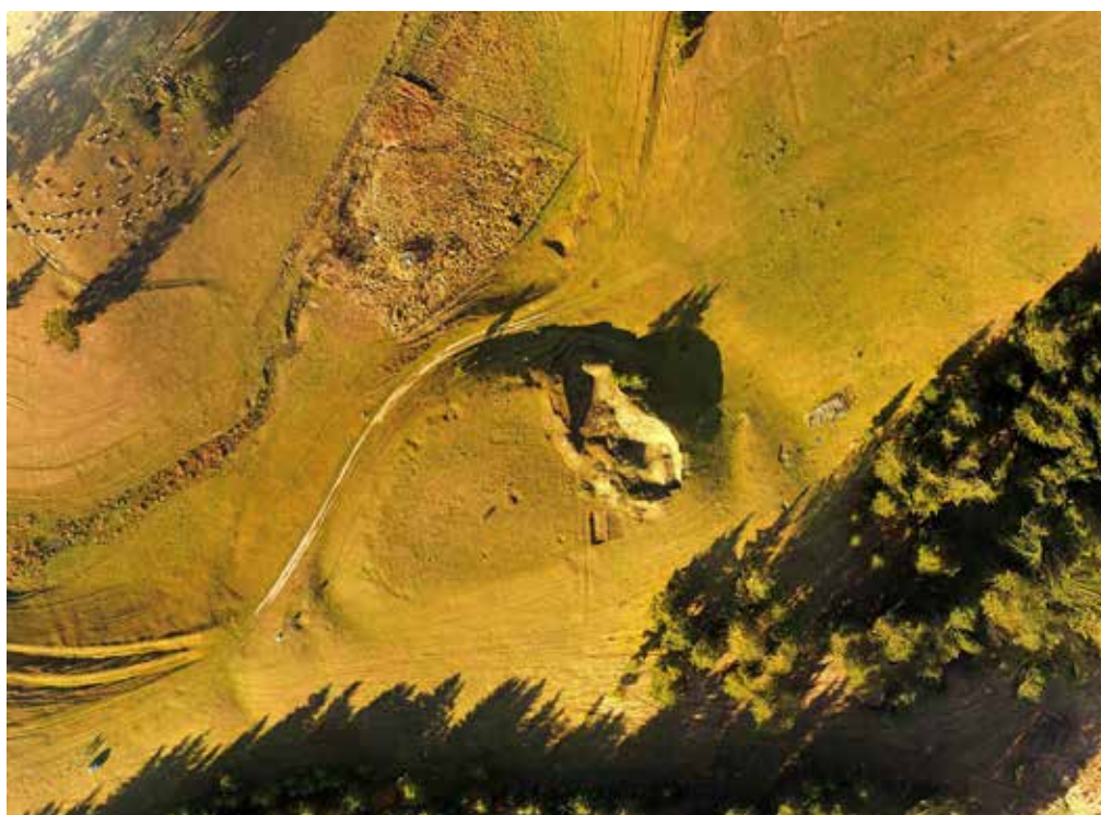
Fig. 2 Vedere aeriană la verticală a sitului de la Păuleni-Ciuc - Dâmbul Cetății, jud. Harghita.

Fig. 1 Aerial view from the west of the site at Păuleni-Ciuc - Dâmbul Cetății, Harghita County.