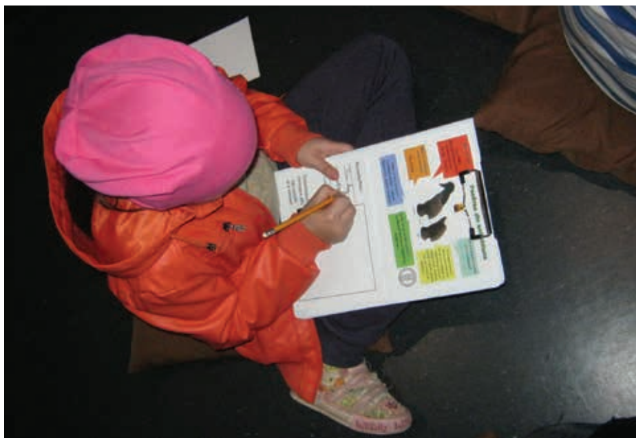
Fig. 20 Joc în cadrul expoziției de bază Păuleni-Ciuc - Dâmbul Cetății a MNCR (foto Arhiva MNCR).

Fig. 20 Game in the permanent exhibition Păuleni-Ciuc - Dâmbul Cetății of the MNCR/NMEC (photo MNCR/NMEC Archive).