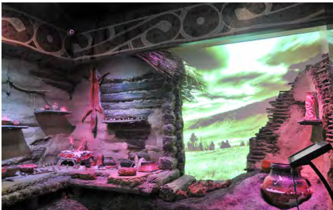
Fig. 9 Reconstituirea unei locuințe cucuteniene descoperite la Păuleni-Ciuc - Dâmbul Cetății (expoziția de bază a MNCR). Fig. 9 Reconstruction of a Cucuteni dwelling discovered at Păuleni-Ciuc - Dâmbul Cetății (MNCR/NMEC permanent exhibition).