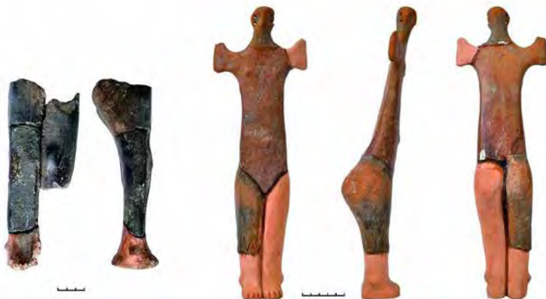
Fig. 7 Statuete antropomorfe de dimensiuni mari descoperite la Păuleni-Ciuc - Dâmbul Cetății (apud Kavruk et al. 2022, Pl. 12/14-15). Fig. 7 Large anthropomorphic statuettes discovered at Păuleni-Ciuc - Dâmbul Cetății (after Kavruk et al. 2022, Pl. 12/14-15).