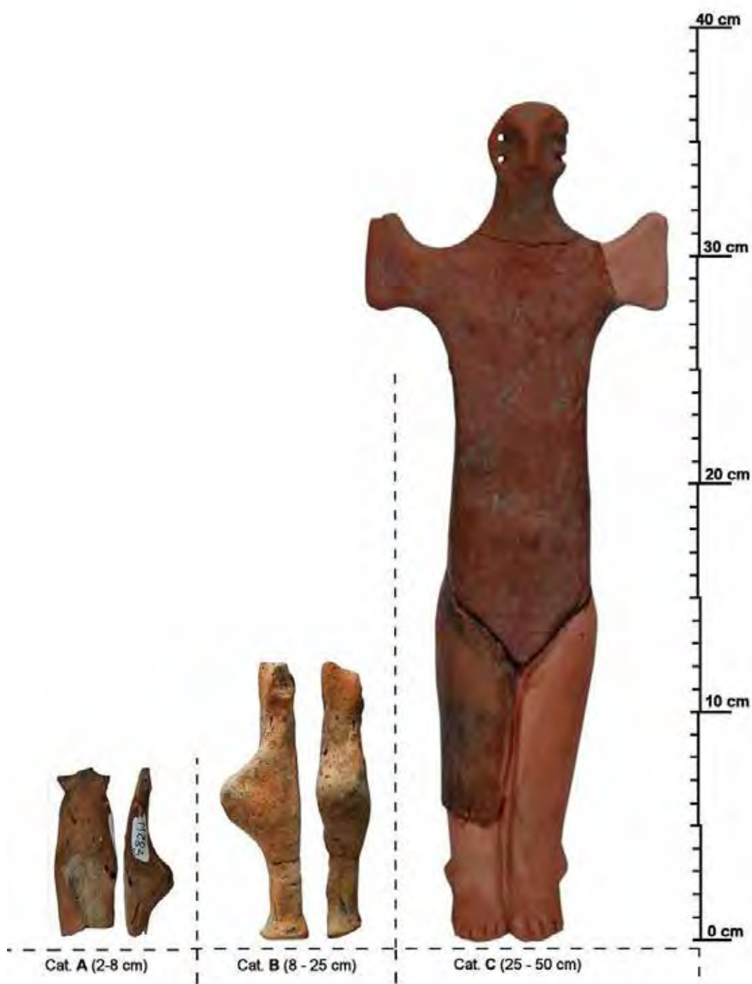
Fig. 6 Categoriile de statuete antropomorfe (A, B și C) ( apud Buzea, Kovács 2015).