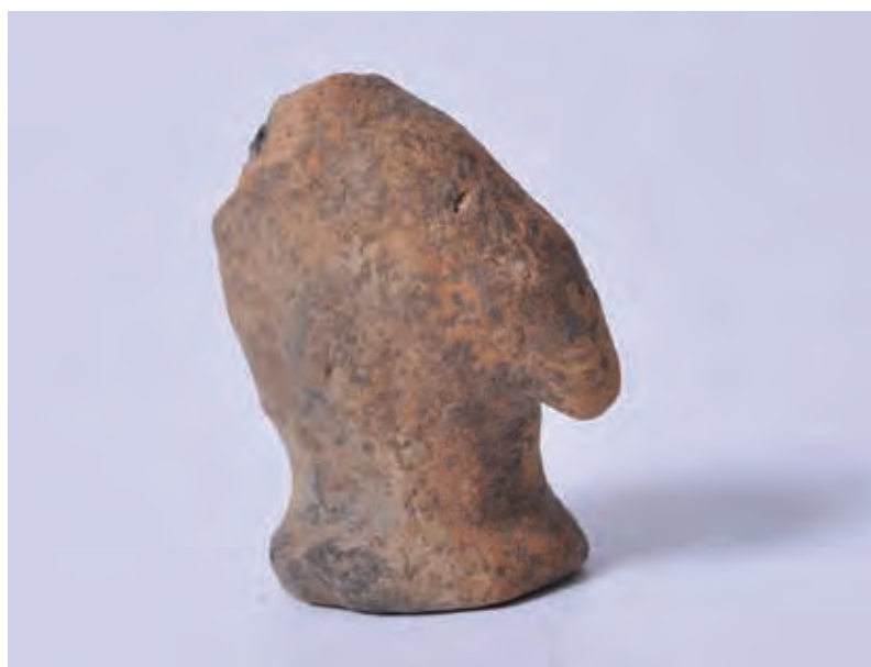
Fig. 19 Figurină de lut Cucuteni-Ariuşd reprezentând o pasăre (colecția MNCR).