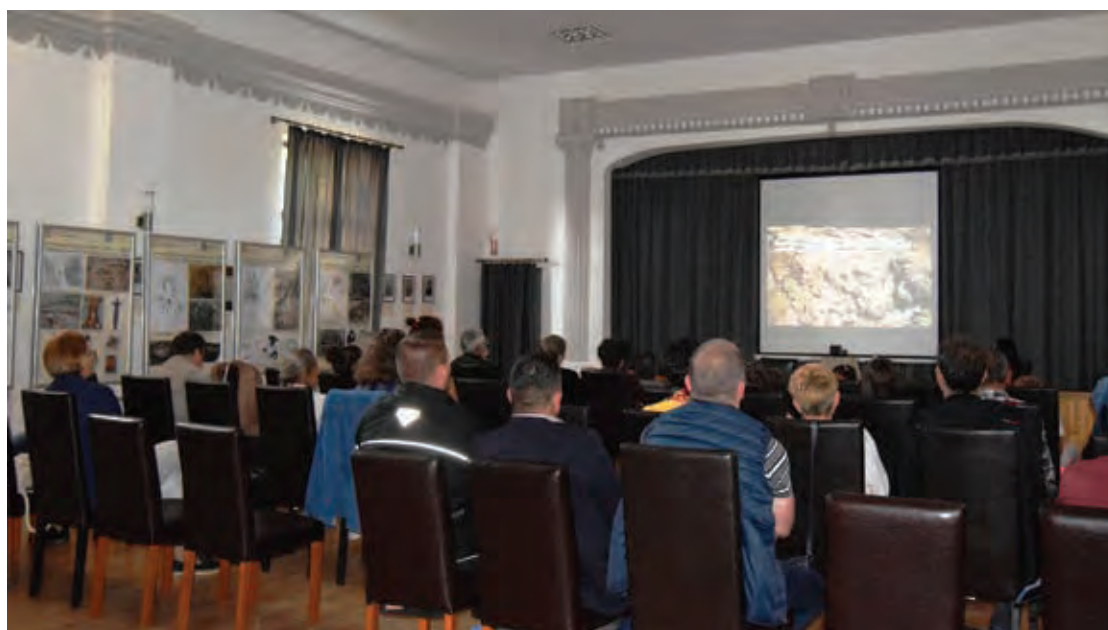
Fig. 14 Lecție deschisă pentru membrii comunității din Păuleni-Ciuc, jud. Harghita (septembrie 2021).

Fig. 13 The “Surprise Box” game made and used in MNCR/NMEC activities.