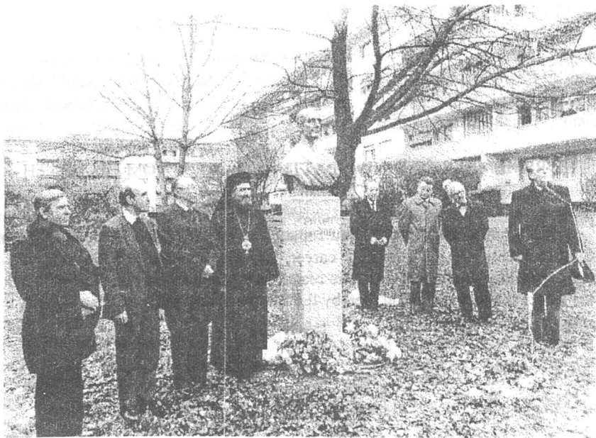
1982. Comemorarea lui Dinu Lipatti în parcul din Chênc-Bourg.

Au fost interpretate piese de Mozart, Brahms, Chopin, Liszt, iar din compozițiile lui Dinu „Sonatine pour la main gauche“.