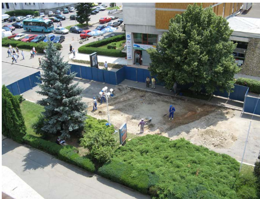
Fig. 6. Reperarea fundației naosului Bisericii Sf. Nicolae. Vedere de ansamblu.

Pentru a clarifica problema fundației bisericii de la 1812, am practicat deschiderea unei casete de 1,5 x 1,5 m perpendiculară pe latura de nord, din exterior (Fig. 7/1), dublând-o ulterior cu încă una, de aceleași dimensiuni, amplasată în interiorul bisericii, de asemenea perpendiculară pe zidul nordic, în prelungirea celei exterioare (Fig. 7/2).