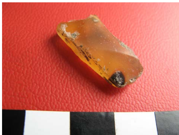
Fig. 18. Perlă din chihlimbar descoperită în colțul de sud-est al naosului bisericii vechi.

Mai menționăm încă două piese de inventar, și anume o perlă din chihlimbar galben-auriu de formă dreptunghiulară aplatizată și fațetată, ruptă de-a lungul canalului transversal prin care era trecut firul de prindere (Fig. 18), descoperită în colțul de sud est al naosului bisericii vechi (la -0,65 m adâncime, așadar cu numai 5 cm mai jos de nivelul la care a fost surprinsă fundația bisericii vechi), precum și o monedă de 100 de lei, emisiune din anul 1937 (Fig. 19), descoperită în zona altarului bisericii noi.