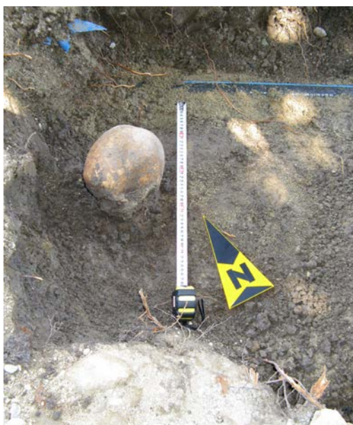
Fig. 15. Craniu izolat, provenind dintr-un mormânt distrus, imediat la sud de conducta de apă.

Alte morminte distruse de intervenții recente. În zona vestică a spațiului cercetat, în apropierea bordurii trotuarului actual, în special pe traseul unei conducte moderne, am descoperit mai multe oase umane izolate (două cranii, vertebre împrăștiate sau în pământul de umplură al șanțului conductei - Fig. 15), fragmente de femur, vertebre) provenind din morminte (aflate în interiorul bisericii noi) distruse de lucrările edilitare moderne.