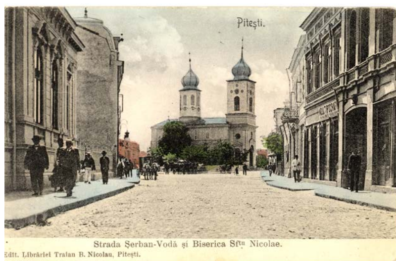
Fig. 3. Biserica Sf. Nicolae, carte poștală ilustrată de la începutul sec. XX.