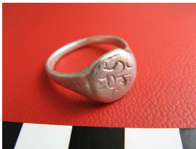
Fig. 17. Inel din argint cu chaton rotund, ornamentat, descoperit în M 4, la sud de biserica nouă.

La mâna dreaptă a scheletului din M 4 plasat în partea de sud a exteriorului naosului bisericii de la 1812, a fost descoperit un inel de argint cu chaton rotund ce face corp comun cu veriga (Fig. 17), ornamentat prin incizie cu motive geometrice (linii drepte, volute, acolade).