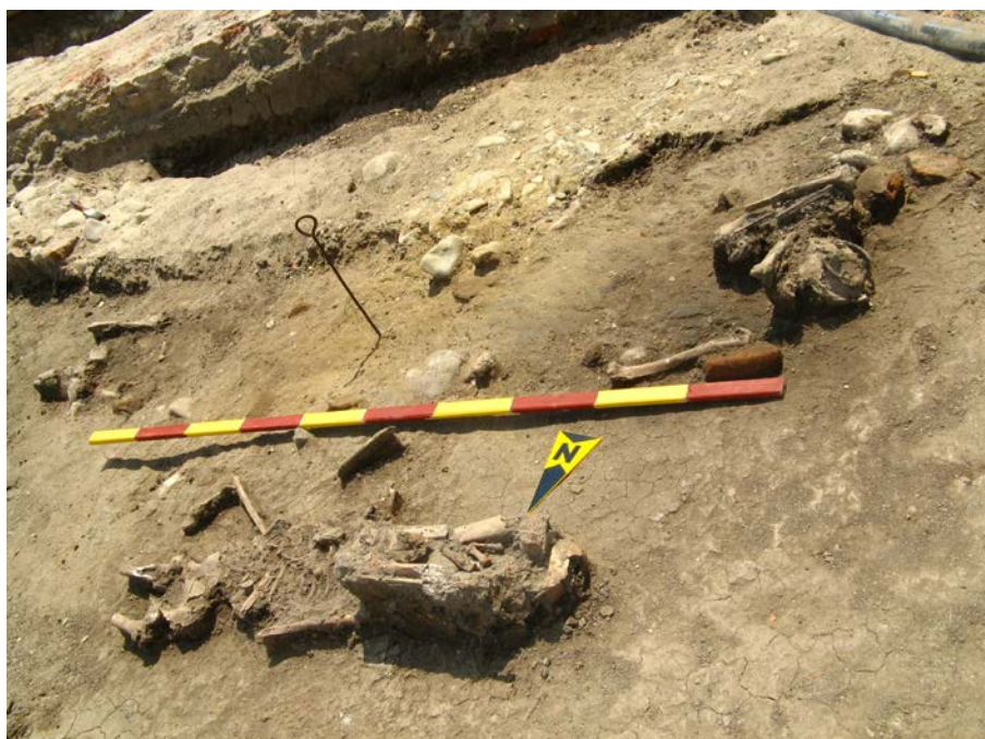
Fig. 12. Mormintele din interiorul bisericii (M 1-3).

mormânt (M 2) în mare parte deranjat și desființat de șanțul respectiv (se păstrau numai oasele picioarelor), precum și o cantitate însemnată de oase depuse grupat (M 3), probabil în urma deranjării mormântului respectiv cu ocazia unei înhumări ulterioare. Mormintele din interior au fost lipsite de inventar funerar, însă în șanțul ce trecea prin acest grup de morminte și care afecta și fundația sudică a bisericii vechi, al am descoperit un inel din aliaj cu suport rotund pentru montură (Fig. 16). Toate cele trei morminte descoperite în interior (M 1-3) țin în mod evident de biserica veche, așadar pot fi datate în sec. al XVIII-lea.