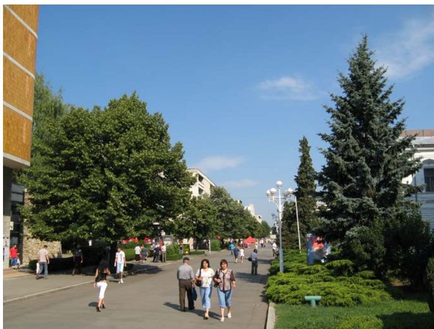
Fig. 5. Zona fostei Biserici Sf. Nicolae, înainte de începerea săpăturilor. Vedere dinspre sud.

În data de 12 iunie 2007 am început lucrul cu organizarea de șantier și cu măsurătorile pentru reperarea amplasamentului exact al monumentului, făcute de la fațada singurului edificiu din apropiere, contemporan bisericii și rămas în picioare până în prezent - Restaurantul Argeș.