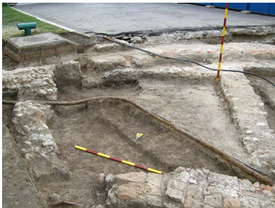
Fig. 10. Fundația altarului bisericii vechi. Vedere dinspre nord-est.

Concluzionând, putem afirma că vechea biserică, construită din cărămidă cândva în sec. al. XVIII-lea, era un locaș modest, de mici dimensiuni: naosul de 6,7 x 5,9 m (la interior), iar altarul, în formă de potcoavă (Fig. 10), având o deschidere de 4 m și o adâncime de 3,2 m (la interior). Fundațiile, atât cea a naosului, cât și cele ale altarului și a catapetesmei, nu depășeau 0,6 m în grosime.