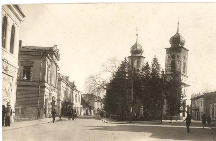
Fig. 4. Imagine de epocă cu bustul lui I. C. Brătianu amplasat în scuarul de la nord de Biserica Sf. Nicolae. În stânga – Restaurantul Argeș.

În scuarul din partea de nord, a fost amplasat, prin 1905, bustul lui Ion C. Brătianu (Fig. 4.), opera sculptorului D. Mirea, dispărut și el după 1947.