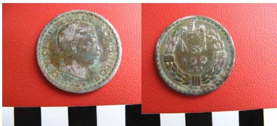
Fig. 19. Monedă de la Carol II (emisiune 1932), în valoare de 100 lei, descoperită în zona altarului bisericii noi.