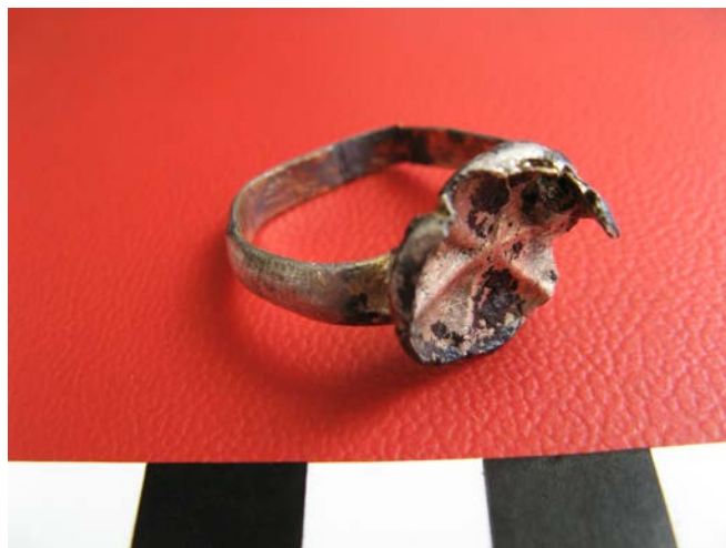
Fig. 16. Inel din aliaj, cu montură, descoperit lângă mormintele din partea sudică a naosului bisericii vechi (M 1-3).

La mâna dreaptă a scheletului din M 4 plasat în partea de sud a exteriorului naosului bisericii de la 1812, a fost descoperit un inel de argint cu chaton rotund ce face corp comun cu veriga (Fig. 17), ornamentat prin incizie cu motive geometrice (linii drepte, volute, acolade).