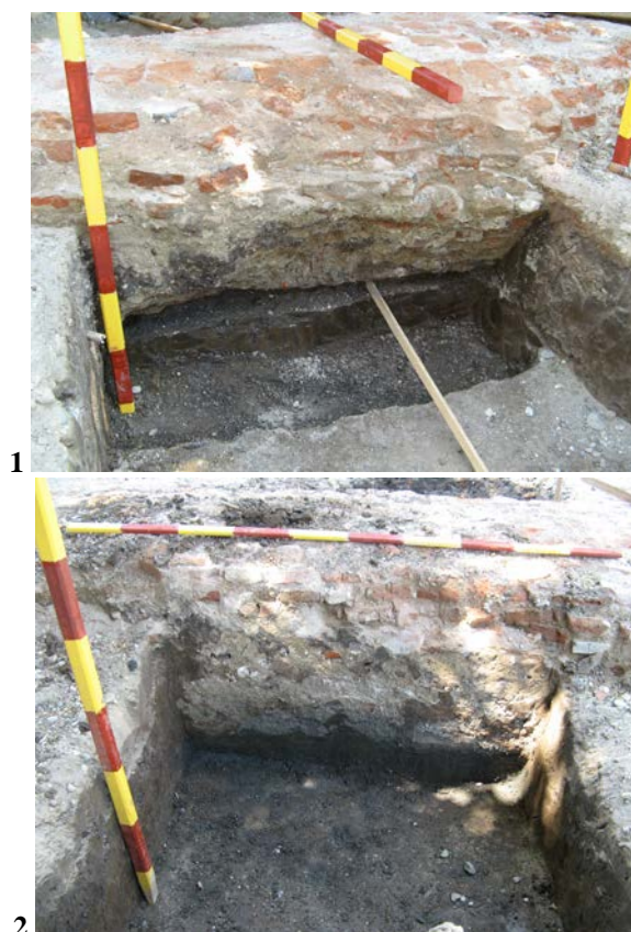
Fig. 7. Fundația Bisericii Sf. Nicolae, 1812. 1 Caseta exterioară pe latura de nord a naosului; 2 Caseta interioară pe latura de nord a naosului.

Lângă bordura dinspre vest a trotuarului, în interiorul spațiului bisericii, am surprins fragmente dintr-un alt zid, distrus în mare parte de intervenții recente (conductă de apă, la -0,7 m adâncime), perpendicular pe fundația nordică și asemănător cu aceasta ca și tehnică de execuție și compoziție, pe care îl putem considera delimitarea dintre pronaosul și naosul bisericii de la 1812.