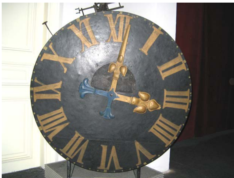
Fig. 2. Ceasului Bisericii Sf. Nicolae – 1873 (Muzeul Județean Argeș).