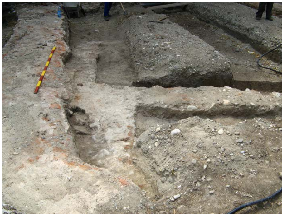
Fig. 9. Vestigiile bisericii vechi. Vedere dinspre est.

Din biserica veche, ridicată din cărămidă către mijlocul sec. al XVIII-lea, și alcătuită foarte probabil numai din naos și altar, au putut fi surprinse fundația zidului sudic al naosului și parțial cea a altarului (inclusiv despărțitura dintre naos și altar – Fig. 9), precum și un mic fragment (1,6 m lungime) din extremitatea de nord a fundației peretelui vestic al naosului.