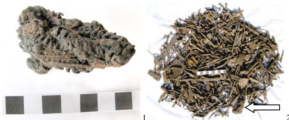
Fig. 2. Cetățeni. 1 Fragment de cămașă de zale din fier; 2 Obiecte metalice descoperite într-un atelier de fierărie.

Acest fragment, fără a fi individualizat printr-un anumit număr de inventar, era inclus între vestigiile unui atelier medieval de fierărie descoperit la Cetățeni, expuse parțial în expoziția permanentă a muzeului, laolaltă cu alte piese metalice fragmentare sau rebutate (cuie, piroane, scoabe, verigi, lame de fier etc.), mai mult de o sută în total și cântărind mai bine de 3 kg de fier (Fig. 2/2).