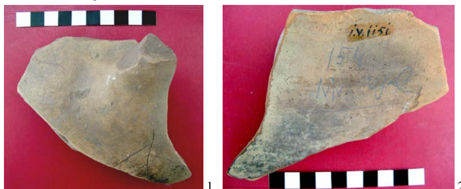
Fig. 1. Fragment de amforă rhodiană din „Mormântul regal“ de la Cetățeni.

de șantier, scris cu creion chimic direct pe spatele fragmentului de amforă: „154“, iar dedesubt „Mr. regal“.