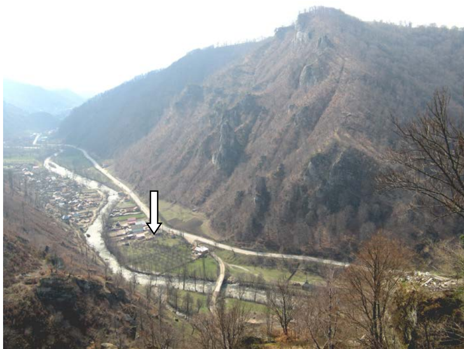
Fig. 3. Locul descoperirii mormântului 1 de la Cetățeni. Vedere către sud-vest de pe monticolul Cetățuia. Foto Dragoș Măndescu, 2008.