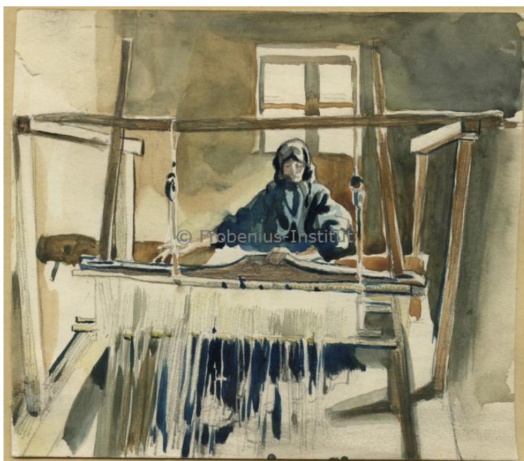
Fig. 4. Lucrări (acuarele) realizate de Rudolf Schweizer-Cumpăna în 1917, la Mănăstirea. Arhiva documentară a Institutului Frobenius pentru Cercetare în Antropologie Culturală din cadrul Universității „Goethe”, Frankfurt am Main.