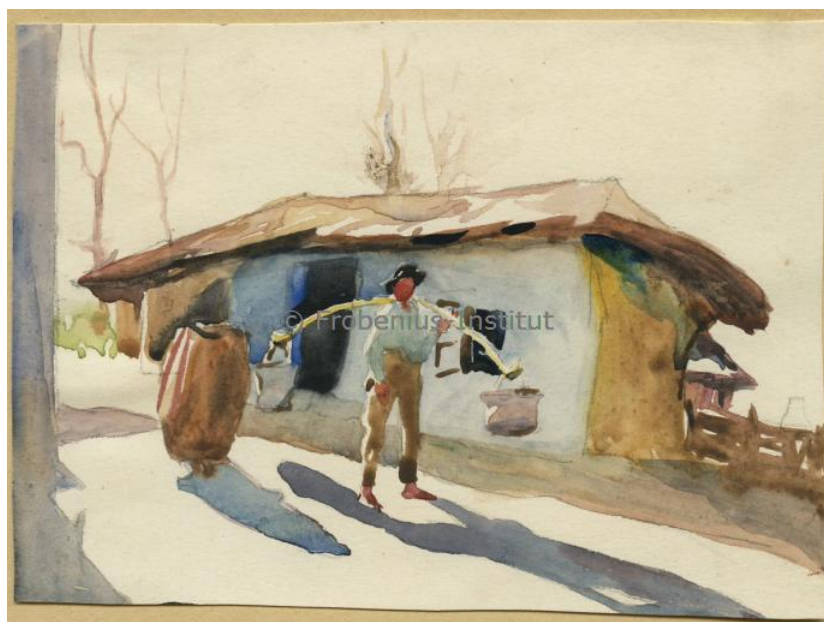
Fig. 3. Lucrări (acuarele) realizate de Rudolf Schweitzer-Cumpăna în 1917, la Mănăstirea. Arhiva documentară a Institutului Frobenius pentru Cercetare în Antropologie Culturală din cadrul Universității „Goethe”, Frankfurt am Main.