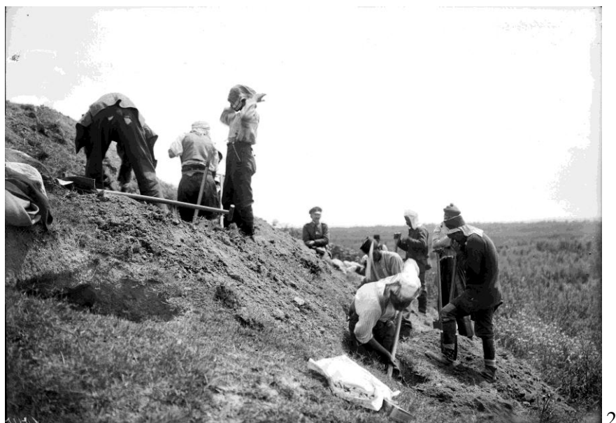
Fig. 2. Explorările arheologice efectuate de Leo Frobenius în sudul României, în 1917. 1 Chiselet-„Măgura Fundeanca”; 2 Cunești-„Măgura Cuneștilor”.