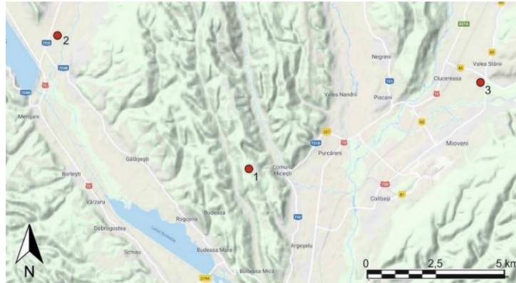
Fig. 2. Locul descoperirii toporului bipen de la Micești (1) și cele mai apropiate situri arheologice din prima epocă a fierului: necropolele de la Bunești-„Guia” (2) și Valea Stânii-„Vărzărie” (3) / The double edged axe from Micești finding spot (1) and the nearest archaeological sites dating back from the Early Iron Age: the necropolises from Bunești-„Guia” (2) and Valea Stânii-„Vărzărie” (3).

Stânii-„Vărzărie”, com. Țițești 43 (la 9,5 km către nord-est, pe valea Râului Târgului). Oricum, toporul nu a aparținut vreunui mormânt, dat fiind nu numai punctul în care a fost găsit, cu totul atipic pentru amplasamentul unor astfel de complexe funerare (știut fiind că necropolele grupului Ferigile sunt amplasate de regulă în locuri joase, aproape de cursurile de ape 44 ), dar și totala absență a urmelor de ardere de pe suprafața sa.