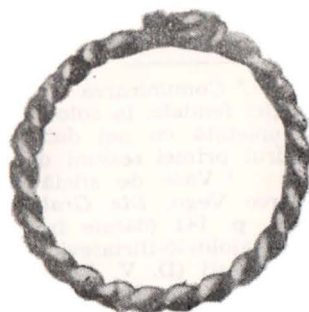
Fig. 3. Inel de argint găsit în gura unui mort la Soslănești (mormântul 6) secolul XVI; 4—5 inele de argint din necropola de la Cetățeni (mormintele 19 și 14 secolul XV).