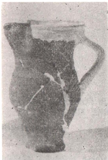
Fig. 1. Vas de lut, descoperit într-un mormânt la Cetățeni (secolul XIV)