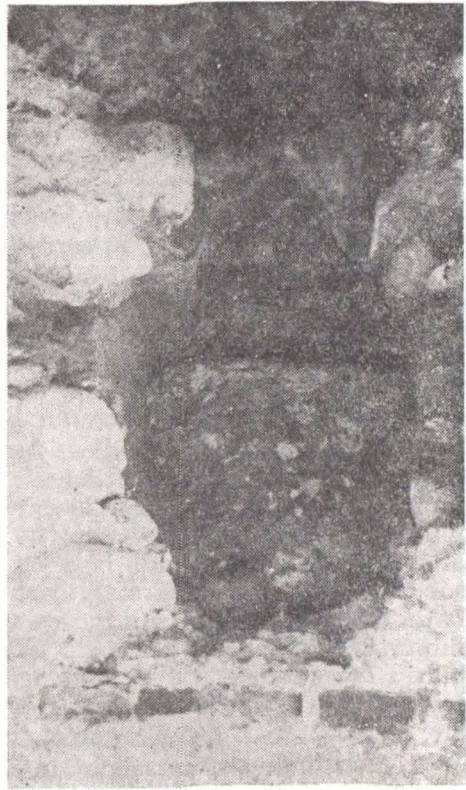
Fig. 4 — Biserica mănăstirii Argeșului. Sondajul din dreptul absidei sudice. Fundație retrasă în raport cu soclul bisericii.

tilă de pământ negru, cu grosimea maximă de 0,40 m — subțindu-se spre exterior — și cu o lățime de cca 0,60 m. Ea continuă și dedesubtul soclului.