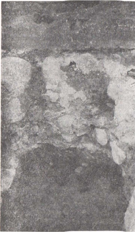
Fig. 3 — Biserica mănăstirii Argeșului. Sondajul din dreptul absidei estice. Fundația bisericii sprijinită pe piloți de lemn.