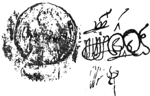
Fig. 4. Sigiliul nr. 3 al lui Mareș Băjescu.

3. Al treilea sigiliu (Fig. 4) al lui Mareș, aplicat pe cărțile din 13 7 și 26 mai 1668 8 , a fost confecționat, potrivit legendei, în 1666, cu ocazia ocupării dregătoriei de mare vornic.