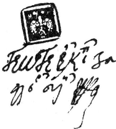
Fig. 8. Sigiliul lui Gheorghe, fiul lui Mareș Băjescu.

Descriere: Sigiliu inelar, pătrat (10 mm x 10 mm), imprimat în tuș negru, în câmp un scut rotund, în câmpul sigilar un leu rampant, cu coada bifurcată. Scutul timbrat de un coif flancat de monograma