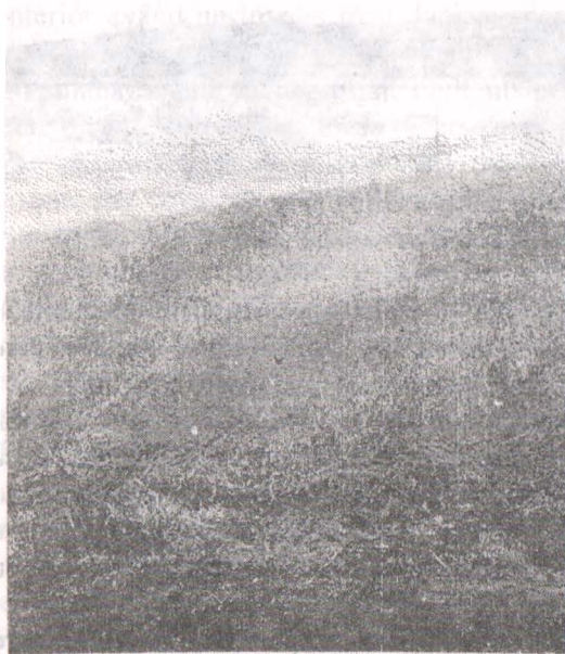
Fig. 1. Secțiunea 1.

Secțiunea 1 s-a trasat pe mijlocul măgurii, pe direcția nord-est, sud-vest având dimensiunile: L = 50 \text{ m} , l = 2 \text{ m} . Datorită fortificării așezării, suprafața interioară locuibilă a fost mai redusă. În aceste condiții depunerile arheologice au atins o grosime variind între 0,15 \text{ m} - 1,20 \text{ m} , corespunzând mai multor niveluri de locuire. Ele au fost grupate în trei niveluri principale: nivelul I (de sus) de culoare brun-roșcat – 0,25 \text{ m} - 0,45 \text{ m} – conține o ceramică mai evoluată ca formă și decor; nivelul II de culoare spre cenușiu – 0,50 \text{ m} - 1,20 \text{ m} conține ceramică în special striată. Urmează un strat de argilă subțire de culoare galbenă. În acest strat negăsindu-se obiecte