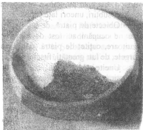
Fig. 3. Strachină.

– Vas cu gât înalt, cu pereții arcuiți, corpul de formă bitronconică, buza evazată, fundul plat. Sunt prevăzute sub buză cu torți sau cu mici butoane și ornamentate cu un decor format în primul