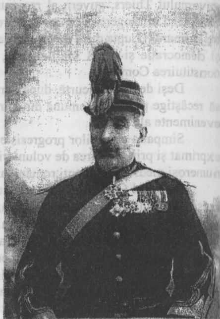
Dr. Nicolae Jugureanu

În octombrie 1865 a fost numit subchirurg la spitalul civil din Focșani. Obține titlul de licențiat în medicină la 17 ianuarie 1869, cu diploma nr. 55, și pleacă apoi în Franța unde se înscrie la Facultatea de medicină din Montpellier. Obține titlul de doctor în medicină cu teza: „Des avantages de l'amputation a la suite des blessures par armes de