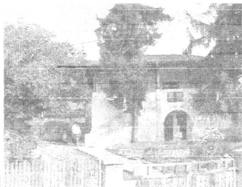
Casa memorială „Liviu Rebreanu”.

La mai bine de jumătate de veac de la dispariția fizică a lui L. Rebreanu, opera lui continuă să fie mai vie ca oricând, dovadă stând operele sale tipărite de diferite edituri și prezente pe rafturile librăriilor din țară. Multe dintre aceste lucrări au intrat și în patrimoniul Casei Memoriale „Liviu Rebreanu”, ca o continuare a ideii după care a fost realizată tematica acestui muzeu, aceea, a păstrării cu sfințenie, a oricărui document care contribuie la cunoașterea vieții și operei marelui scriitor.