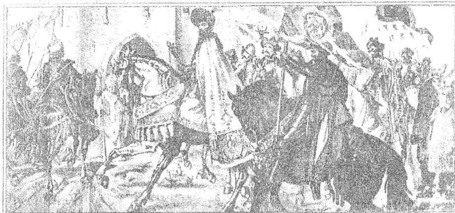
Fig. 6. Secvență din Marea Frescă de la Ateneul Român de Costin Petrescu, Intrarea lui Mihai Viteazul în Alba-Iulia (1 noiembrie 1599) .

Liniile, culorile, compoziția în ansamblul ei, semnificația înaltă a Marii Fresce de la Ateneul Român, originalitatea concepției artistice (fig. 6) și întinderea pe 75 de metri liniari, într-un imens cerc, totalizând 210 metri pătrați în suprafață, în interiorul splendidei rotonde a clădirii în arhitectură clasică.