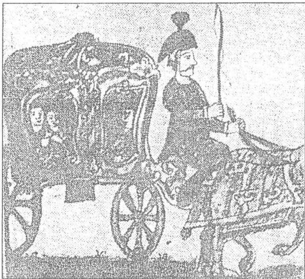
Carosă din București, 1787; miniatură de Petrache Zugravul.

Din exemplele de mai sus rezultă că aceste carete erau confecționate în Transilvania de către maiștri pe măsura timpului. Mai mult, un călător german pe nume Jenne, călătorind, pe la a doua jumătate a sec. al XVIII-lea, prin țările românești, ne informează că în anul 1786, „un conte ungar numit Festetics, mare negustor, făcea bune afaceri cu meseriașii vienezi creând, în București, un depozit de „trăsuri“ în care avea circa 40 de calești, cu preț între 180 și 200 de galbeni bucata 6 .