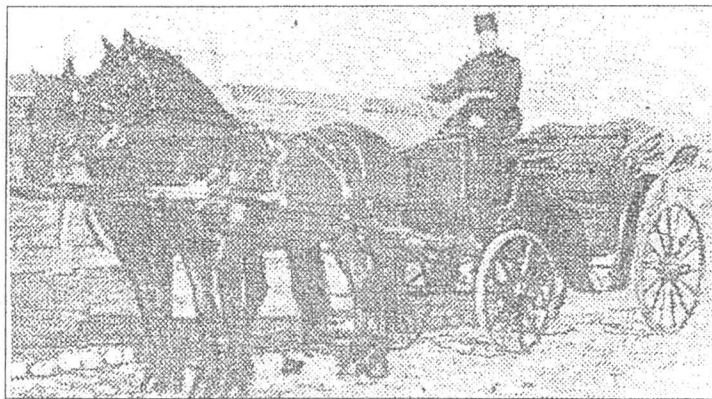
„Muscalul“ cu cai mari, focoși și trăsură luxoasă, în așteptarea clientului, 1922.

Birjaria a fost o meserie cu accente sentimentale, cu tendințe spre eleganță, un fel de high life, și atenție la geometria liniilor curbe cu sensibilitate la profilele subțiri clasice dar rezistente. Profilul birjarului adevărat ne-a arătat un om cu iubire pentru cai, aceste minunate animale, cu tradiții nobile, fiind pentru el prima natură a viețuitoarelor neomenești trăitoare pe pământ. Birjarul nu-și păreașe niciodată birja (trăsura). Era permanent pe capră, aproape nemișcat, așteptând mușterii, care putea să apară oricând, punând piciorul pe scara trăsorii (partea de jos a „aripilor“) se așeza pe pernă și comanda locul de destinație. Hățurile se puneau în mișcare, caii porneau în pas mărunț la început, pentru ca la un îndemn mai ferm al birjarului se așezau pe un trap mai vioi.