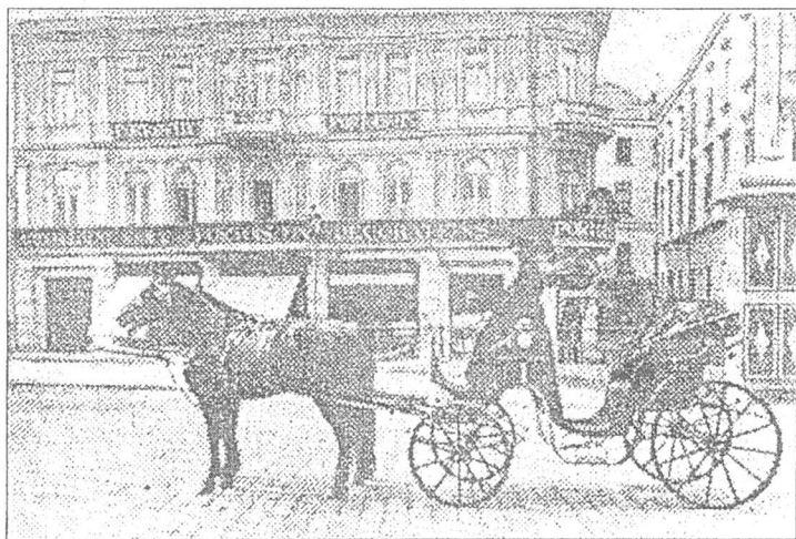
Birjar „muscal“, 1927.