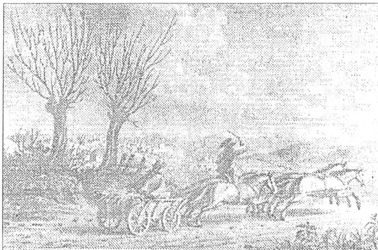
Olac. Căruța de călători și poștă, 1818; gravură de I. Clark.

multe trăsături de nobilitate cu trăsurile și săniile ei, a participat nemijlocit la treburile cetății! Unele monografii enumără mai multe catagrafii cum ar fi: cea din 1837 - cu 32 meserii, 1904 - cu 21 meserii, 1943 cu 40 de meserii, și totuși birjarii lipsesc 8 . Nu este mai puțin adevărat că în graba condeului, unele activități scapă autorilor unor astfel de lucrări în timpul redactării și așternerii pe hârtie a celor mai potrivite idei privind tema care urmează a fi o operă de interes public!