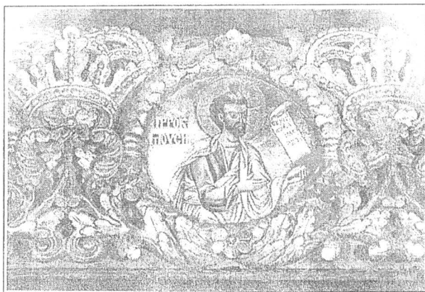
Fig. 2. Fragment din iconostasul de la biserica din Valea Danului.