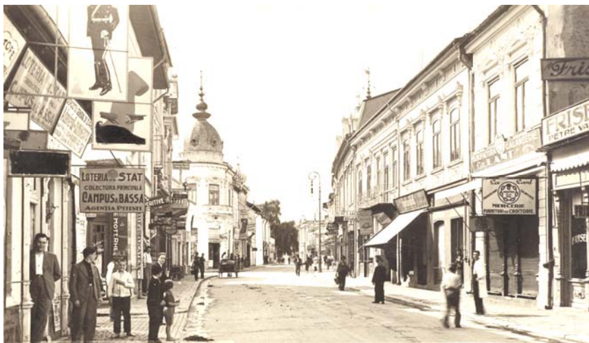
Fig. 1. Strada Șerban-Vodă, astăzi strada Victoriei.

Cu secolul al XIX-lea începe o perioadă de modernizare a orașului, în acest sens înscriindu-se și podirea unor străzi. Nu știm când a fost podit orașul, dar la 1816, când trece prin oraș, baronul austriac Ludwig von Stürmer nota: „Ulițele din Pitești sunt podite, dar destul de prost, cu dulapi grosolani” 8 . Podite înainte de 1816, acestea s-au deteriorat cu timpul, astfel că un raport al Magistratului orașului Pitești, din 1835, ne furnizează detalii despre acest aspect (Fig. 1).