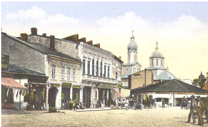
Fig. 2. Piața Episcopiei din Pitești.

Răspunzând, la 14 iulie 1835, poruncii Vorniciei 527, Ocârmuirea Argeș prin raportul 4945 făcea cunoscut că „va pune Ocârmuirea în urmăre dregerea însemnatului pod“ (Fig. 3).