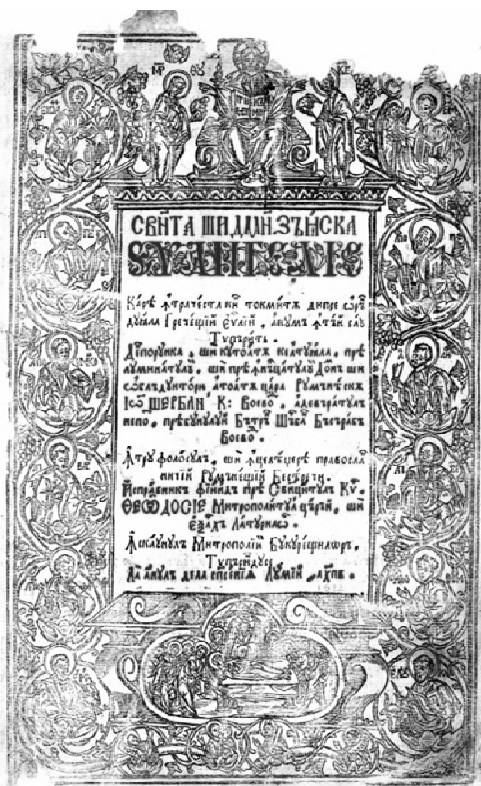
Fig. 3. Evanghelia , 1682, București (arhiva Muzeului Național Cotroceni).

Cultura românească cunoaște o deosebită înflorire în timpul Cantacuzinilor. Arhitectura, pictura, sculptura dar și artele minore își definesc un stil rafinat, propriu epocii. Voievodul Șerban Cantacuzino va arăta, în același timp, o grijă deosebită pentru tipăriturile religioase, traduse din grecește în limba română, pe înțelesul poporului. În 1682, sub oblăduirea voievodului, se tipărea la București, în atelierile de la mitropolie, Sfânta și Dumnezeiasca Evanghelie (Fig. 3). Ispravnicul lucrării era Theodosie, mitropolitul țării. Prima filă a Evangheliei cuprinde, pe verso, stema voievodului, asociată cu stema țării și zece versuri referitoare la aceste steme. Pe fila a doua, în prefață, voievodul arată necesitatea traducerii sfintei cărți, folositoare sufletelor și menționează că pentru aceasta „poruncit-amu fratelui nostru Iordachie Cantacozino, vel stolnicu, de o au îndreptatu și o au așăzatu precumu umblă ce ellinescă, și întru toate asemenea, după rânduială Beserecii Răsăritului, alcătuindu-se și