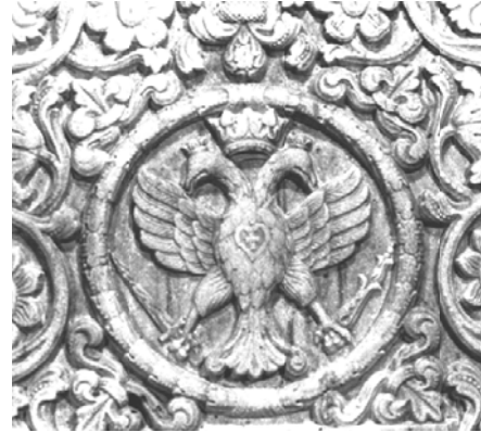
Fig. 5. Detaliu, stema marelui Spătar Iordache Cantacuzino.

Deasupra inscripției este cioplită stema lui Iordache Cantacuzino: într-un medalion circular, ornat cu o ghirlandă de frunze se află acvila bicefală cu capetele încoronate. Între capete, o coroană deschisă; pe piept o inimă cu o cruce în centru. Pasărea ține în gheara dreaptă o spadă iar în gheara stângă doi boboci de lalea, în suită. Era o sinteză a acestui spirit Cantacuzin ce-și petrecuse viața ținând într-o mână spada iar în alta puritatea florilor. În inimă se afla credința creștină care îi călăuzise faptele. Perimetral, lespeda funerară este înconjurată de un chenar fitomorf, desfășurat într-un motiv rinceau (Fig. 4, 5).