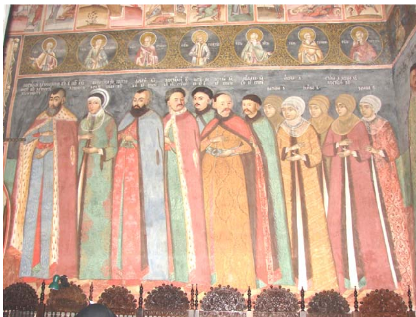
Fig. 1. Boierii Cantacuzini, frescă, biserica M-rii Hurez.

Intrigile politice ale mării boierimi și tinerețea nefericită a lui Iordache Cantacuzino. Anii care au urmat după uciderea în decembrie 1663 a postelnicului Constantin Cantacuzino, la Mănăstirea Snagov, în timpul domniei lui Grigore Ghica (1660-1664), aveau să aducă pentru cei șase fii ai săi (Drăghici, Șerban, Constantin, Mihai, Matei și Iordache - Fig. 1, 2) un șir neîntrerupt de triste episoade. Drăghici, spătarul, primul dintre fiii postelnicului, va fi următoarea victimă, otrăvit la Țarigrad în 1667, în timpul domniei lui Radu Leon (1664-1669), cel pe care, de altfel, Drăghici se ostenise a-l aduce pe scaunul voievodal.