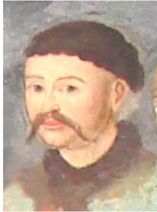
Fig. 2. Iordache Cantacuzino (detaliu)

Cronica țării ne oferă informații precum vornicul Stroe Leurdeanu, Dumitrașco, Gherghe Băleanu, Hrizea vistierul, Staico spătarul, Radu Știrbeiu și alți câțiva boier, o ceată spurcată , țeseau cu mult meșteșug intrigi la urechile voievozilor țării, urmărind îndepărtarea membrilor familiei Cantacuzino de pe scena politică a epocii 1 . Dacă Antonie Vodă din Popești (1669-1672) încercase a face dreptate Cantacuzinilor, după mazierea sa, boierii hicleni, aflați la Adrianopol, susțin revenirea lui Grigore Ghica pe scaunul Valahiei (1672-1673). Reîncep intrigile în dorința de răzbunare împotriva fiilor postelnicului: „făcură sfat drăcesc cătră turci de prinseră pe Mareș banul, i Gheorghe dvornicul, i Radul logofătul Crețulescul, i Mihai Cantacuzino spătarul, i Ghețea clucerul, i Stoian comisul. Iar Șerban Cantacuzino spătarul au scăpat din mijlocul lor. Și aciași porunci