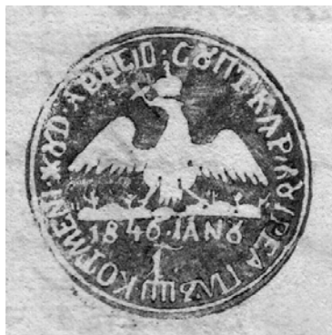
Fig. 4. Sigiliul subocârmuirii plasei Cotmeana, județul Argeș, aplicat la 19 august 1847.

Anterior, am publicat sigiliul subocârmuirii acestei plase teleormănene 11 , aplicat pe un document din anul 1838. Creat, probabil, la începutul perioadei regulamentare, sigiliul, circular, având D = 3 cm, prezintă în câmpul său, pe o terasă verde, acvila cruciată, cu zborul deschis și capul aplecat spre dreapta. Legenda, înspre exteriorul spațiului sigilar, este scrisă cu caractere româno-chirilice: „† ЖЪДЕЦЪА ТЕЛЕОРМАН, ПЛАСА КОТМАНИ” („JUDEȚUL TELEORMAN, PLASA COTMANII”) 12 . Acest sigiliu a fost în uz, inclusiv până în anul 1845.