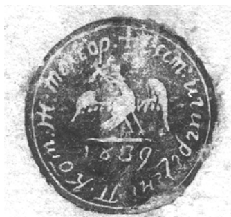
Fig. 1. Sigiliul satului Căcărezeni, aplicat pe zăpissul de la 16 ianuarie 1841.

Cel dintâi act conține sigiliul satului Căcărezeni realizat în anul 1839. Circular, cu D = 3 cm, imprimat în tuș negru, prezintă în câmpul sigilar, pe o terasă verde, acvila cruciată, încoronată, cu zborul deschis și capul aplecat spre dreapta, dar poziționată contrar cerințelor artei heraldice, întrucât este văzută din spate. Sub terasă, anul confecționării sigiliului: 1839. Legenda, înspre exteriorul spațiului sigilar, cu caractere româno-chirilice: „† САТ КЪКЪРЕЗЕНИ, ПЛАСА КОТМЕНИ, ЖУДЕЦЪ ТЕЛЕОРМАН” („† SAT CĂCĂREZENI, PŁASA COTMENI, JUDEȚUL TELEORMAN”). Sigiliul confirmă apartenența satului Căcărezeni la plasa Cotmeana, județul Teleorman.