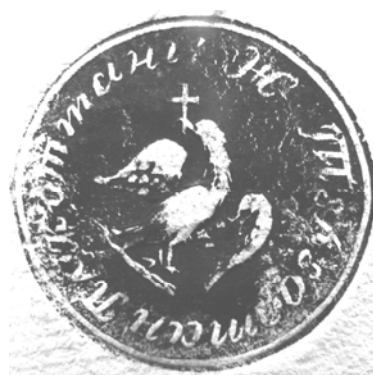
Fig. 3. Sigiliul subocârmuirii plasei Cotmeana, județul Teleorman, aplicat pe un act din 1838.

Înainte de a face descrierea acestuia, se impun câteva precizări despre plasa Cotmeana. Inițial, județul istoric Argeș nu a avut o plasă cu un astfel de nume. Ea a aparținut Teleormanului, județ care se întindea de la Dunăre, ajungând să înglobeze, în partea sa nord-vestică, satele actualmente argeșene: Bradu, Albota, Moșoaia, Hințești, Smeura, Lunca Corbului, Mârghia etc. Localitățile menționate, dar și altele, de pe valea râului Cotmeana – afluent al Vedei, pe teritoriul satului Bădești, comuna Bârla - alcătuiau plasa omonimă. Cea mai mare parte a acestei plase - de la Hârsești în sus - a intrat, cu același nume, în componența județului Argeș, abia la sfârșitul anului 1845, mai exact la 1 ianuarie 1846. A fost o consecință a amplei reforme administrative din 1845, soldată cu desființarea județului Săcuieni și mutarea a numeroase sate, sau chiar a unor plase întregi, de la un județ la altul.