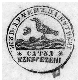
Fig. 2. Sigiliul satului Căcărezeni, aplicat pe zăpisselle din 13 mai 1847 și 19 martie 1850.

Interesant este și sigiliul subocărmuirii plasei Cotmeana, aplicat pe rezoluția pusă la 19 august 1847, pentru zăpissul din 13 martie 1847.