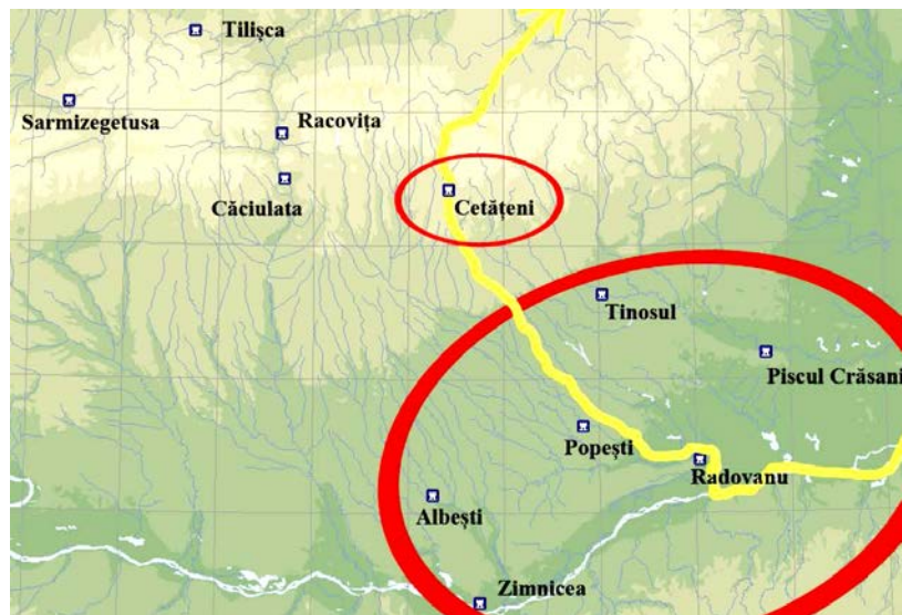
Fig. 1. Situl de la Cetățeni și probabila rută comercială între Dunăre și regiunile intracarpatice.