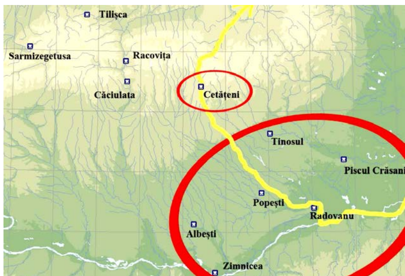
Fig. 1. Situl de la Cetățeni și probabila rută comercială între Dunăre și regiunile intracarpatice.