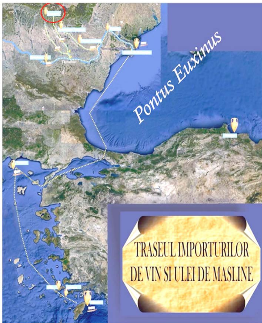
Fig. 4. Ruta maritimă și fluvială din Mediterana la Cetățeni. Grafică Paul Ilie.

puternica legătură dintre caracterul marțial al războinicului și societatea care l-a generat. Armele, bogăția, cetatea și mormântul jalonau și mențineau vizibilă distanța dintre el și ceilalți, subliniindu-i identitatea și forța. Aceste repere relevă un model identitar afișat în timpul vieții, rămas valabil și după moarte, de către acest senior al războiului, atât în raport cu dușmanii lui, dar, mai ales, în fața propriei culturi.