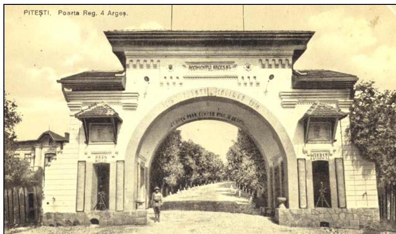
„Poarta Eroilor” ridicată în memoria eroilor Regimentului 4 Argeș; străjuia aleea de acces în cazarmă.

În orice caz, ar fi bine ca ministerul să intervie pe lângă Ministerul Domeniilor spre a se da ordin Dlui. avocat al statului să se intereseze mai de aproape de această afacere” 28 .