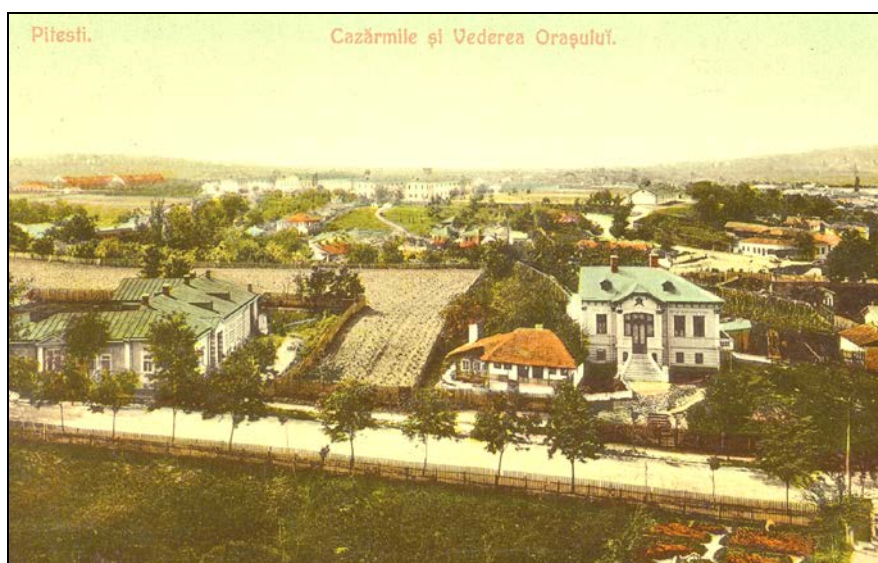
Panorama asupra orașului, în planul îndepărtat se văd cazarmile militare grupate la periferie în „Cartierul Militari”.

În cele scrise despre urbea noastră, și aici mă gândesc mai cu seamă la cei care au încercat să reconstituie istoria acestei localități și a oamenilor săi, în centrul atenției s-a aflat vatra târgului, în mod explicabil, ceea ce mai târziu avea să devină zona centrală. Așa se face că hotarul de demult, se regăsește prea puțin în preocupările celor meniți să povestească concitadinilor despre vremurilor trecute. Sau altfel spus, periferia ocupă un loc... periferic (dacă-mi este permis acest joc de cuvinte) în preocupările cronicarilor locali.