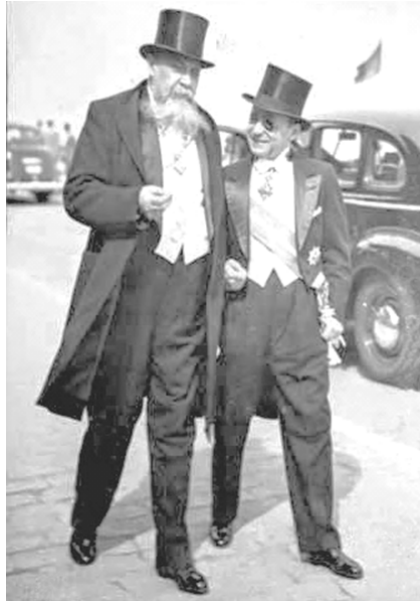
Nicolae Iorga și Armand Călinescu.