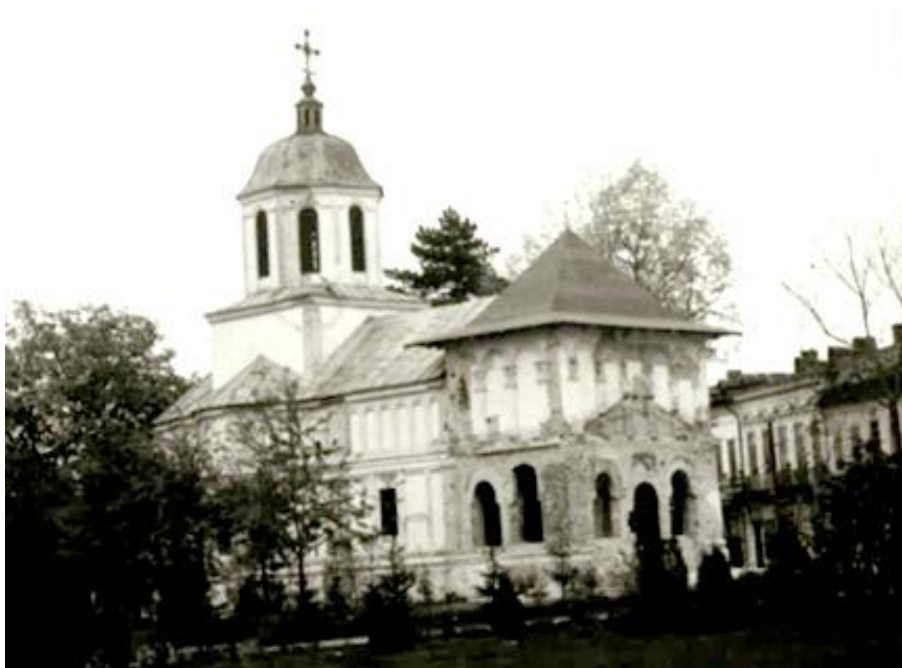
Biserica Domnească din Pitești în timpul restaurării (1963-1968).