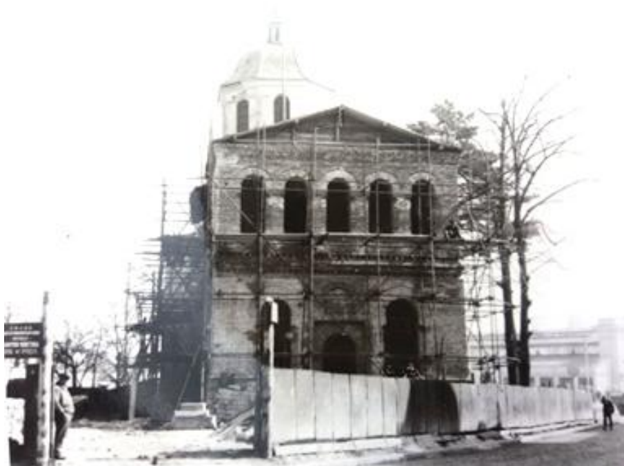
Biserica Domnească din Pitești în timpul restaurării.

La începutul lui septembrie 1963 clopotnița-turn este demolată 70 – între 1964-1966, perioada de încetare a lucrărilor datorită lipsei avizului superior