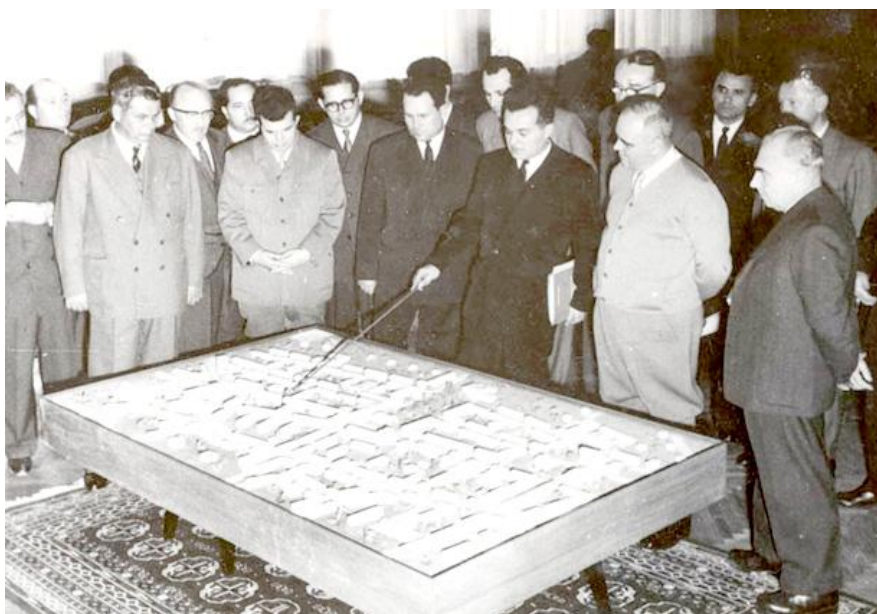
Vizita la Pitești a oficialităților statului român, 1961. Se remarcă prezența lui Gheorghe Gheorghiu Dej și a lui Nicolae Ceaușescu.

Am pierdut ceva în ordinea materială, dar am câștigat mult din punct de vedere estetic, moral și social. (...) Un lucru de mare preț am realizat prin comportarea față de Sfatul Popular: colaborarea activă și mulțumirea reciprocă. Biserica, în raporturile sale cu organele de Stat, trebuie să fie pildă pentru toți cetățenii care, în majoritate, sunt chiar credincioșii Bisericii” 3 . Departe de zgomotul inerent stilului activist, se întrevede cartea dificilă, singura, pe care a avut-o în mână preotul Marin S. Diaconescu și pe care a jucat-o, de nevoie, până la capăt, unde, din păcate, pe tura următorului paroh, avea să descopere – probabil cu surprindere sau nu! – o realitate sinistru de simplă: Sfatul Popular nu are nicio simpatie, în general, pentru Biserică, demolează în 1962 Sf. Nicolae și se pregătește să dea jos și Sf. Gheorghe-Domnesc 4 !