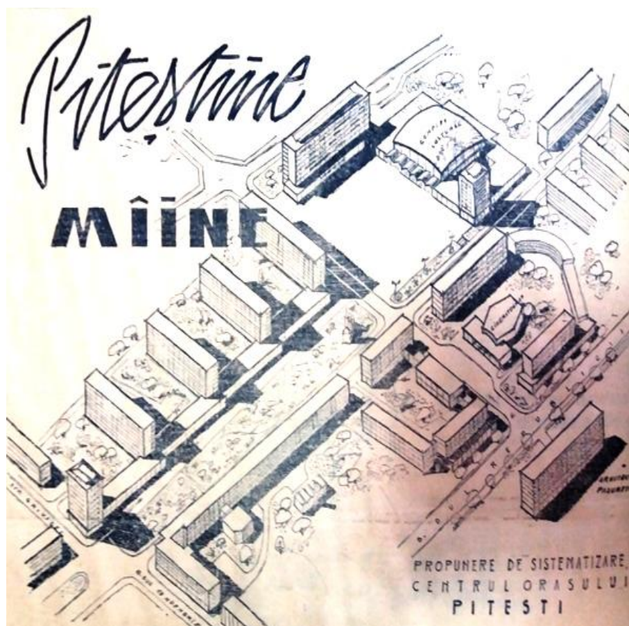
Unul dintre planurile de sistematizare a centrului Piteștiului concurente, cel al arhitectului P. Pădurețu, în care biserica domnească încă era luată în considerare.

Roaită, nr. 1, suprafața de 112 metri pătrați 12 . Atenție, ies din inventar și terenurile de sub clădirile demolate, ele devenind spațiu verde al Sfatului Popular, fără, însă, niciun act de preluare – această situație rămâne zeci de ani un suspans inerent multor abuzuri ale Statului.