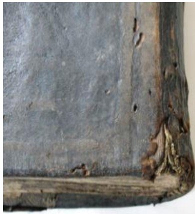
Detaliu învelitoare piele.