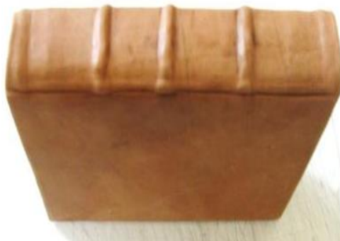
Cartea cu învelitoarea nouă.