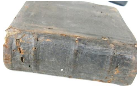
Detaliu nervuri profilate.