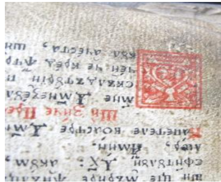
File scrise de mână legate.