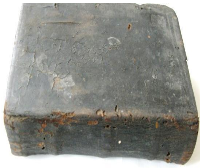
Foto de sus învelitorii.