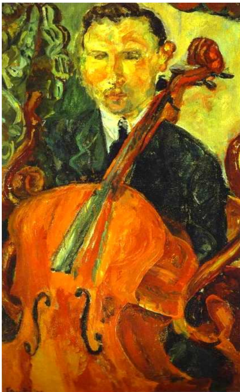
Expresionismul – Chain Soutine - Violoncelistul