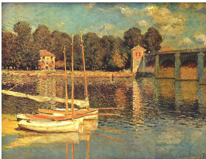
Impresionismul – Claude Monet - Bărci la Argenteuil