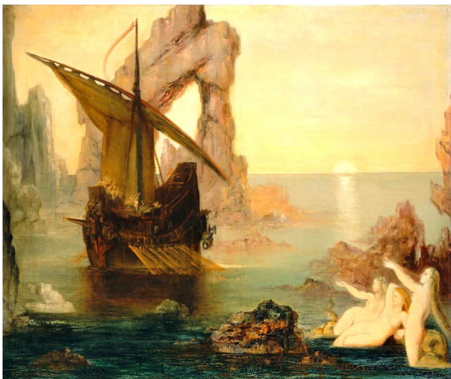
Simbolismul – Gustave Moreau – Eternul Feminin