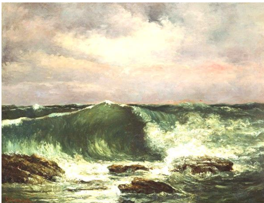
Realismul - Goustave Courbet – Valuri.