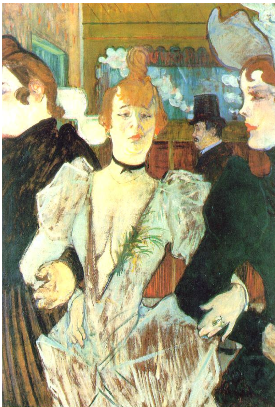
Postimpresionismul - Toulouse Lautrec - La Goulue arrivant au Moulin Rouge