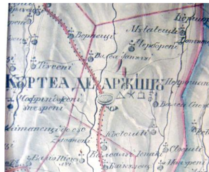
Orașele Pitești, Câmpulung și Curtea de Argeș, după Harta administrativă din 1833.