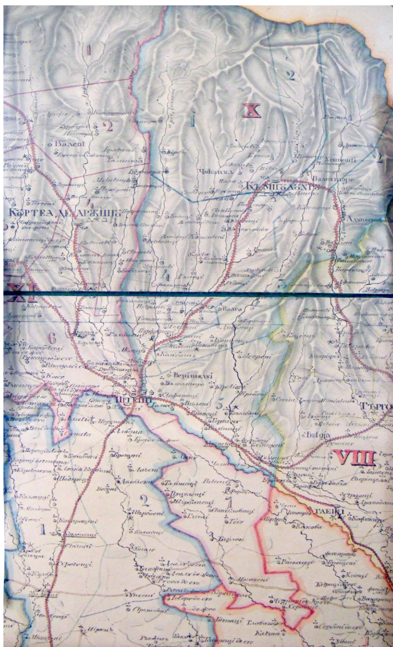
Județele Argeș și Mușcel, după Harta administrativă din 1833.