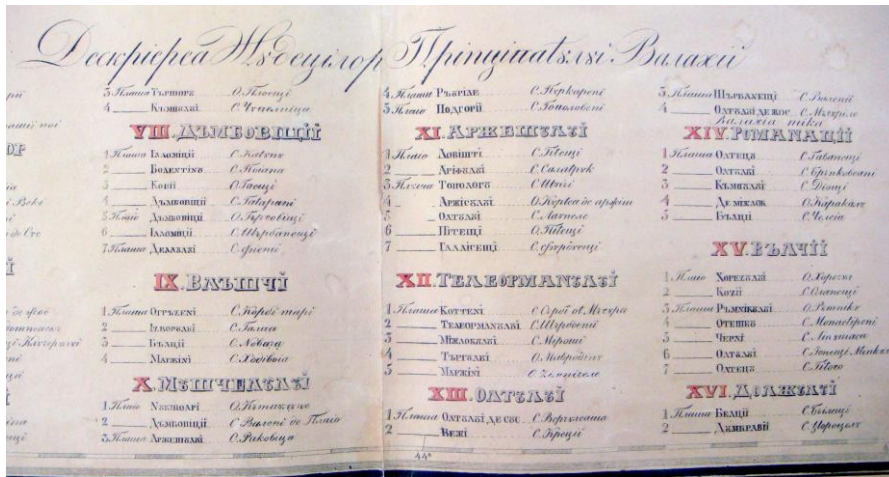
Județele „Prîntîpatului Valahiei”, fragment.