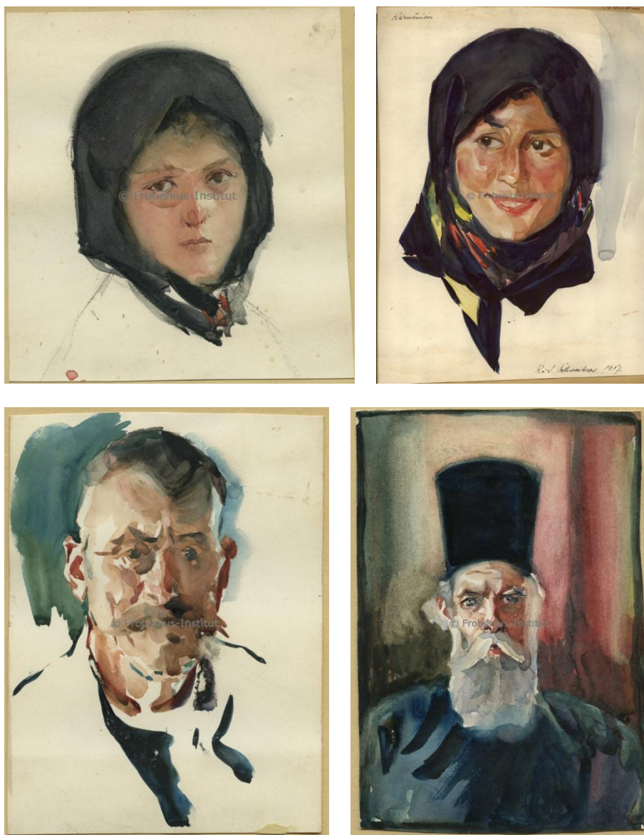
Fig. 5. Lucrări (acuarele) realizate de Rudolf Schweitzer-Cumpăna în 1917, la Mănăstirea.